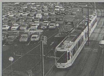
Voitures ou transports publics ?

Ces études sur le logement, la circulation, le patrimoine, l'économie, les espaces verts... seront présentées par leur auteurs (architectes, urbanistes et sociologues), tout au long de la journée du 18 avril, sous forme d'expositions et d'entretiens. L'évolution de Rezé au XX e siècle et les grandes orientations retenues pour la politique urbaine des années à venir seront également présentées en image. De 10h à 18h en mairie. Entrée gratuite.