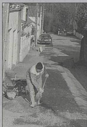
Travaux d'assainissement dans le secteur Crétin/Petit-Bois.

Les travaux d'extension du réseau d'eaux usées rue de la Verrerie (pour un montant de 490 000 F), rue Georges Crétin et Chemin du Petit-Bois sont achevés. La pose d'un réseau d'eaux usées et d'un réseau d'eaux pluviales a débuté mi-février dans la rue de la Coran. Coût : 1,1 MF. La durée prévisible des travaux est de 2 mois. La mise en service des réseaux dépend de celle d'un 3 e collecteur intercommunal, le long de l'Ilette et de la rive gauche de la Sèvre. Elle interviendra l'automne prochain. Par ailleurs, la construction d'une station de relèvement