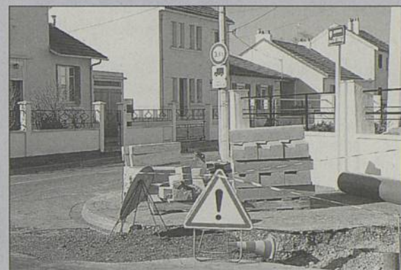
Réfection de trottoirs avenue des Cottages.

Des travaux de remise en état de l'accotement ont été effectués rue Ernest Sauvestre. De plus, dans le cadre de l'aménagement des cheminements piétons en bord de Loire, il a été procédé à la confortation des trottoirs dans la partie Est de la rue Éboué : élargissement du trottoir nord à 2m, création d'un stationnement latéral par marquage au sol, réfection du trottoir sud et du revêtement de la chaussée. Coût : 220 000 F. Enfin, des travaux de réfection de trottoirs ont eu lieu rue des Cottages et rue de la Classerie. Coût : 180 000 F. ▼