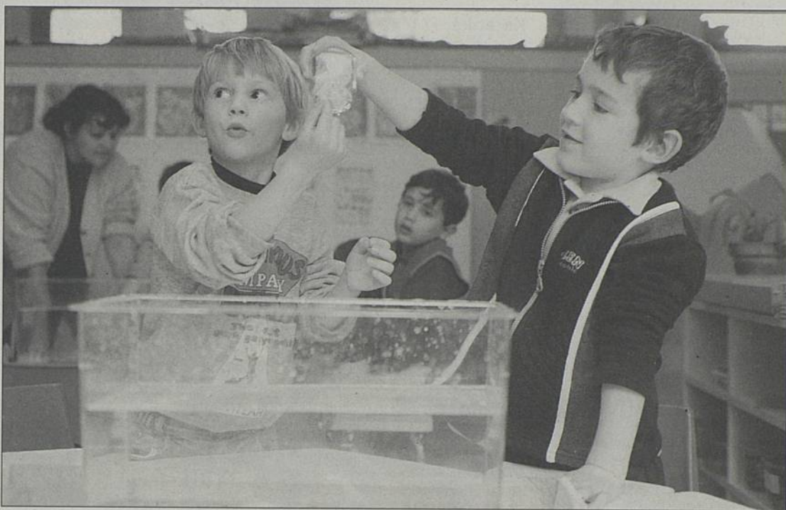
Une trentaine d'enfants de la maternelle Château-Nord ont préparé Exposcience en s'intéressant à «l'air en mouvement».

Du 26 au 29 mars, la Halle de la Trocardière accueillera la première Exposcience départementale. Cette manifestation s'appuie sur l'idée que la culture scientifique doit être partagée par le plus grand nombre. Depuis septembre 97, avec le soutien d'enseignants et d'animateurs, des classes de maternelles, des lycéens, des clubs de jeunes préparent donc ce rendez-vous. Au final, une trentaine de projets seront présentés : l'air et ses propriétés, la navigation et la science, la magie du soleil, le fonctionnement d'un moteur 2 temps, le recyclage des eaux, etc.