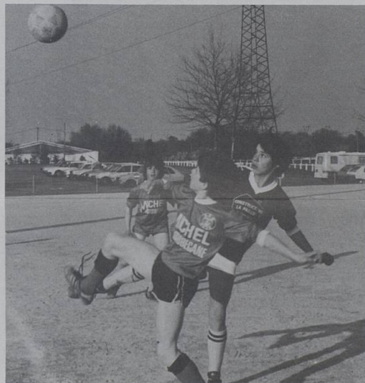
Dynamisme dans les associations.

Le samedi 3 mai, en début d'après-midi, la JOC-JOCF défilera dans les rues de Rezé pour annoncer cette «Ville à Venir» ; puis, avec les autres caravanes de la banlieue nantaise, l'après-midi se clôturera au 2 bis rue des Bons Français à Nantes pour peindre une grande fresque aux thèmes suivants : «Crier la Vie», «Aimer la Vie» et «Jocker la Vie».