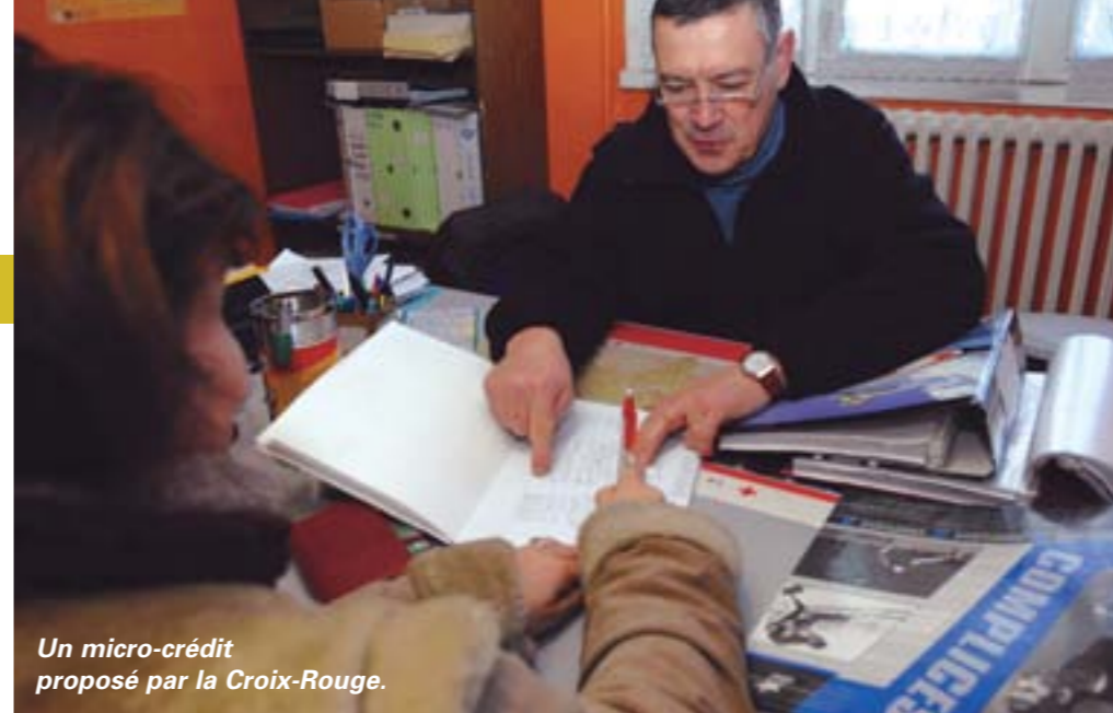
Un micro-crédit proposé par la Croix-Rouge.