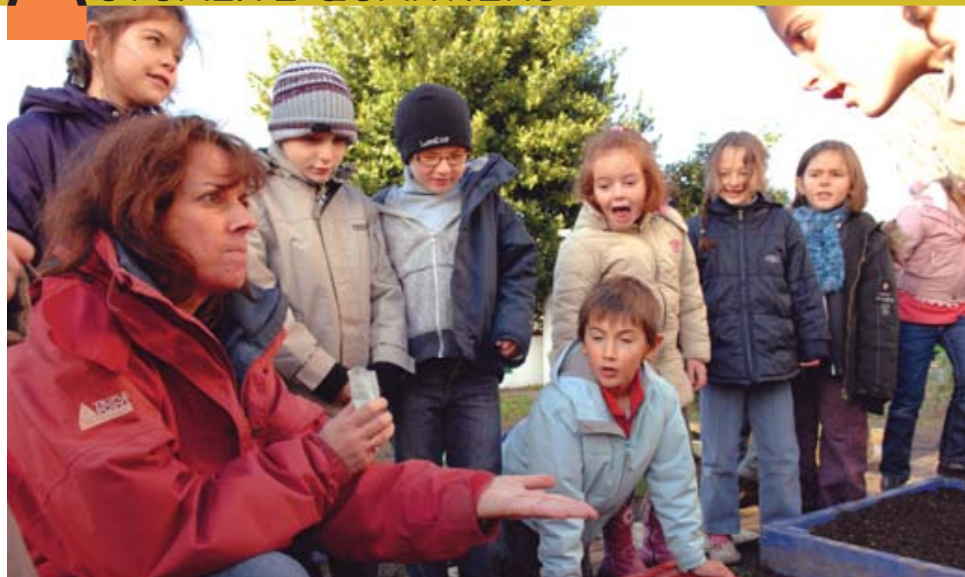
L'institutrice aux enfants : "On creuse un sillon et on dispose les graines pas trop près les unes des autres pour qu'elles aient la place de grandir".