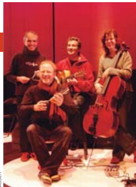
Les Fabulettes d'Anne Sylvestre