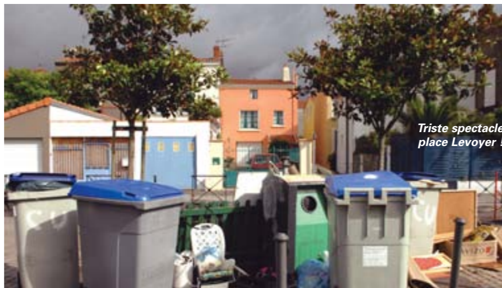
Triste spectacle place Levoayer !

Pour améliorer la gestion des déchets et la propreté des points de collecte, Nantes Métropole a décidé d'installer de nouveaux conteneurs à déchets sur les places Levoayer, Jean-Bart et des Filets. Une bonne nouvelle attendue par les riverains. "C'est une bonne chose, confie Claudine Paque, riveraine. J'ai toujours vu les détritus s'entasser place Levoayer. La situation s'était même aggravée depuis quelque temps car un conteneur était bloqué. Les gens laissaient leurs sacs par terre, les chiens et les chats venaient fouiller dedans... C'était