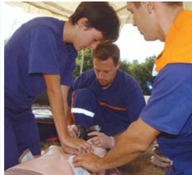
Formation aux premiers secours au centre socioculturel Jaunais-Blordière.