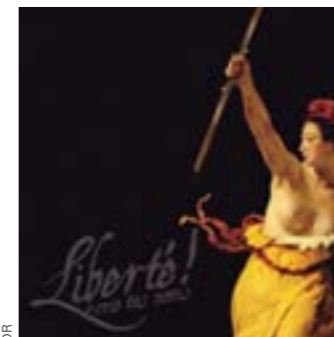
Liberté, je crie tes noms