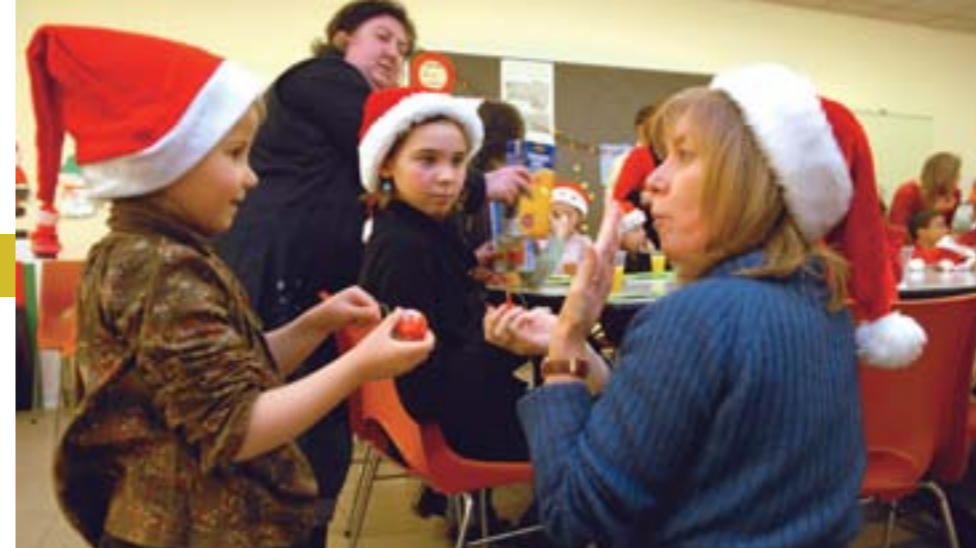
A l'Aimelsf, sourds et entendants participent aux mêmes activités.