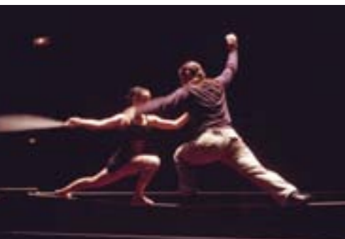
Le Fil sous la neige