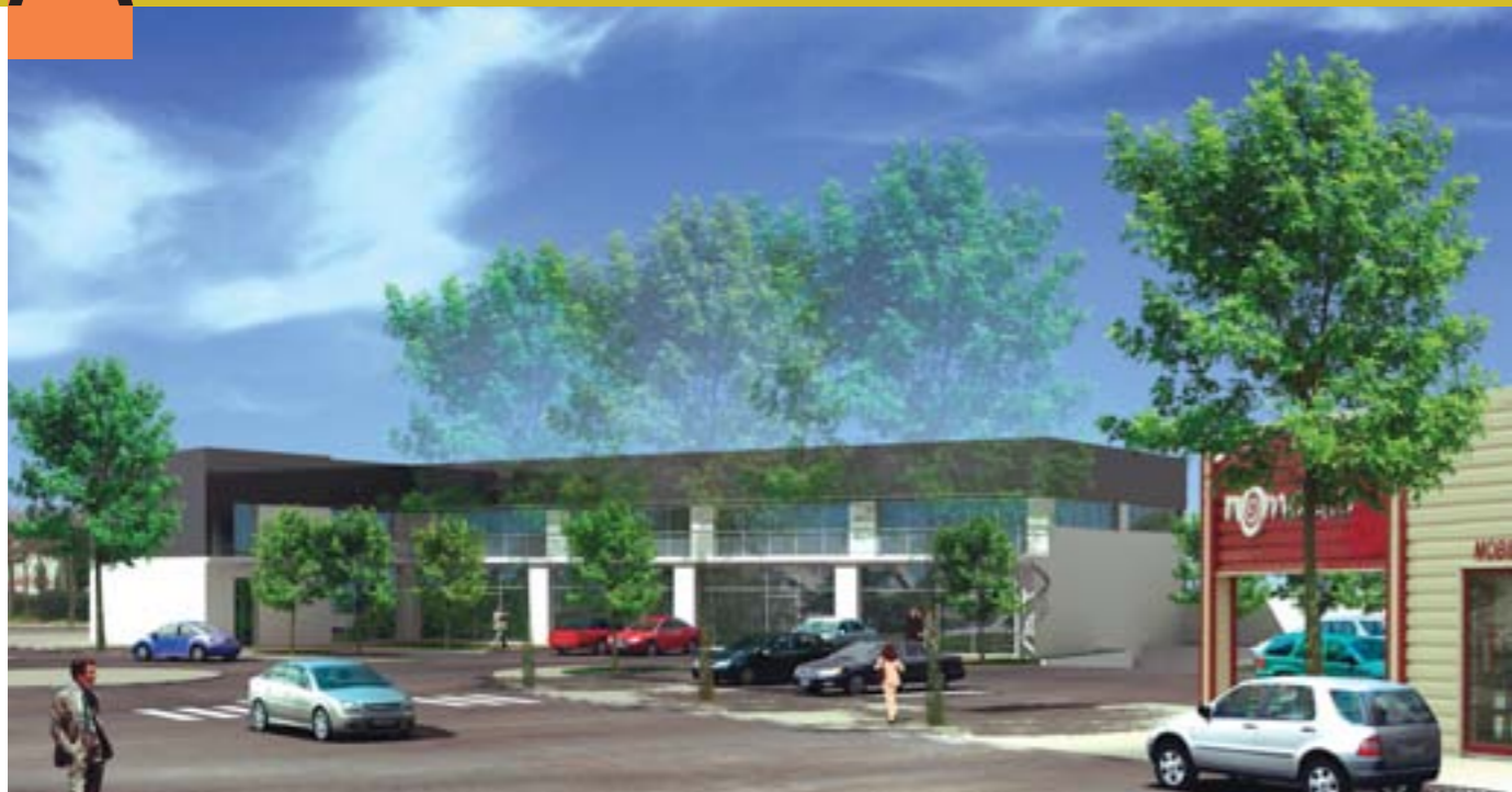
Situé rue Ordronneau, le futur bâtiment abritera des bureaux et une supérette bio.