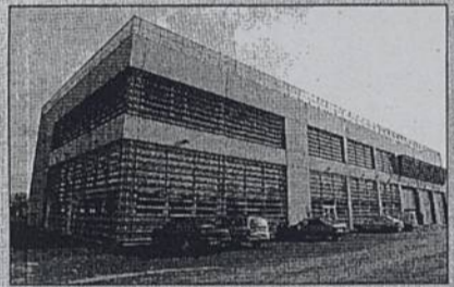
Un bâtiment de 1800 m 2 a été construit.

Au programme de l'inauguration, qui se déroulera en présence de P. Rimbart, président du SAAN, G. Retière, maire de Rezé, F. Verchère, maire de Bouguenais, et J-M Ayrault, président du District et député-maire de Nantes : visite de l'usine à 11h et spectacle intitulé « Le chercheur d'eau », conçu pour les scolaires. En effet, une salle pouvant accueillir 50 personnes a été aménagée : à l'avenir, des animations y seront proposées.