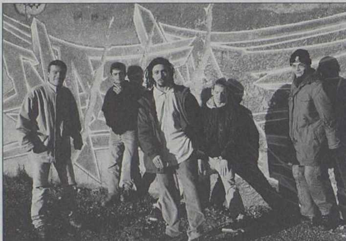
Le groupe «Voilà Weed».

Vendredi 3 à 20h30, la Barakason. MJC. ▼