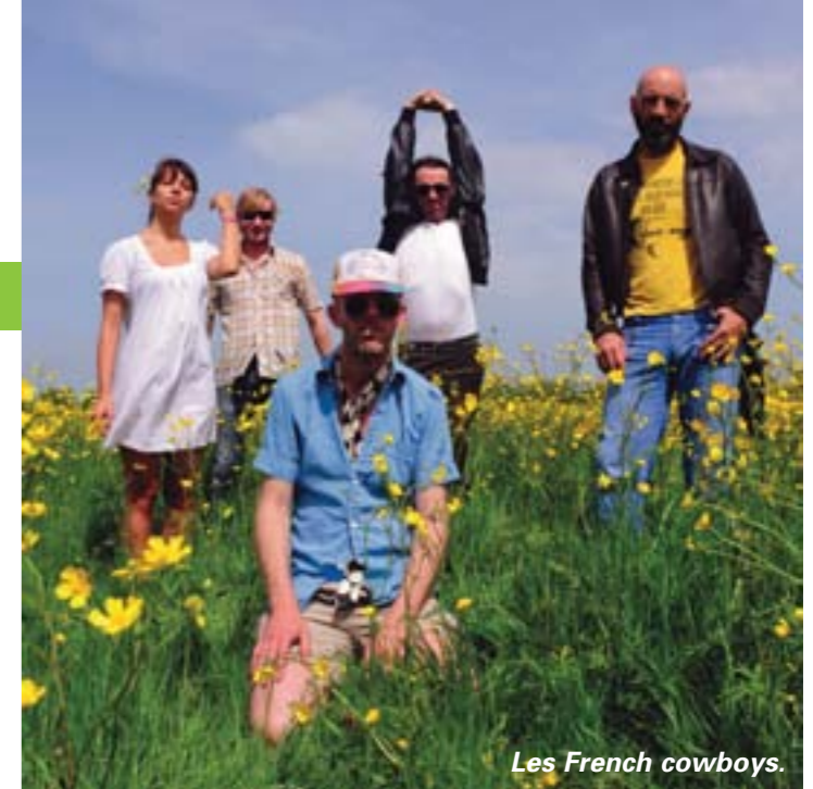
Les French cowboys.

En juin 2009, les 350 millions d'électeurs des 27 pays de l'Union européenne éliront leurs députés européens. Qui peut voter ? Chaque citoyen européen âgé d'au moins 18 ans, inscrit sur les listes électorales européennes et jouissant pleinement de ses droits civiques et politiques. Inscriptions sur les listes en mairie avant le 31 décembre. Rens. 02 40 84 42 02.