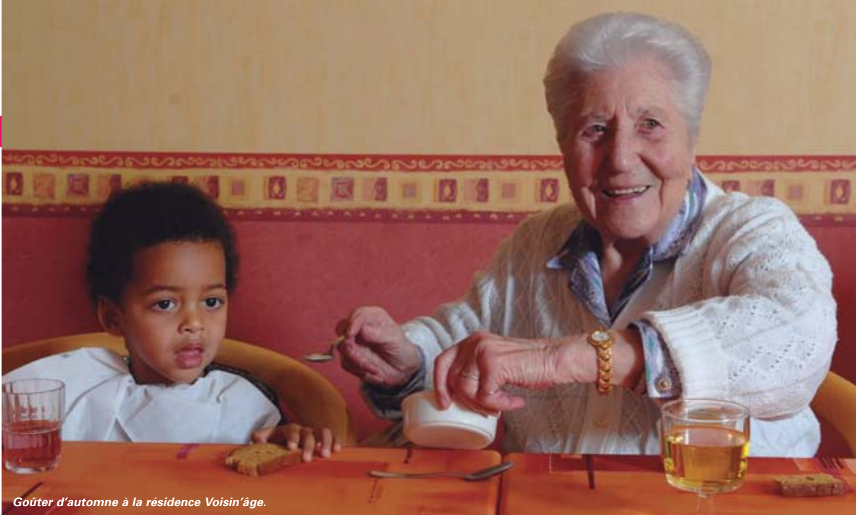
Goûter d'automne à la résidence Voisin'âge.

L'intergénérationnel, on en parle souvent mais concrètement que fait-on vraiment ? A Rezé, plusieurs projets permettent de tricoter des liens entre retraités et enfants.