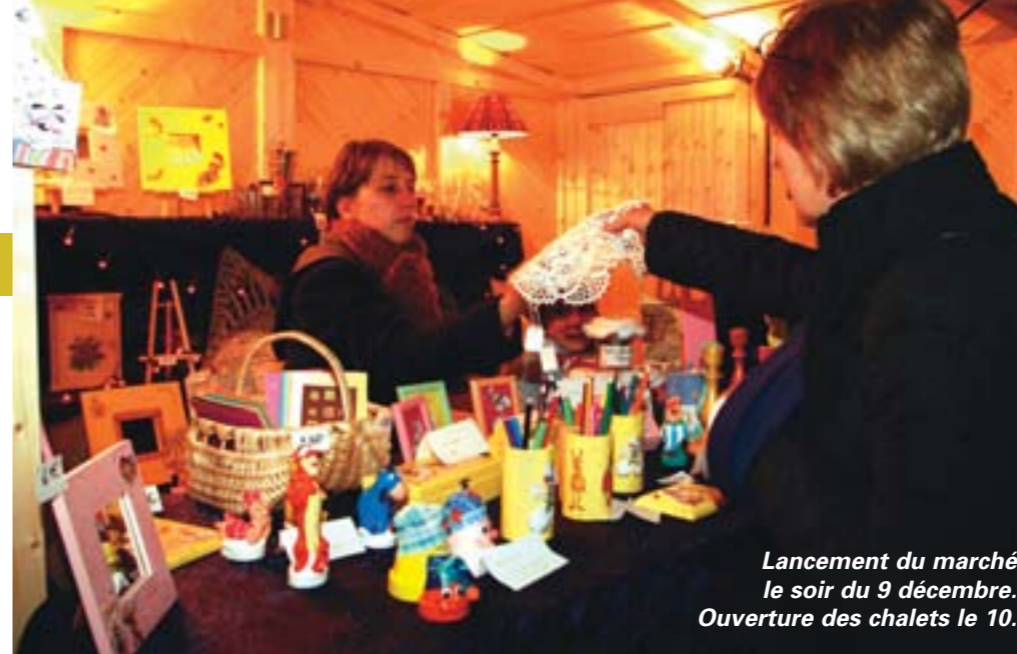
Lancement du marché le soir du 9 décembre. Ouverture des chalets le 10.