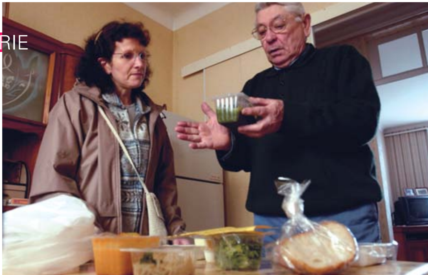
Le portage de repas à domicile et autres services du CCAS sont en partie financés par la DSU.

La Ville de Rezé, tout comme cinq autres communes de l'agglomération, ne perdra pas sa Dotation de solidarité urbaine (DSU) en 2009.