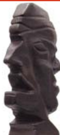
Exposition, Aurélien Porte.