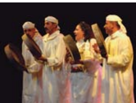
Le blues berbère