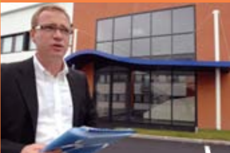
Ragon Espaces Océane : 25 entreprises p 19