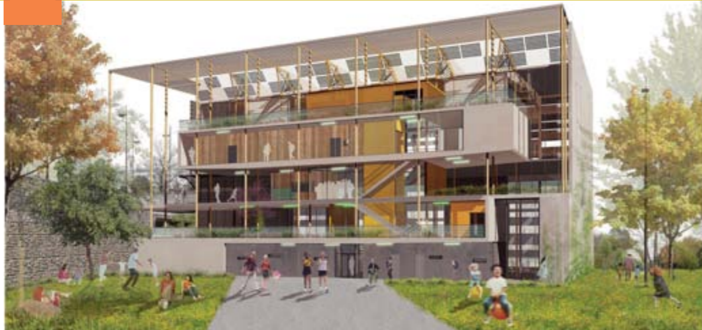
Le gymnase accueillera les gymnastiques artistique et rythmique, l'escalade et le tennis de table.