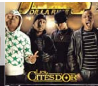
Psy 4 de la Rime