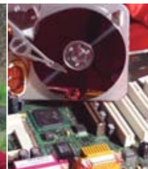
Multimédia, bien choisir...