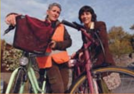
Blordière Infirmières à bicyclette p 14