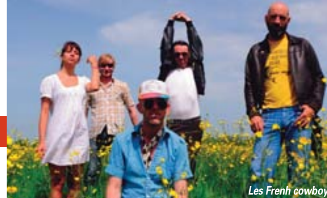
Les Frenh cowboys