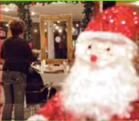
La photo La magie de Noël p 6