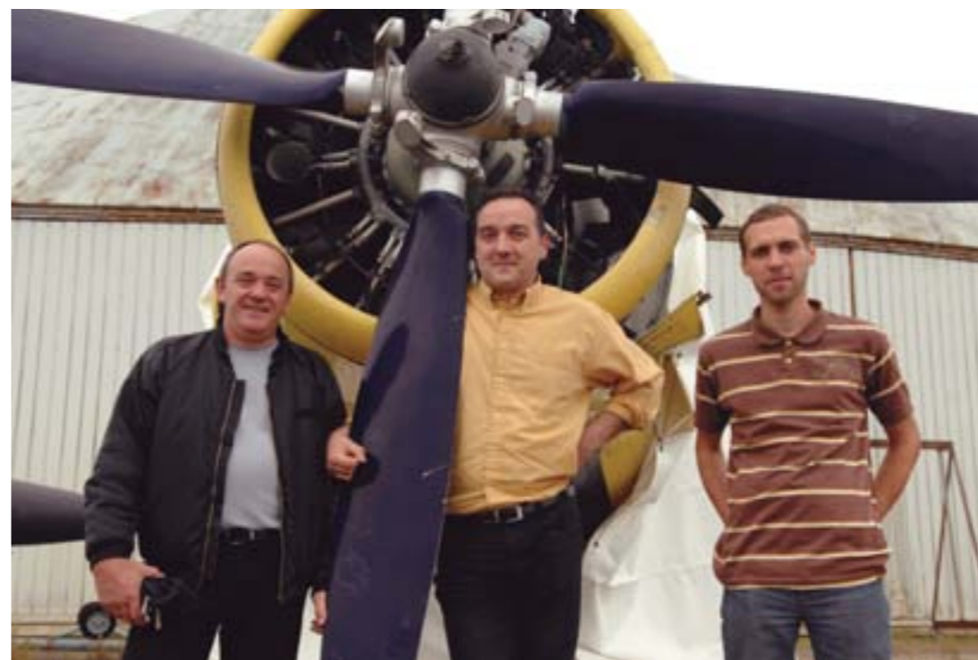
Les chevaliers du ciel des Ailes de l'Ouest.

Contact : 06 25 95 29 89. lesailesdelouest@club-internet.fr