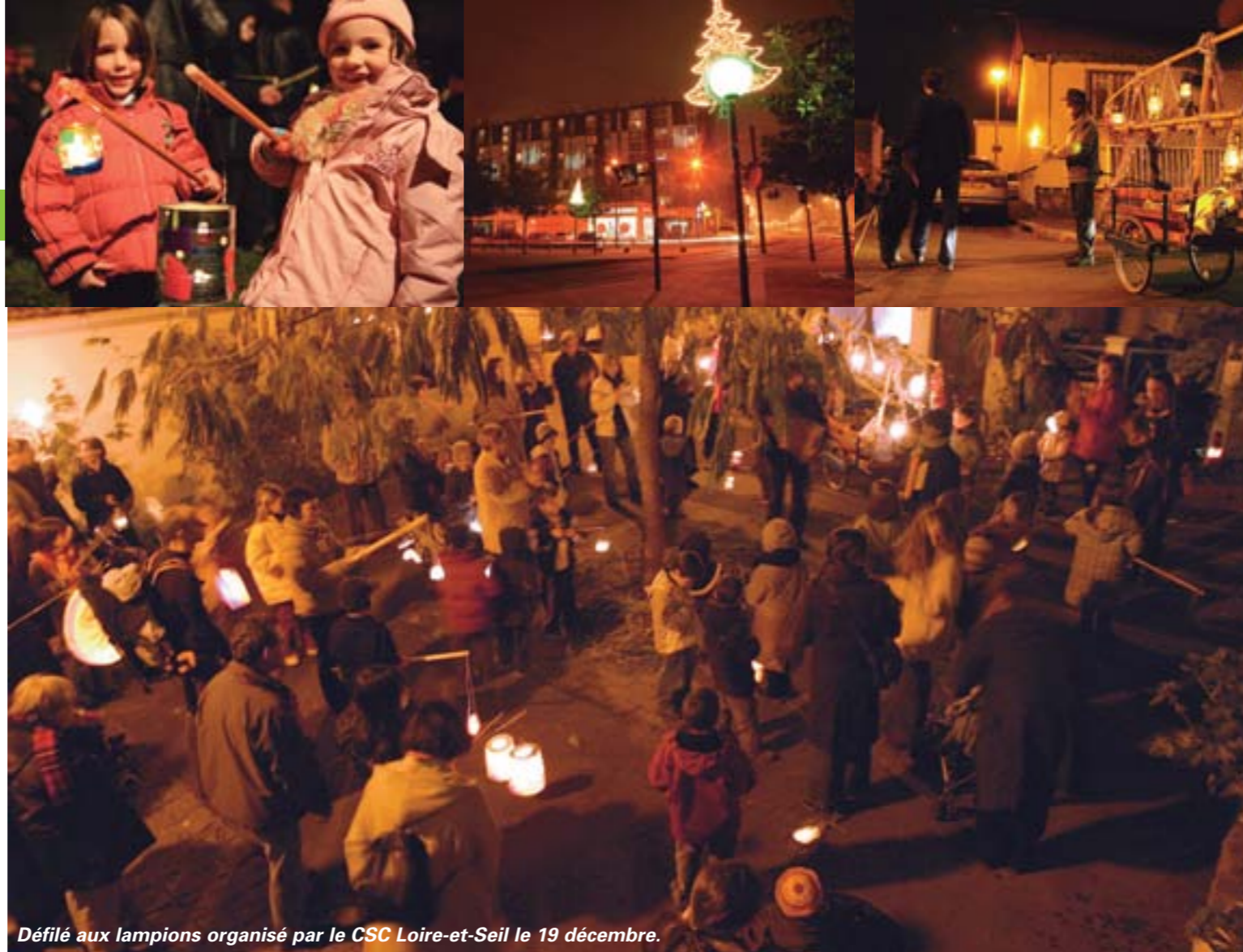
Défilé aux lampions organisé par le CSC Loire-et-Seil le 19 décembre.

Si vous voulez offrir des cadeaux à dominante solidaire, courez à l'expo-vente d'Amnesty international les 6 et 7 décembre. À dominante artistique, faites votre marché de Noël devant le centre commercial du Château du 10 au 24 décembre. Pour la déco, vous souhaitez embellir votre logement et votre quartier sans renoncer au développement durable ? Pensez aux guirlandes dotées de petites ampoules led ou de fils lumières plus économes en énergie.