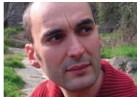
Sélection de rentrée littéraire d'Eric Pessan.