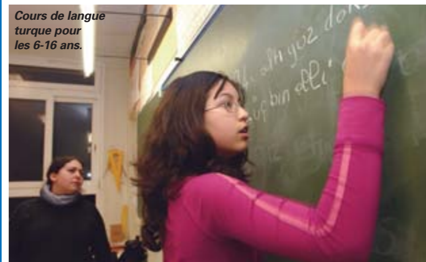
Cours de langue turque pour les 6-16 ans.

■ Fermeture mercredi 10 décembre, de 12h à 17h30 en raison d'une compétition de natation organisée par l'UGSEL 44. Réouverture au public à 17h30.