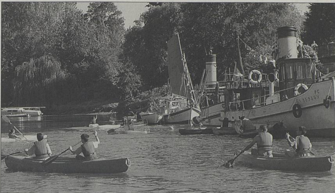
Des balades en Sèvre seront proposées.

La pêche sera le thème principal de la 4 e édition de la fête du quai Léon-Sécher, organisée par les habitants du quartier avec le soutien de la ville et de plusieurs associations.