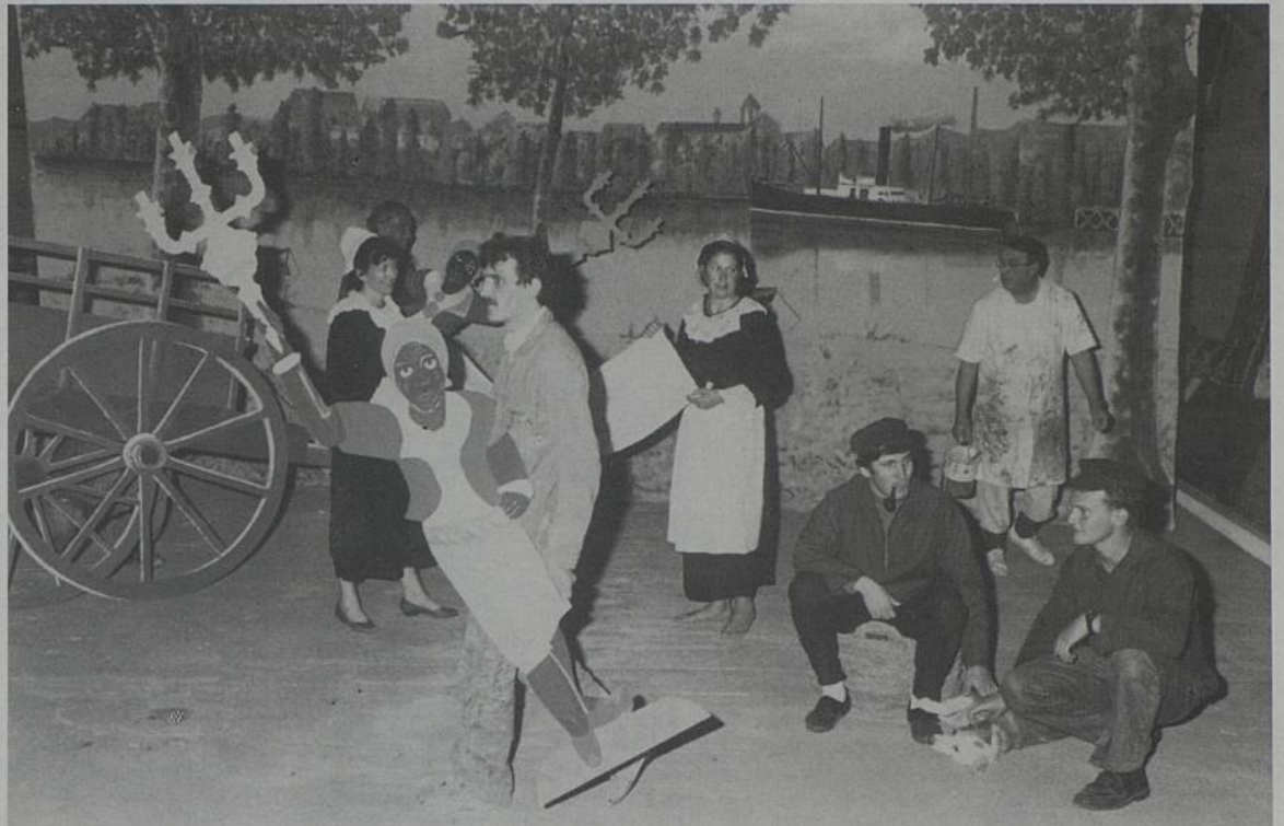
Revue du Théâtre Roussipontains répétitions et dernière main aux décors dans les locaux de Locabâche