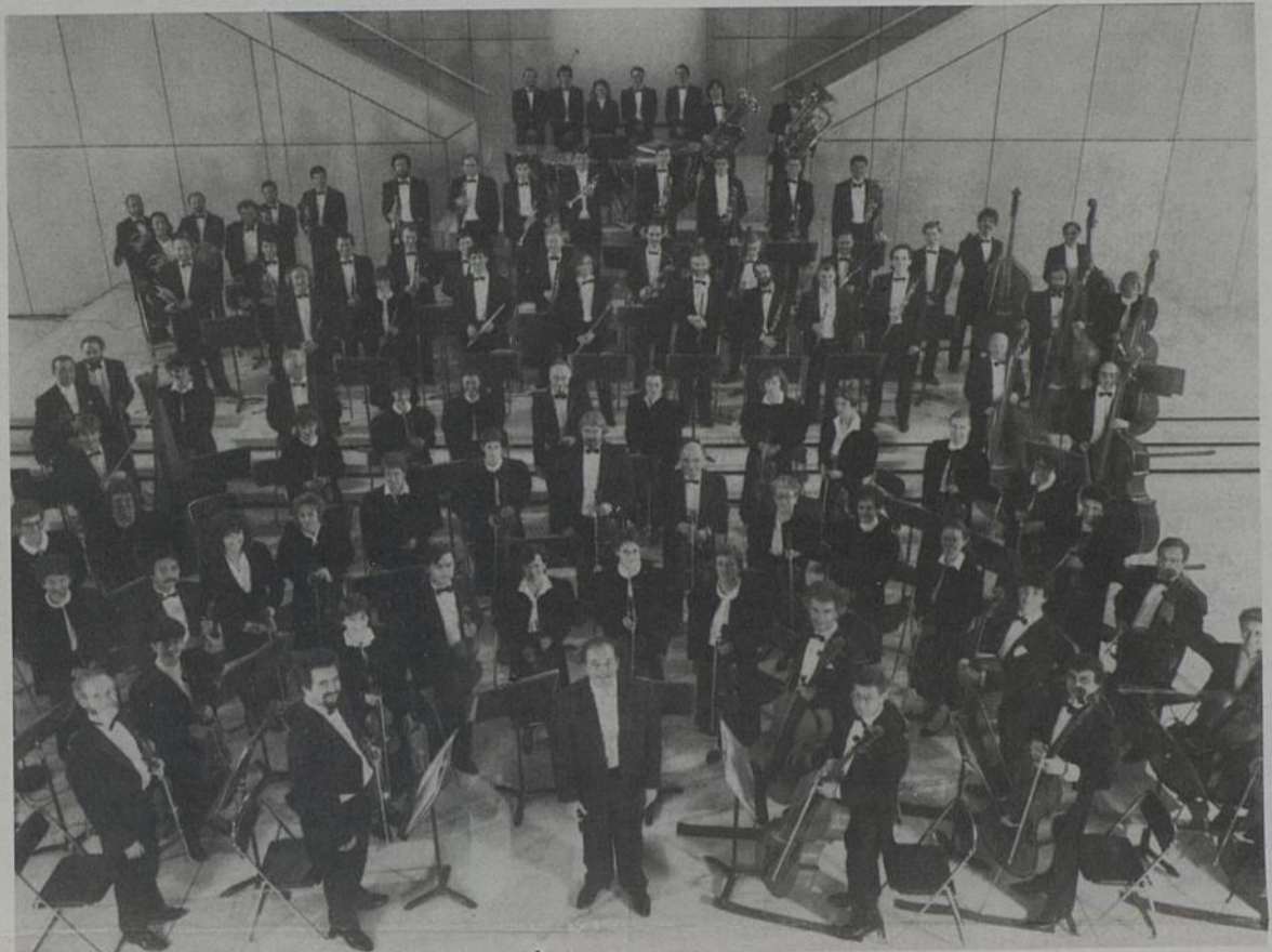
Au programme de ce concert : «L'ouverture de Guillaume Tell» de Rossini, «Concerto pour trompette» de Hummel, «Pavane pour une infante défunte» de Ravel, «Concerto pour trompette» de Aroutounian, «Suite de l'Arlésienne» de Bizet, «Marche hongroise» de Berlioz.

OPÉRATION HUMANITAIRE EXEMPLAIRE : La Société Renault Rezé Cora Sa., Elf-France, le lycée de la Chauvinière, la Ville de Rezé, Atlantic Télévision et l'association Regards croisés s'associent à l'OPPL pour financer la construction d'une bibliothèque de brousse en Casamance (Sénégal). Une bibliothèque, c'est l'outil indispensable pour permettre un meilleur développement de l'école, la conservation des racines, de la culture et de l'identité de ce pays. Sur place, le fonctionnement de cette bibliothèque sera assuré par l'association Regards croisés. Un groupe d'élèves de la Chauvinière participera à la construction.