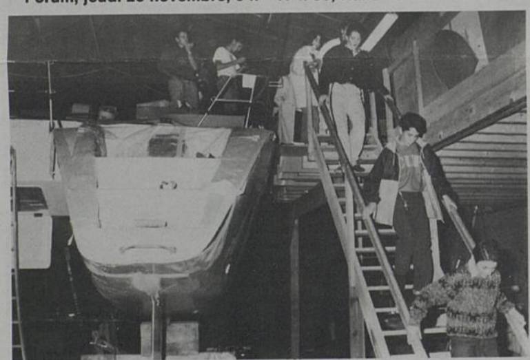
Visite d'école à la Société La Griffe Marine de Trememout.