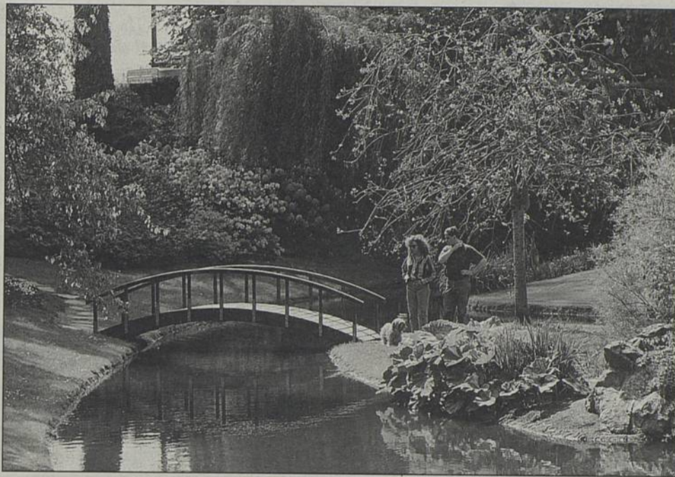
Parc de la Morinière : siège de Rezé-Accueil et première balade conseillée pour les nouveaux Rezéens.

Rezé AVF accueil fêtera ce mois-ci le 20ème anniversaire de son implantation sur Rezé. Cet événement est l'occasion pour les responsables d'inviter tous les Rezéens à une fête amicale le dimanche 24 à partir de 15 h, halle de la Trocardière. Le public pourra assister à un spectacle au cours duquel alterneront danse, gymnastique, magie, chants, etc.