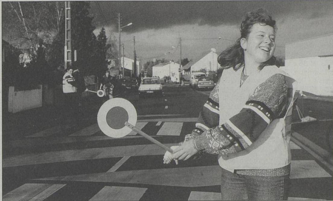
Les «patrouilleurs scolaires» au sortir du collège de Petite Lande.