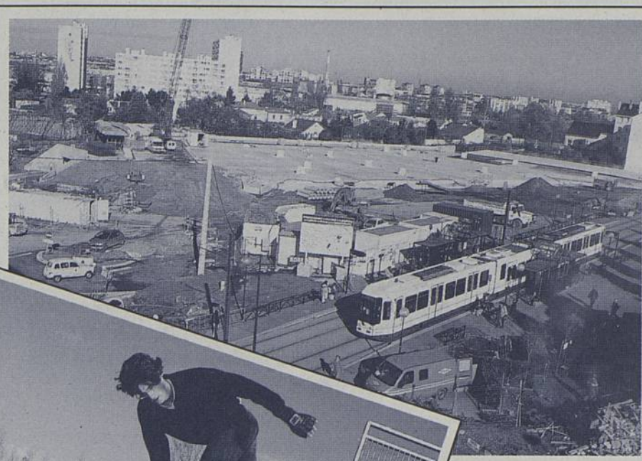
Pendant les travaux d'aménagement du parking du 8 Mai, le marché a été transféré sur le terrain Reffé.