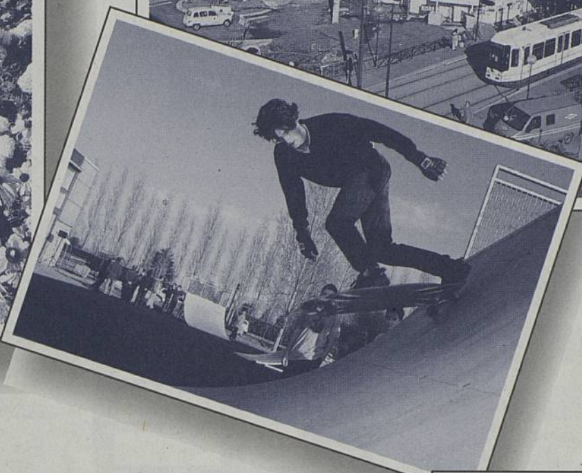
Un nouvel Espace skate a vu le jour dans l'enceinte du complexe sportif de la Trocardière. Il est libre d'accès et ouvert à tous.