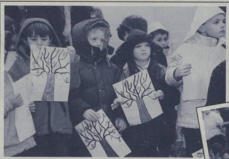
Dans le cadre des festivités 2000 et des Semaines de l'enfant citoyen, les élèves des écoles Salengro et Port-au-Blé ont participé à la plantation d'un arbre du respect.