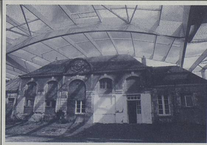
Préservée à la demande de la Ville, l'orangerie du XIX e siècle, située Butte de Praud, se prépare à accueillir une brasserie.