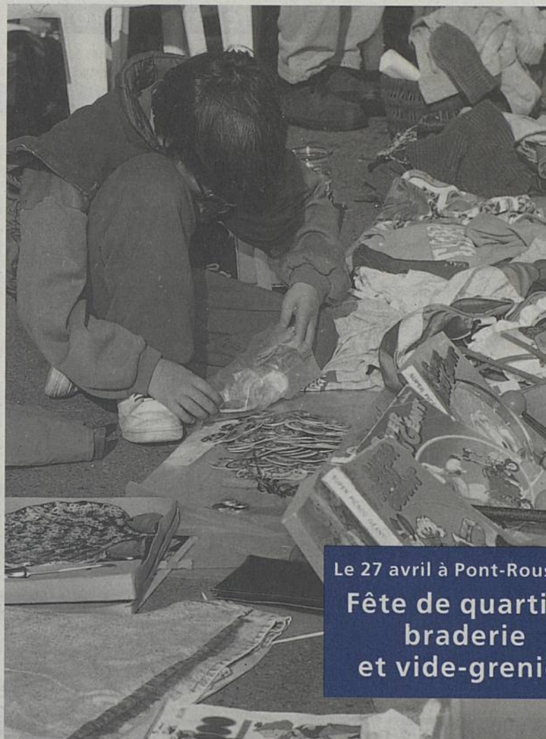
Le 27 avril à Pont-Rousseau Fête de quartier, braderie et vide-grenier

Si vous pensez avoir un problème d'alcool, les Alcooliques Anonymes peuvent peut-être vous aider. Si l'un de vos parents, conjoints, enfants ou amis à un problème d'alcool, les groupes familiaux Al Anon peuvent vous aider. Ces deux groupes se réunissent chaque lundi à 20h30, Maison de quartier, r Vêga. Tél. 02 40 75 23 12 (24h/24) ■