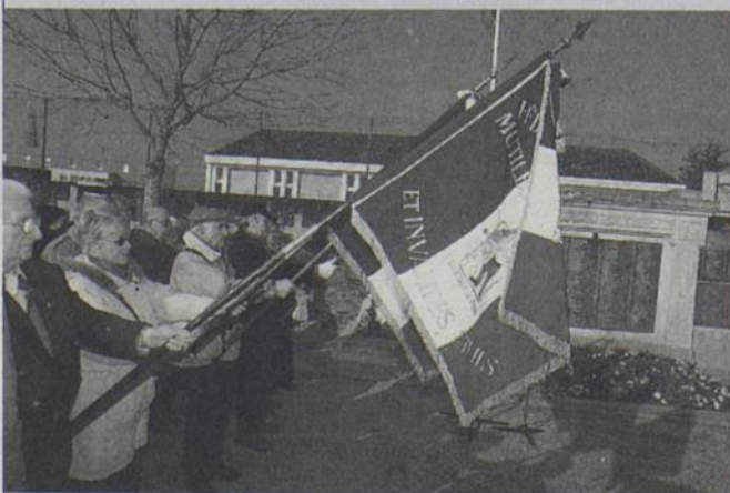
Réaménagé, le Carré des fusillés et des morts pour la France sera inauguré le dimanche 9.

par la Ville et par le Comité d'entente. A 10h45, inauguration du carré des Militaires : lecture d'un poème par un enfant descendant d'une famille de fusillés, appel aux morts commandé par le Maire et fait par deux jeunes ayant participé au Concours de la Résistance, dépôt d'une fleur sur chacune des tombes. A 11h, au théâtre municipal : exposition présentée par le Comité départemental du Souvenir des Fusillés de Châteaubriant et de Nantes, prise de parole des élus, textes dits par les enfants de deux classes de l'école de la Houssais et Jean-Jaurès, avec la participation de la chorale de l'école municipale de musique.