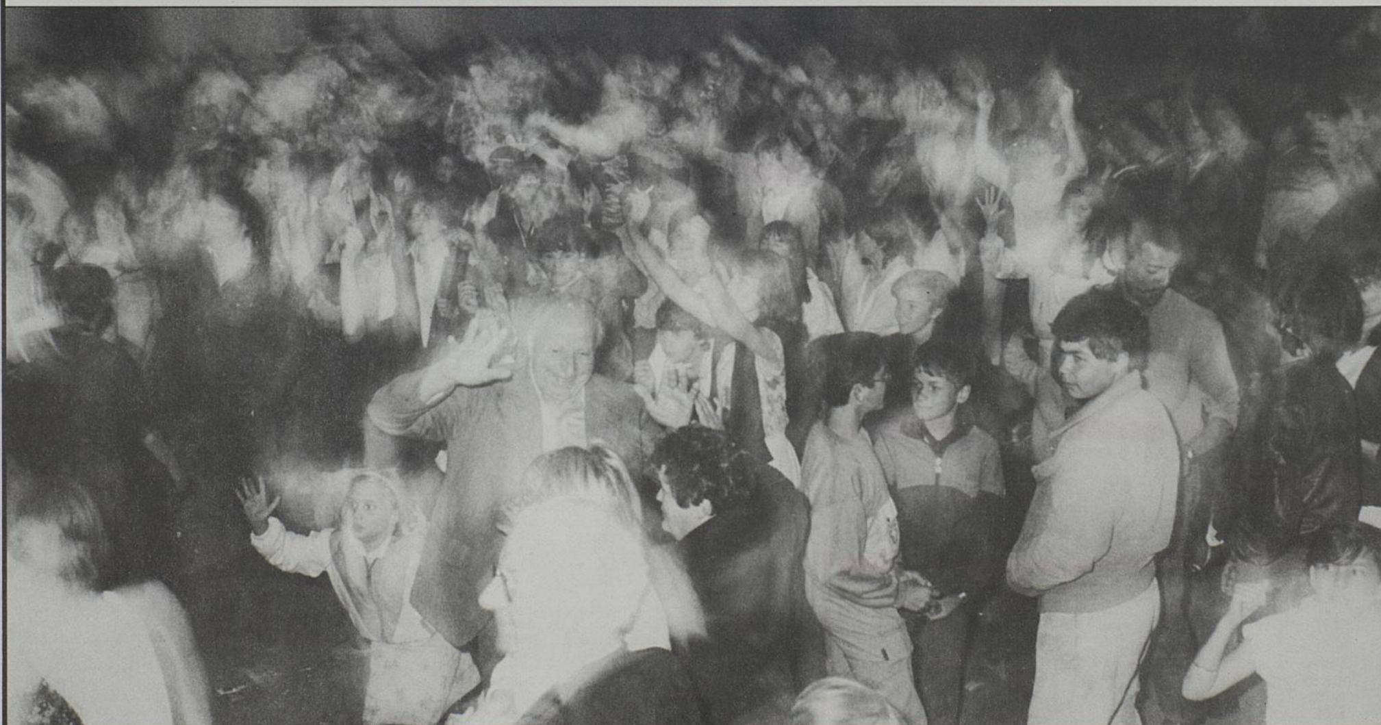
Tourbillons, musique et flons-flons du bal populaire. Rendez-vous en 1987, pour fêter le 100 e anniversaire de la naissance de Charles-Edouard Jeanneret, dit Le Corbusier.