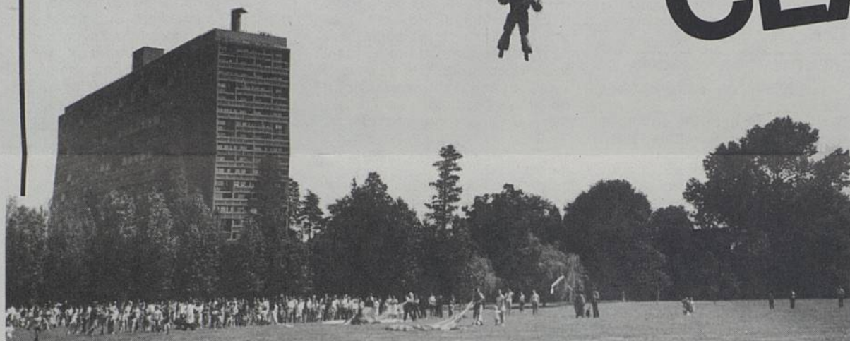
Objet Volant Identifié dans le ciel du Corbu : la fête qui descend des airs.