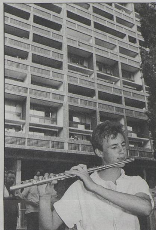
Quand la musique est là... tout va !