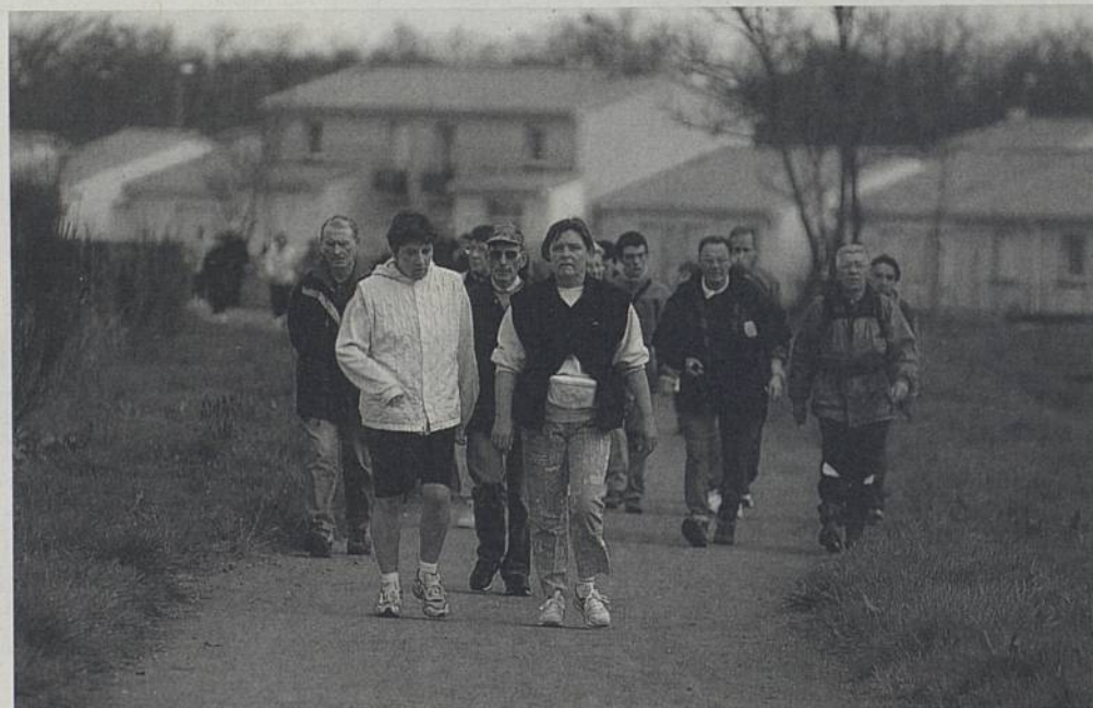
Le Tour de Rezé représente une vingtaine de kilomètres. Mais deux liaisons fléchées offrent des temps de parcours moins importants (voir le tracé en page 4).

Dans le cadre de la Journée mondiale de l'eau, la Ville de Rezé organise un Tour de Rezé à pied. Les promeneurs sont ainsi invités à reprendre contact avec la nature dans la ville et emprunter les sentiers qui bordent la Jaguère, l'Ilette, la Sèvre et la Loire.