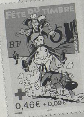
Lucky Luke, héros de la Fête du timbre 2003.

La Fête du timbre est l'une des trois émissions annuelles éditées par la Poste au profit de la Croix Rouge. En achetant ces timbres et en acquittant leur supplément, les collectionneurs contribuent ainsi de manière significative aux actions de l'association humanitaire française. ■