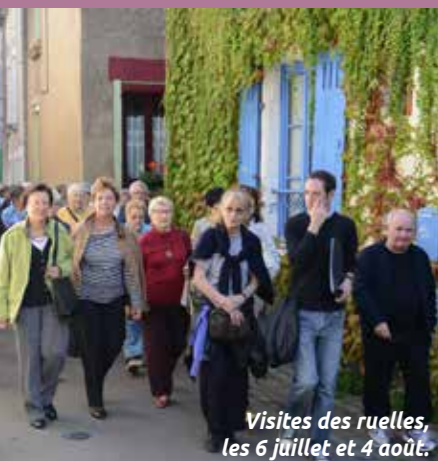
Visites des ruelles, les 6 juillet et 4 août.

- Les incontournables de l'été Faites le plein d'activités en juillet et en août ! Programme à découvrir pages 11, 12 et 13.