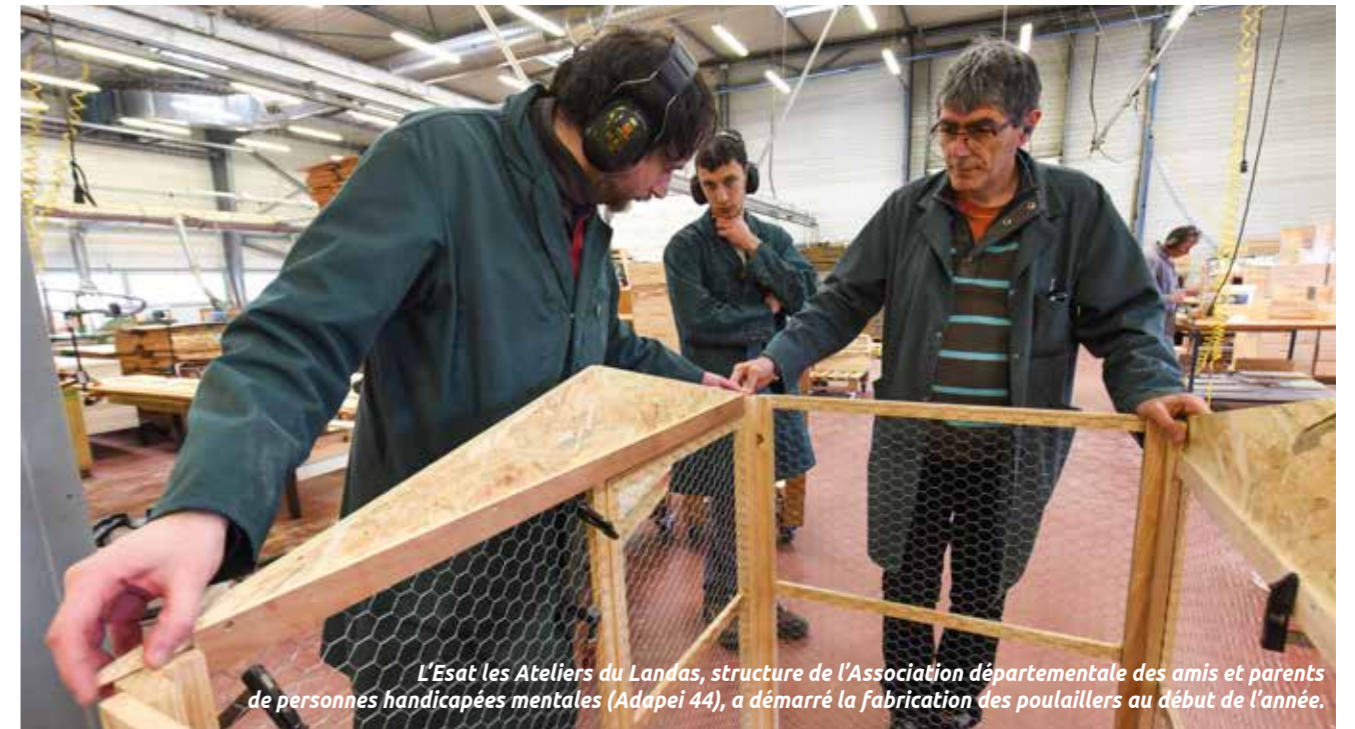
L'Esat les Ateliers du Landas, structure de l'Association départementale des amis et parents de personnes handicapées mentales (Adapei 44), a démarré la fabrication des poulaillers au début de l'année.

L'établissement et service d'aide par le travail (Esat) les Ateliers du Landas a fabriqué des poulaillers. Ceux-ci seront remis, avec deux poules, à 80 familles rezéennes, déjà sélectionnées.