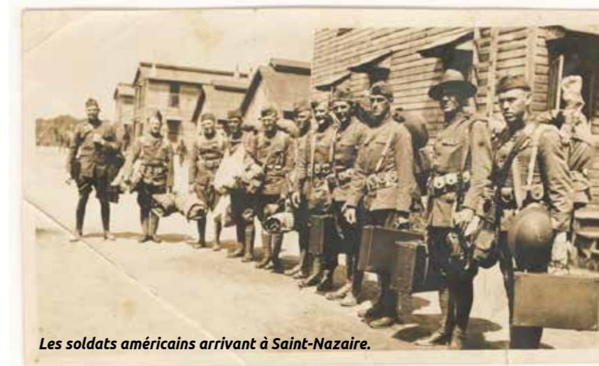
Les soldats américains arrivant à Saint-Nazaire.