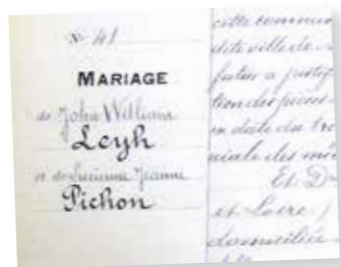
Quatre mariages franco-américains ont été célébrés à Rezé en 1919.

200 000 SOLDATS DANS L'ESTUAIRE La présence américaine bouleverse et modifie l'environnement de l'estuaire de la Loire : naissance de la