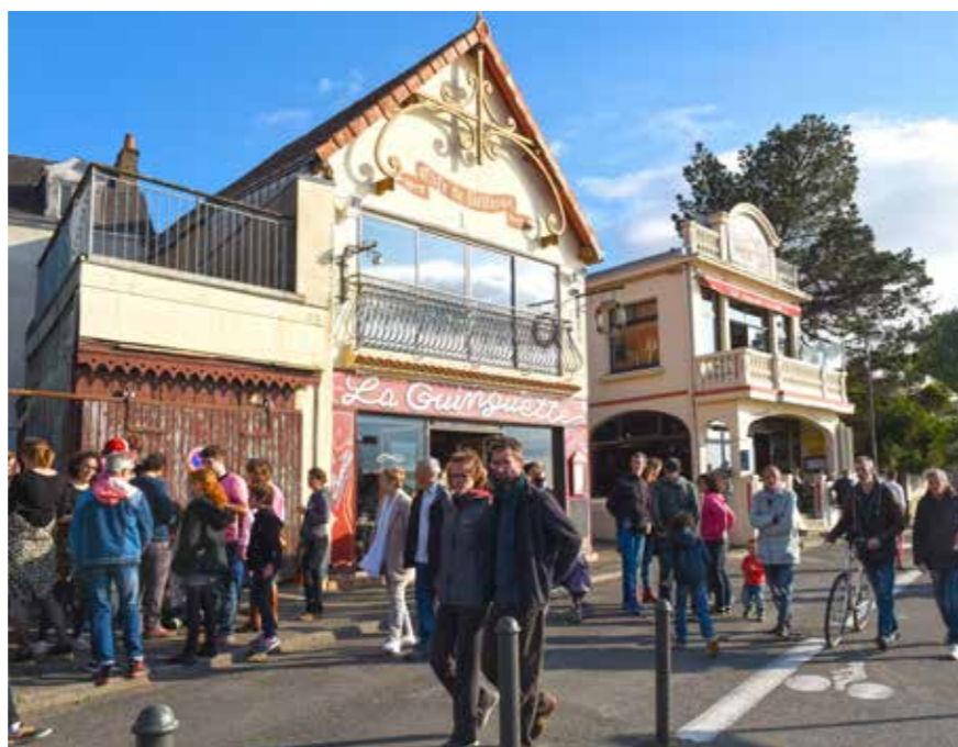
La ville présentée aux nouveaux Rezéens.