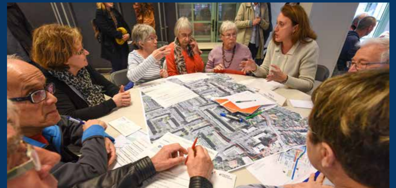
Les habitants, forces de proposition pour améliorer leur quartier.

le square Rigolo, installer des barbecues collectifs, aménager une coulée verte le long du tram, créer des parkings végétalisés, démolir certains bâtiments pour diversifier les types de logements... Toutes les idées des habitants sont étudiées par la Ville, la Métropole et les bailleurs.