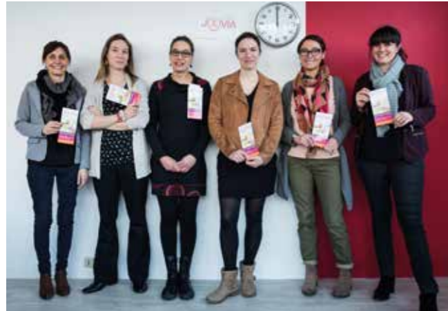
Joovia est une toute jeune entreprise bien connue des acteurs qui interviennent auprès du public âgé ou dépendant comme le Clïc (Centre local d'information et de coordination gérontologique).