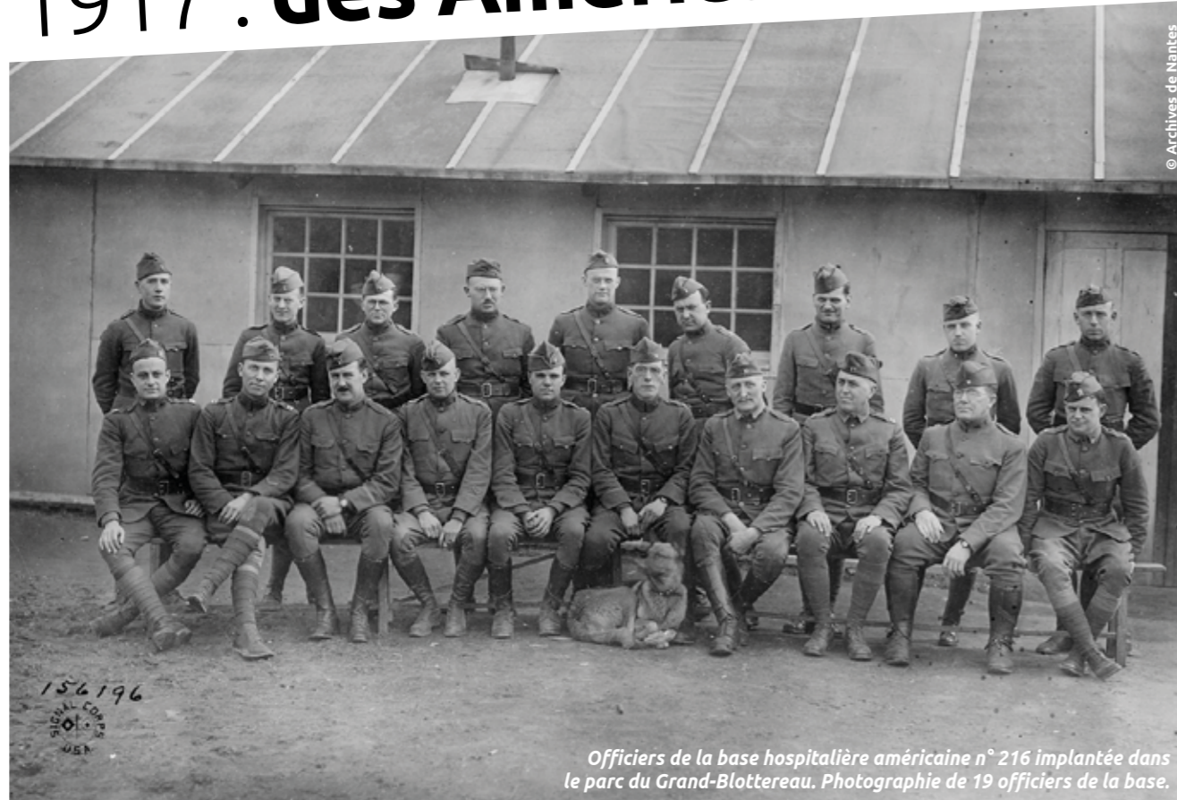
Officiers de la base hospitalière américaine n° 216 implantée dans le parc du Grand-Blottereau. Photographie de 19 officiers de la base.