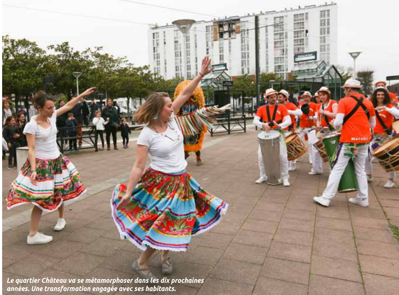
Le quartier Château va se métamorphoser dans les dix prochaines années. Une transformation engagée avec ses habitants.