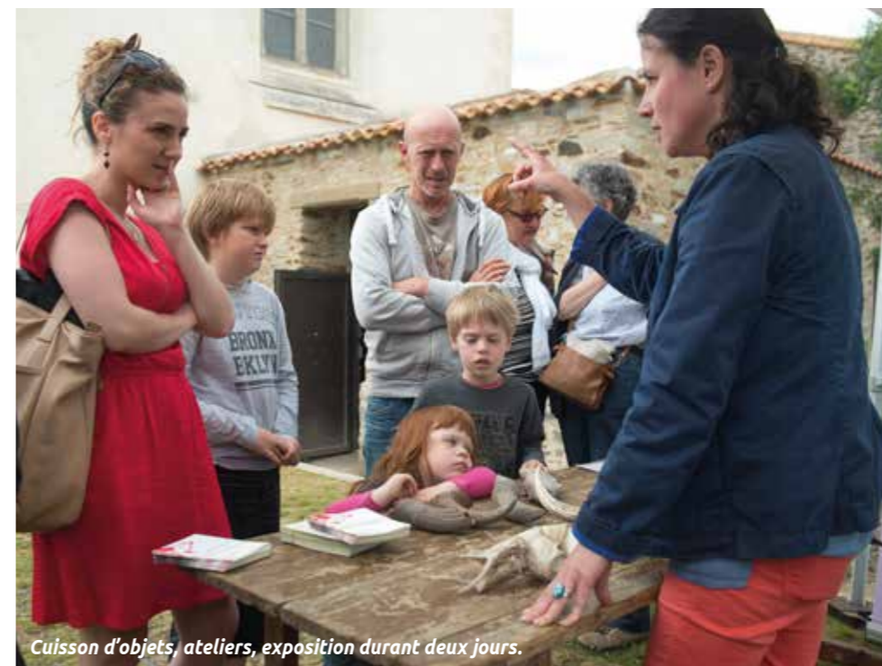
Cuisson d'objets, ateliers, exposition durant deux jours.

+ INFOS : 02 52 10 83 20 www.lechronographe.fr