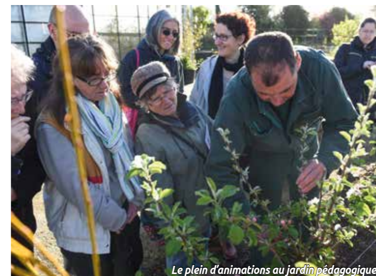
Le plein d'animations au jardin pédagogique.