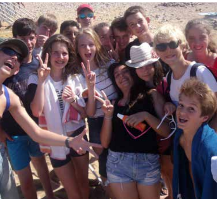
L'Arpej propose de nombreuses activités pour les jeunes.

+ INFOS : arpej-reze.asso.fr 02 51 83 79 20