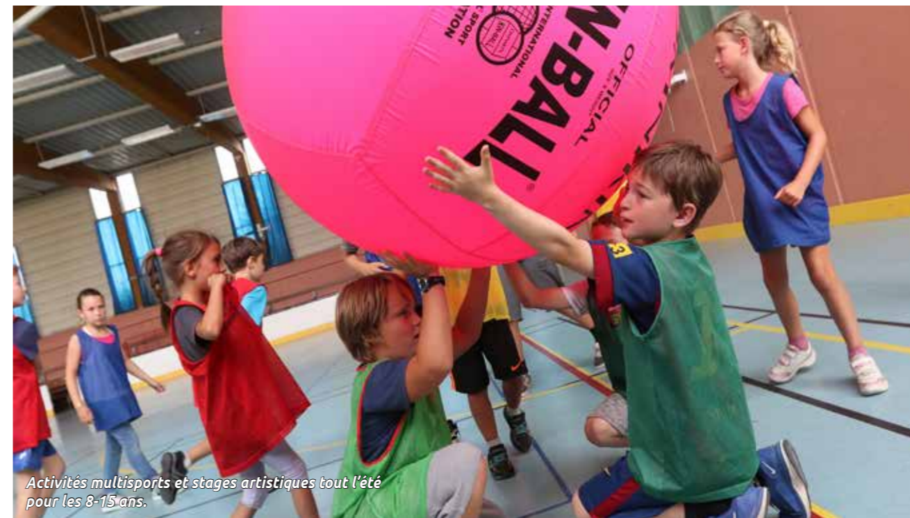
Activités multisports et stages artistiques tout l'été pour les 8-15 ans.