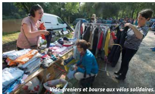
Vide-greniers et bourse aux vélos solidaires.

Flâner face à la Sèvre, écouter de la musique, se restaurer, faire des achats malins tout en soutenant des associations, le leitmotiv de Broc en Sèvre. À sa tête, trois associations de solidarité internationale : les Amis des enfants du monde (AEM), Juley, enfants du Ladakh (Inde) et Terre de vie. Elles travaillent main dans la main avec l'association de quartier Les D'illett'antes et le centre socioculturel (CSC) Jaunais-Blordière. « Ce vide-greniers d'un autre genre est un moment festif où l'on se retrouve avec plaisir, dans un cadre magnifique », apprécie le collectif associatif. La location des 120 emplacements (12€) et la restauration procureront aux associations des fonds pour financer des projets humanitaires. S'y ajouteront les 10% des ventes réalisées lors de la bourse aux vélos (dépôt samedi 10 juin) organisée par le CSC. De quoi joindre l'utile à l'agréable.