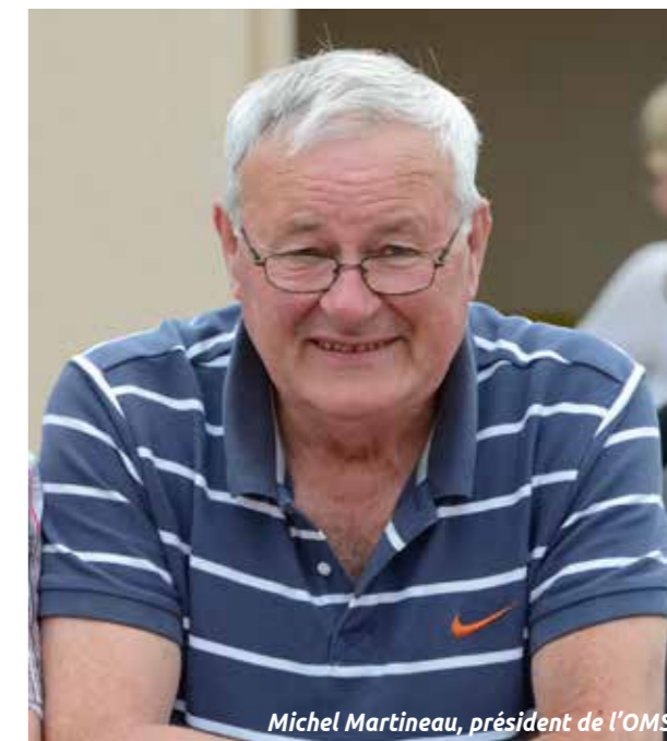
Michel Martineau, président de l'OMS.

« L'Office municipal des sports, créé à Rezé en 1970, est une structure de concertation et de soutien au service des associations sportives. Il est consulté pour toutes les nouvelles et futures structures sportives réalisées par la Ville ou réhabilitées (gymnases, piscine, terrains de foot, etc.) et est force de proposition auprès des services municipaux. De ce fait, l'OMS est en lien régulier avec les élus et plus particulièrement avec celui en charge des sports. Les relations entre la Ville et l'OMS ont fait l'objet d'une nouvelle convention, d'une durée de cinq ans, signée en mars dernier. L'OMS a également un rôle de soutien auprès des clubs : récompenses, prêts de matériel, aménagements divers. Son objectif est de promouvoir et de développer la pratique sportive sous toutes ses formes. Avec plus de 11 000 licenciés et 55 disciplines sportives différentes, il est plutôt bien loti. À nous d'œuvrer pour que tous ses pratiquants disposent des meilleures conditions pour exercer leur passion. »