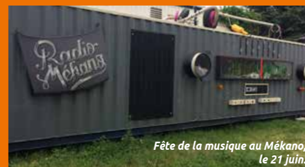
Fête de la musique au Mékano, le 21 juin.

Maison du développement durable Entrée libre