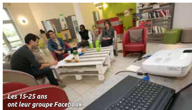
Les 15-25 ans ont leur groupe Facebook.