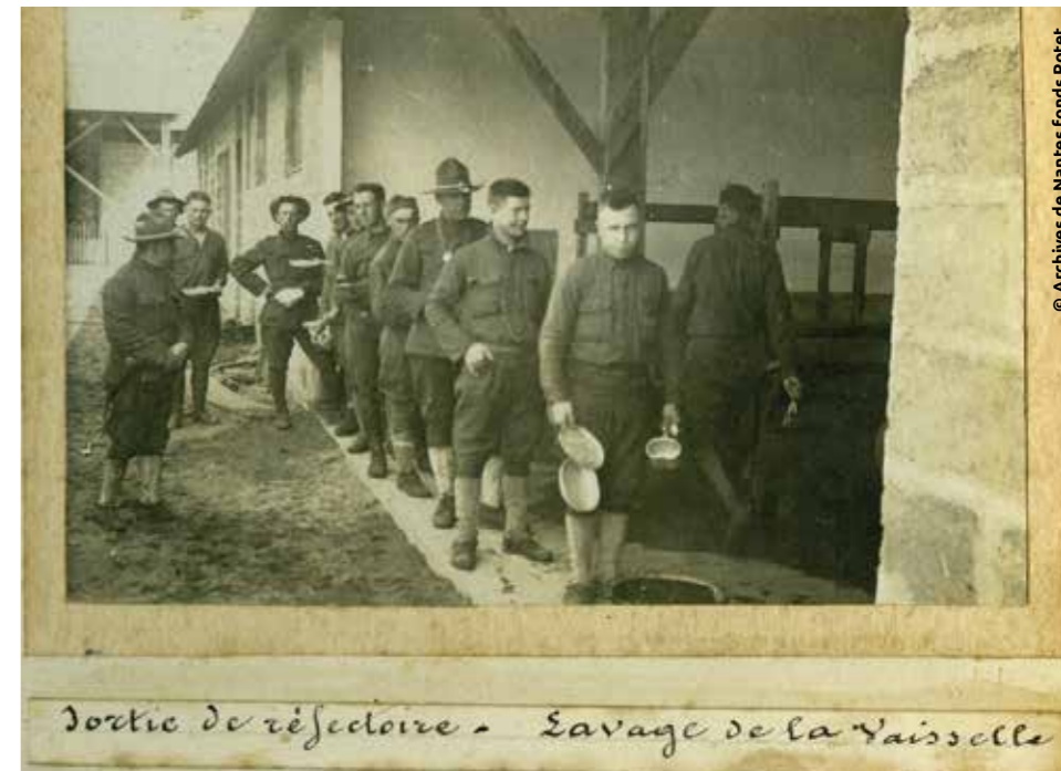
Sortie de réfectoire - Savage de la Vaisselle