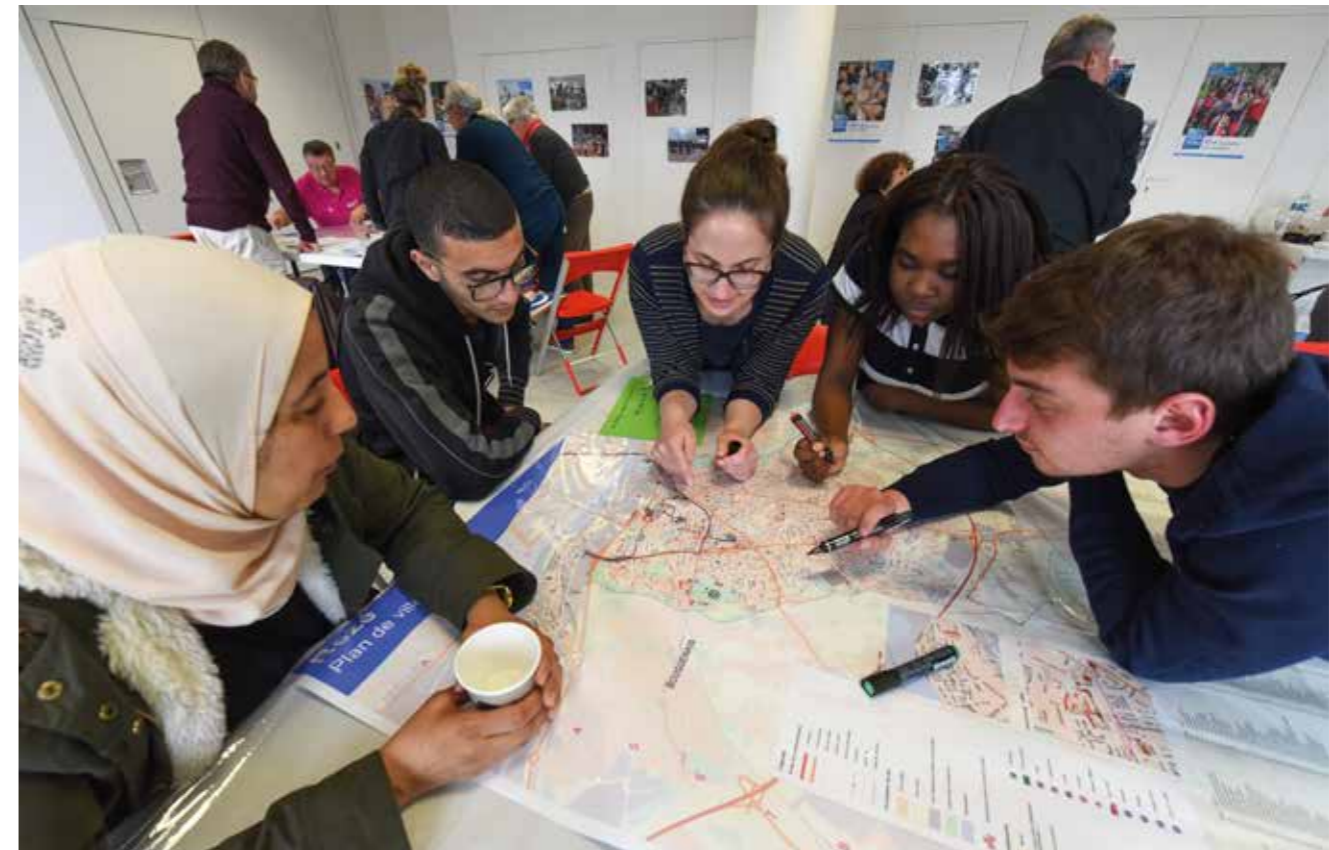
Une première rencontre avec des résidents étrangers a eu lieu au Château, en avril, dans le cadre du dialogue citoyen et de la lutte contre les discriminations.

Quelle place pour les résidents étrangers dans la ville ? Élus, animateurs socioculturels, bénévoles et résidents étrangers se sont retrouvés, mardi 4 avril, autour d'un atelier pour échanger sur la question.