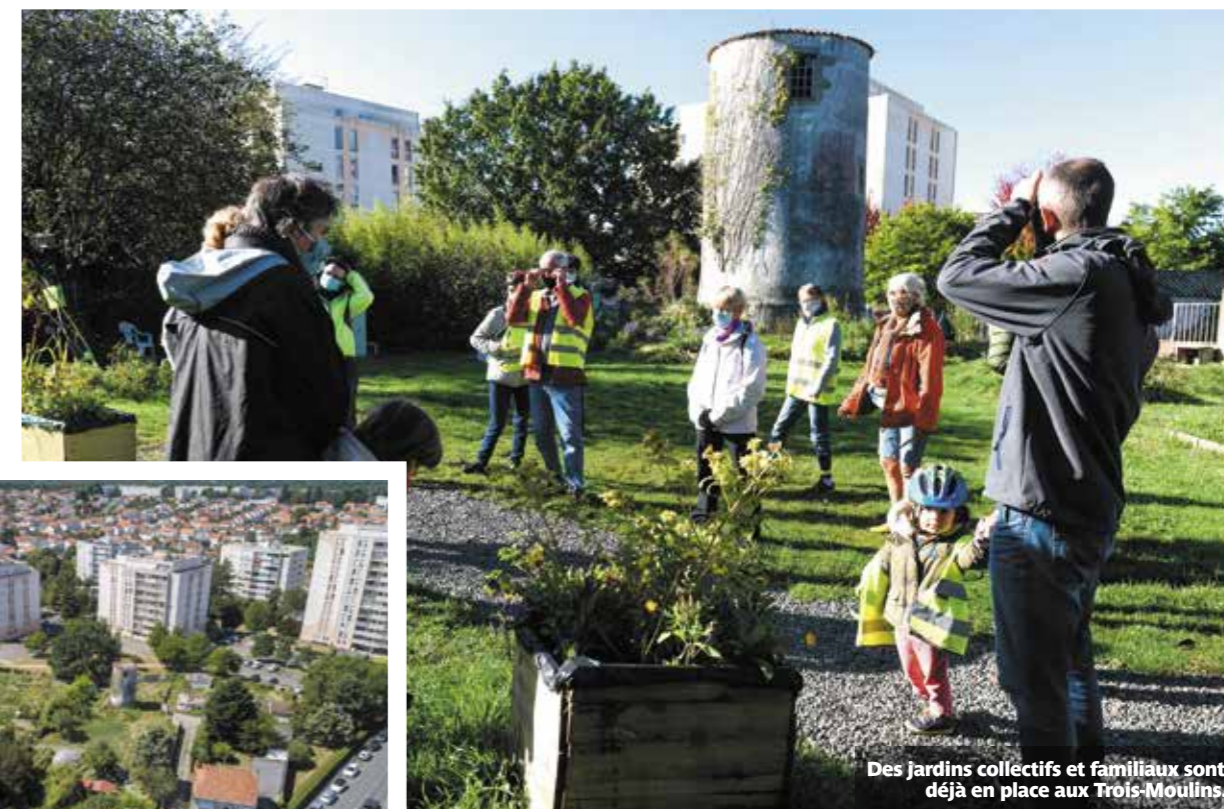
Des jardins collectifs et familiaux sont déjà en place aux Trois-Moulins.