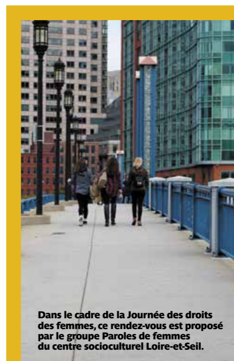
Dans le cadre de la Journée des droits des femmes, ce rendez-vous est proposé par le groupe Paroles de femmes du centre socioculturel Loire-et-Seil.