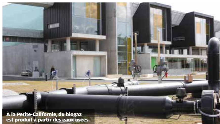
À la Petite-Californie, du biogaz est produit à partir des eaux usées.