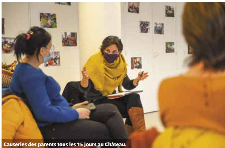
Causeries des parents tous les 15 jours au Chateau.

Tous les 15 jours, parents d'élèves de l'école Pauline-Roland, enseignants et une animatrice du centre socioculturel se retrouvent pour parler des sujets d'éducation, de la vie de l'école ou du quartier.