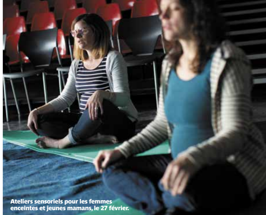
Ateliers sensoriels pour les femmes enceintes et jeunes mamans, le 27 février.