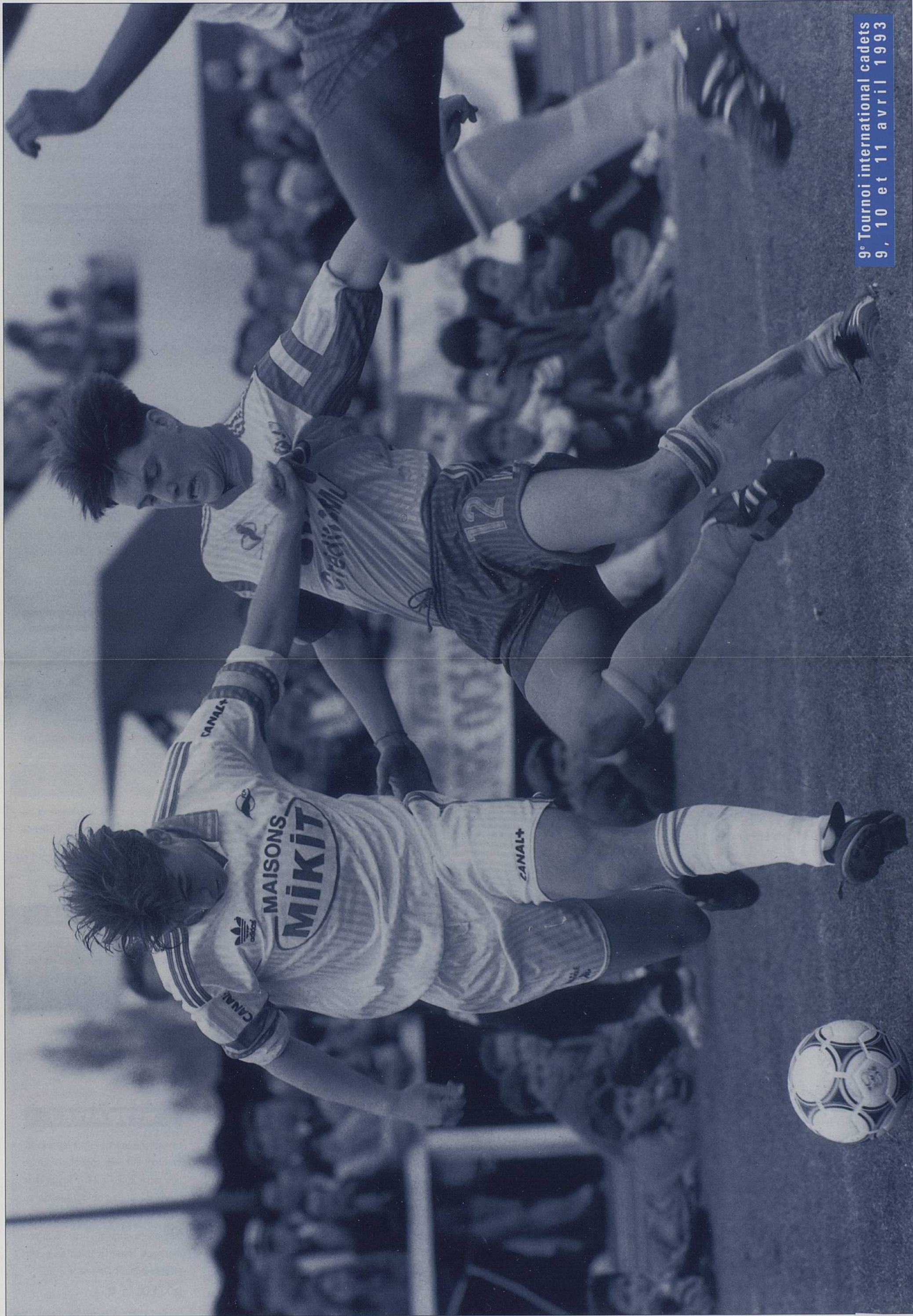
9 e Tournoi international cadets 9, 10 et 11 avril 1993