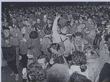
Course Rezé-Pornic (départ Trocardière) 1991

Départ à 0 h le dimanche 4 avril pour une marche nocturne de 58 km à partir de la Trocardière. ■