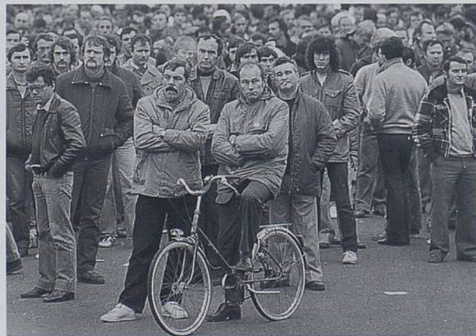
Expo sur le mouvement ouvrier à la Mairie

Connaissance du Monde présente "Il était une fois Les INDES", lundi 19 à 20 h, amphi du collège Saint-Paul, 20 rue Fontaine Launay. ■