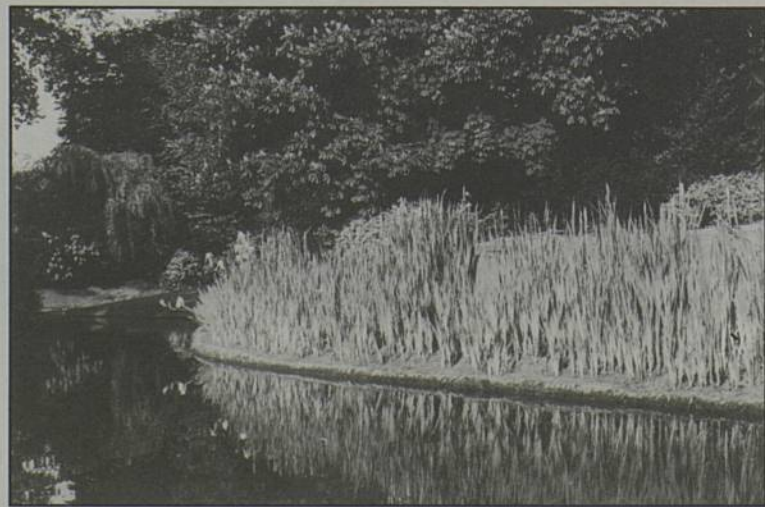
Paysage de bord de Sèvre au parc de la Morinière.

10 juin : Déchetterie et parc de la Morinière.