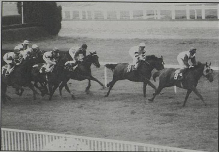
La vente des billets d'accès à l'hippodrome du Petit Port était intégralement reversée pour la lutte contre le cancer.

La semaine d'animation organisée conjointement avec la Ville de Rezé, la Ligue contre le Cancer, les entreprises et les commerçants ont permis de collecter, au soir du dimanche 20 mai, 130 000 F