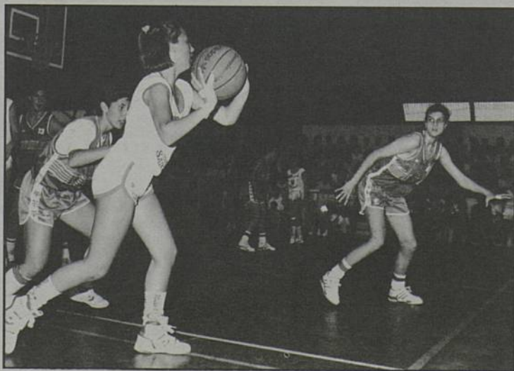
Une action de jeu lors du précédent tournoi.

Rezé Basket International a organisé les 2 et 3 juin son grand tournoi international. Le plateau des engagés résume à lui seul la qualité de cette manifestation : Arad, Sélection Catalane, Saint-Servais, Mirande, Tarbes, Guipavas, Rezé... A l'heure où nous mettons sous presse, nous ne connaissons qu'un vainqueur : le public, époustouffé du niveau technique des jeunes mais grandes cadettes.