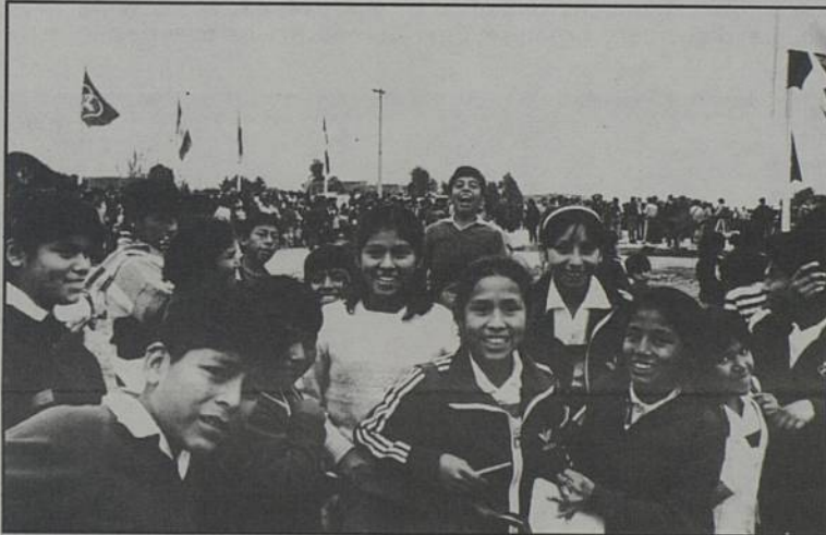
Portrait de groupe, jeunes de Villa El Salvador

Ces jeunes vous invitent à découvrir le Pérou, du 6 au 14 juin, à l'occasion d'une semaine d'animations dont les bénéficiaires serviront à financer leur voyage.