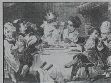
Gravure du XVIII ème .

• «La fête, témoin séculaire de nos fêtes» - du 13 au 31 janvier - Crédit Industriel de l'Ouest, pl. des Martyrs.