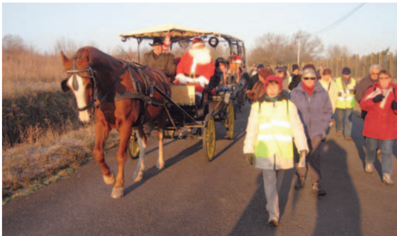
Les adhérents du CSC disent apprécier les activités impliquant différents micros quartiers comme la randonnée de Noël de l'an passé qui invitait habitants de l'Aufrère et du Genétais à marcher ensemble.