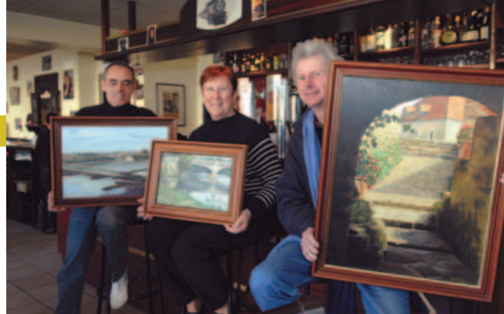
Vente d'œuvres au bénéfice d'une association burkinabé.