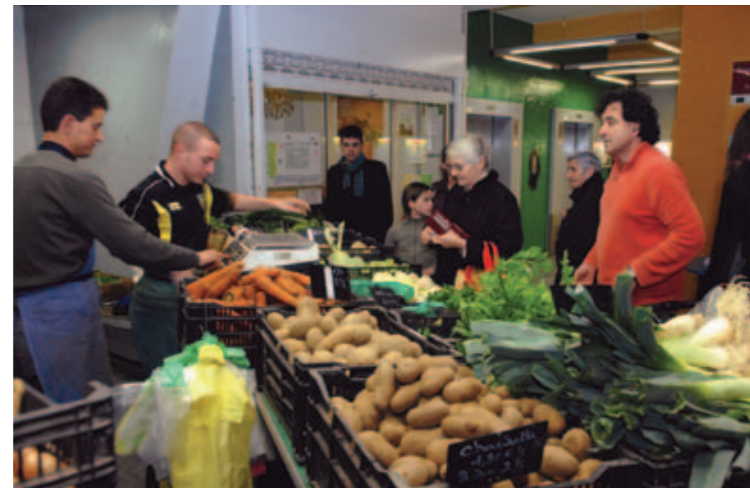
Chaque mercredi soir, un marché a lieu dans le hall de la Maison radieuse.