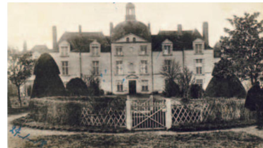
Le château de Monti. Ci-dessous, le fameux registre des aveux, rédigé au XVIII e siècle par le procureur fiscal des Monti.

Nul ne pouvait déroger à la règle. Pour n'avoir pas versé pendant cinq ans, la moitié de sa récolte de foin et la moitié de ses émondes (branches coupées), la veuve du sénéchal Huet, propriétaire de la maison des Marais (actuelle place des Roquios), a été condamnée à payer les arriérés et les frais du procès. Faute de pouvoir honorer sa dette, la veuve verra ses biens saisis et devra quitter sa maison.