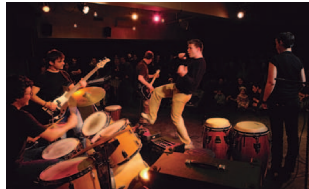
Carte blanche aux musiciens dans les quartiers.

Avis aux musiciens amateurs ! Une scène passera bientôt près de chez vous et vous y serez les bienvenus. Telle est l'invitation formulée par les trois structures de la coordination musiques actuelles de Rezé - école municipale de musique et de danse, la Barakason et l'association intercommunale Trempolino - à l'adresse de tous ceux qui désirent partager leur plaisir de jouer.