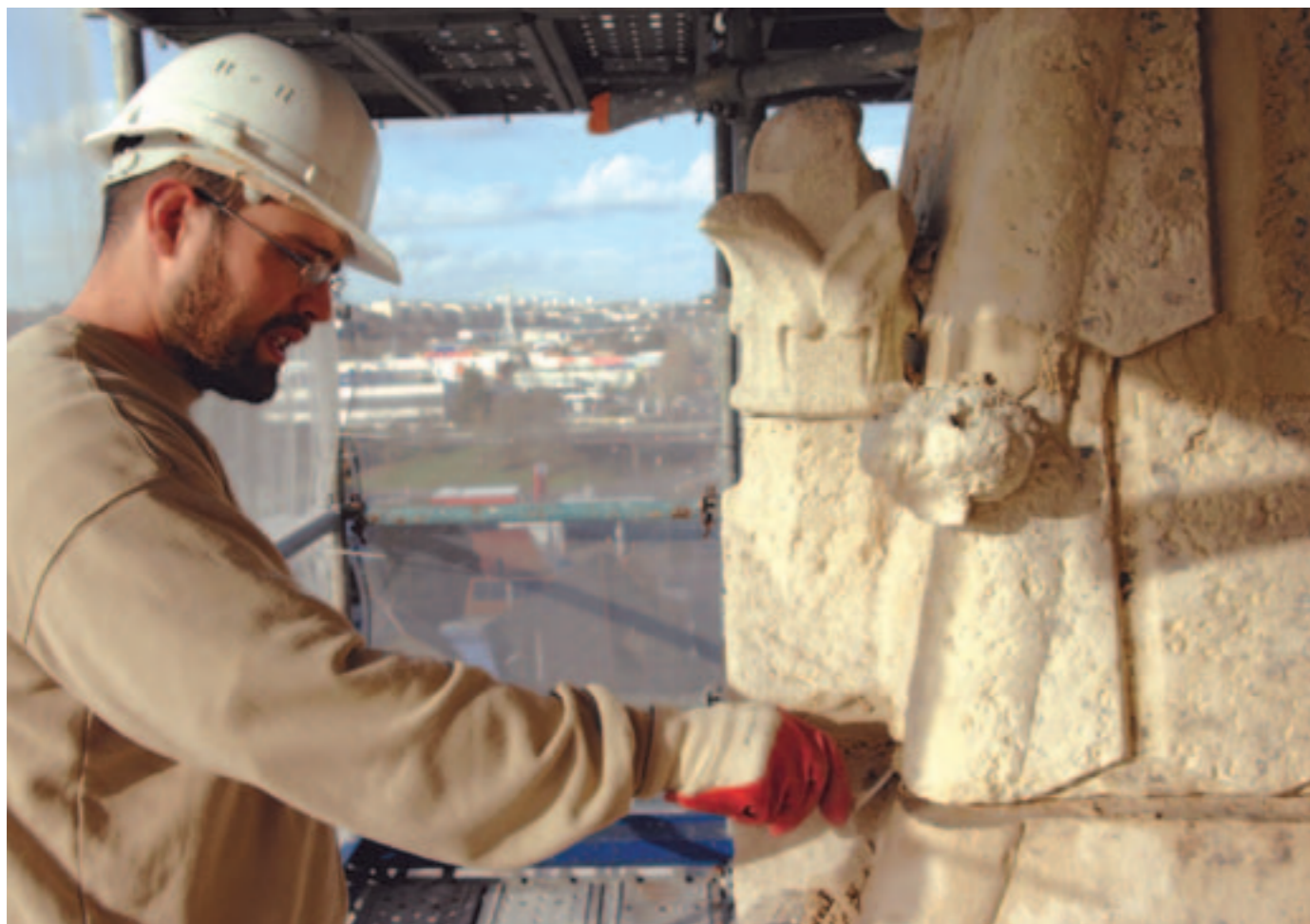
Entre ciel et terre, réfection du clocher de Saint-Pierre.