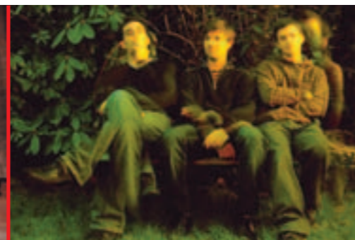
Musiques émergentes, Altaï

Visite du site Saint-Lupien, sur réservation. Les 2, 16 et 30 avril, 15h et le 5, 10h. Tarifs : 3 €, famille 6 €. Réserv. 02 40 84 43 96.