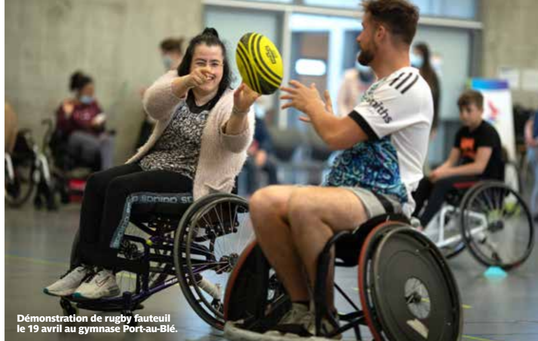
Démonstration de rugby fauteuil le 19 avril au gymnase Port-au-Blé.