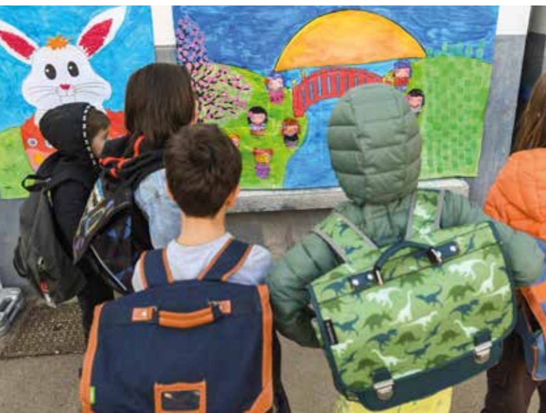
Les enfants sont associés à cette concertation.

INFOS – 02 40 84 42 44, dialoguecitoyen@mairie-reze.fr , jeparticipe.reze.fr