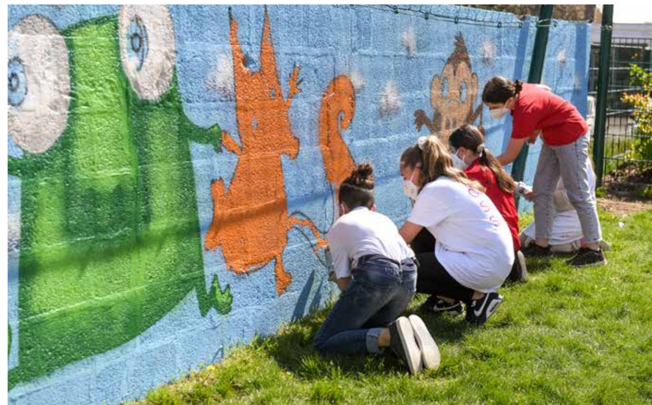
Accompagnés par l'artiste rezéen Ador, les écoliers de Ouche-Dinier ont animé les murs de l'établissement.

Les élèves de l'élémentaire ont dessiné sur plusieurs murs de l'établissement avec le concours de l'artiste Ador et de son imaginaire décalé.