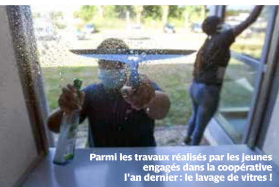
Parmi les travaux réalisés par les jeunes engagés dans la coopérative l'an dernier : le lavage de vitres !

INFOS – Service jeunesse et citoyenneté : 02 40 13 44 25. La Coopérative jeunesse de services sera installée au centre socioculturel Château du 4 au 29 juillet.