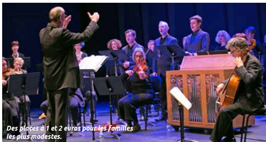
Des places à 1 et 2 euros pour les familles les plus modestes.

+ INFOS : 02 51 70 78 00, lasoufflerie.org