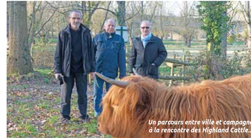
Un parcours entre ville et campagne à la rencontre des Highland Cattle...

Des kilomètres de sentiers à parcourir et à baliser. Le Tour de Rezé, ils ne font pas qu'y participer, ils le conçoivent.