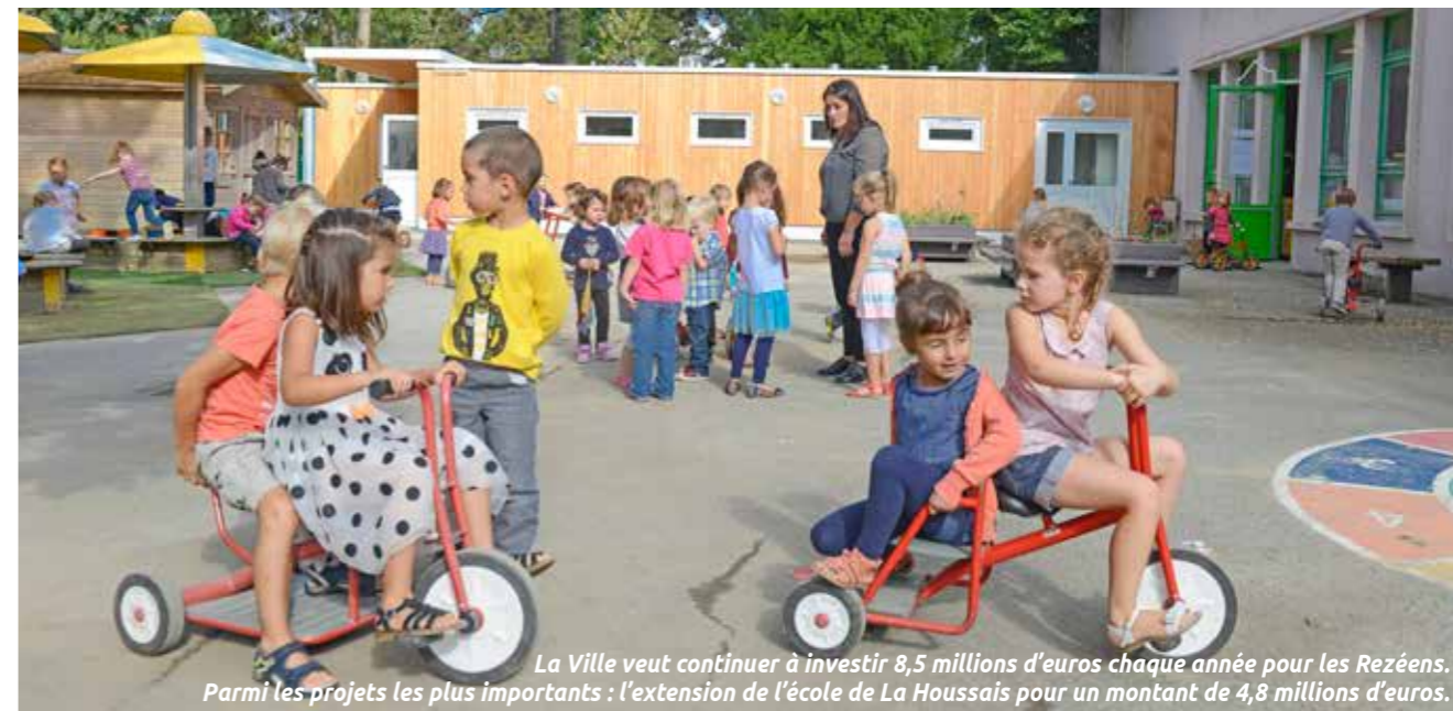
La Ville veut continuer à investir 8,5 millions d'euros chaque année pour les Rezéens. Parmi les projets les plus importants : l'extension de l'école de La Houssais pour un montant de 4,8 millions d'euros.

Comment répondre aux besoins des habitants avec des rentrées d'argent en baisse ? Cette question était au cœur des débats au conseil municipal de février.