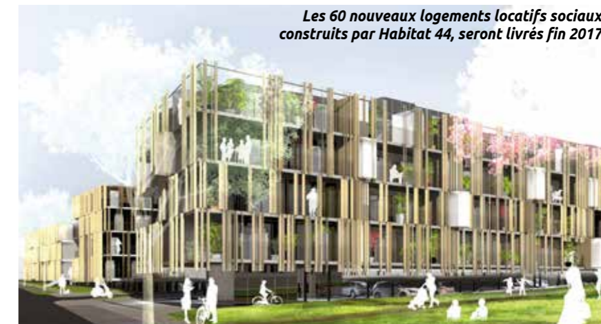
Les 60 nouveaux logements locatifs sociaux, construits par Habitat 44, seront livrés fin 2017.

de terre. 30% d'entre eux seront en location sociale, 25% en accession abordable et 45% en accession libre. « Nous avons voulu de la mixité et des aménagements durables dans ce nouveau quartier. Une initiative qualifiée d'exemplaire par l'État », conclut le maire.