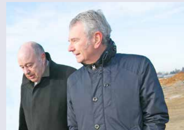
Le maire aux côtés de Jean-Michel Baylet, ministre de l'Aménagement du territoire, de la Ruralité et des Collectivités territoriales, en visite sur le chantier du MIN.