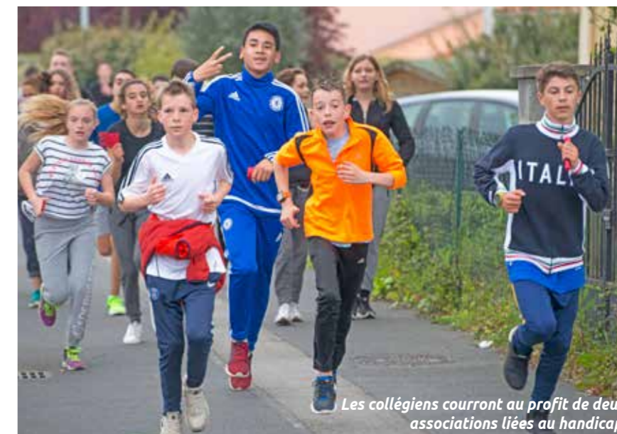
Les collégiens courent au profit de deux associations liées au handicap.

Course solidaire, samedi 25 mars de 8h30 à 12h au collège Petite-Lande, rue Georges-Berthomé.