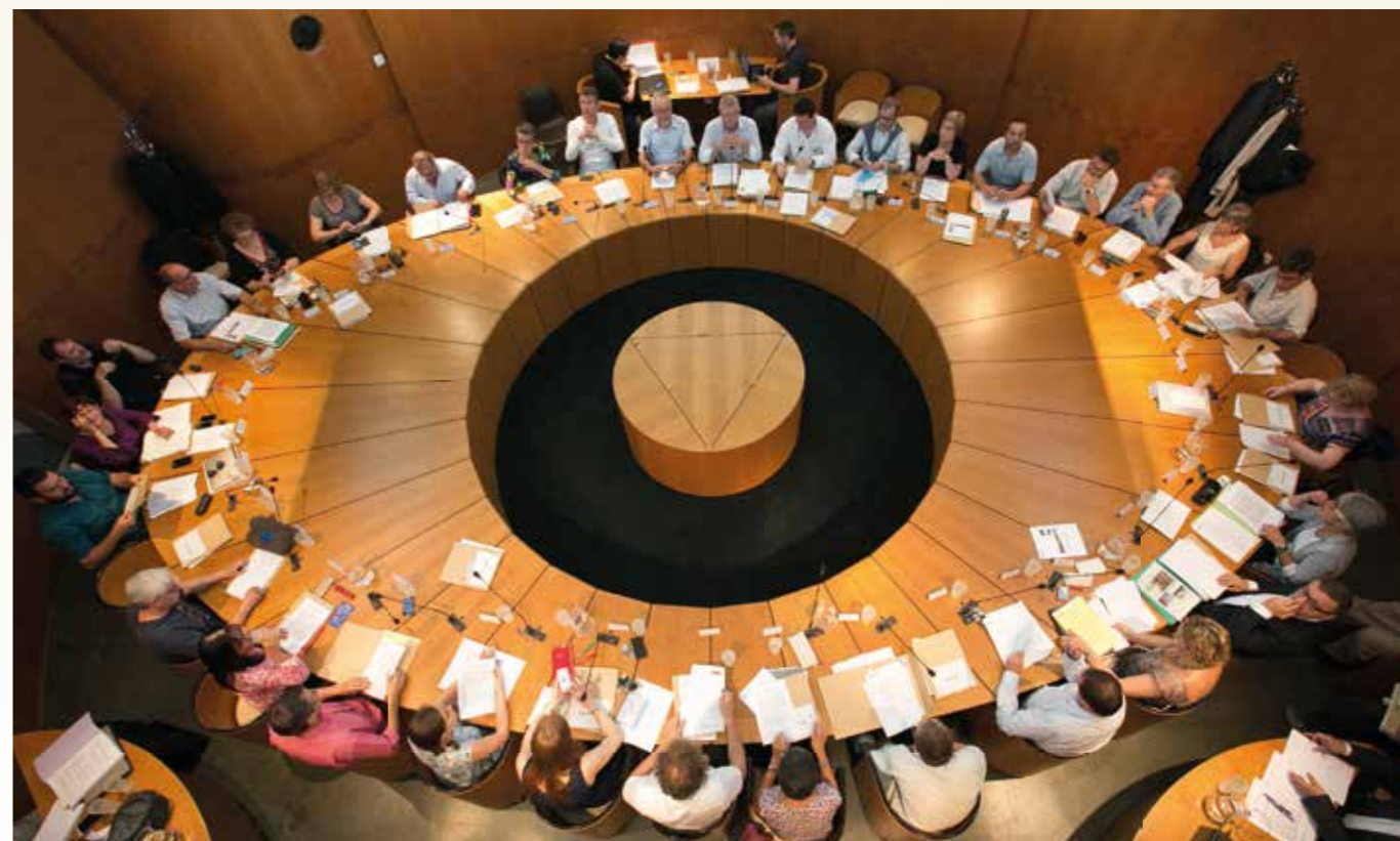
Groupe de la minorité

Notre actualité : http://www.blog.elusvertsdereze.org , sur Facebook et Twitter @elusecolos_reze Contact : elus.ecologistes@mairie-reze.fr