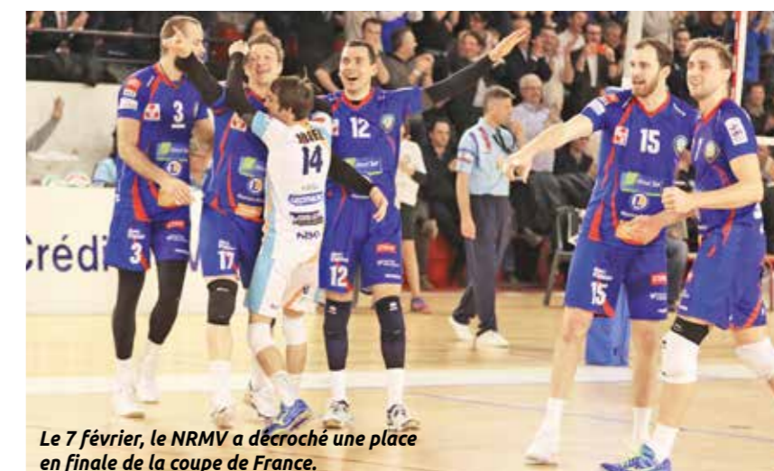
Le 7 février, le NRMV a décroché une place en finale de la coupe de France.

Le Nantes Rezé Métropole Volley (NRMV) a écrit l'histoire, mardi 7 février au gymnase Arthur-Dugast. Sur un score de trois sets à un face au Montpellier Volley Université Club (MVUC) et devant un public chauffé à blanc, le club s'est qualifié en finale de la coupe de France de volley-ball. C'est une première depuis la création de l'équipe, il y a dix ans. Le 11 mars, Nantes Rezé affrontera le Gazélec Football Club Ajaccio Volley (GFCA) à Clermont-Ferrand.