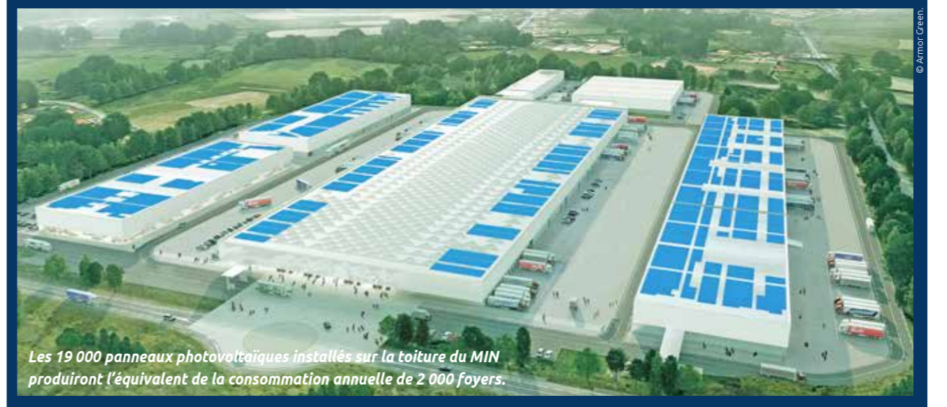
Les 19 000 panneaux photovoltaïques installés sur la toiture du MIN produiront l'équivalent de la consommation annuelle de 2 000 foyers.