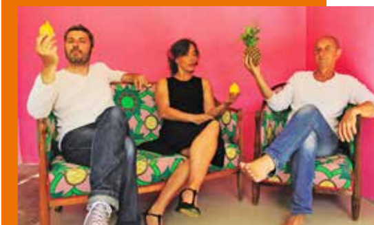
Brasil Nativo, le 17 mars.

Du 16 au 18 mars, La Soufflerie vous invite à explorer la culture foisonnante et créative de São Paulo, au Brésil, dans le cadre de la 2 e édition du Focus Metropolis (lire p.5).