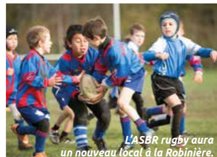
L'ASBR rugby aura un nouveau local à la Robinière.

Une démarche innovante dans sa réalisation et originale dans sa finalité. En septembre 2017, l'ASBR rugby pourra disposer d'un nouveau local, au sein du stade de la Robinière. Un bâtiment modulaire de 100 m 2 habillé d'un bardage de bois financé