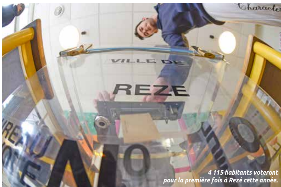
4 115 habitants voteront pour la première fois à Rezé cette année.

Plus de 30 000 Rezéens seront appelés aux urnes les 23 avril et 7 mai pour l'élection présidentielle. 4 115 d'entre eux voteront à Rezé pour la première fois. La répartition des électeurs dans les bureaux de vote change. De nouvelles cartes seront adressées courant mars à tous les habitants inscrits sur les listes électorales.