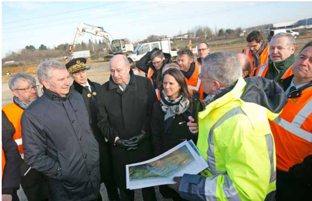
Le MIN : un projet hors normes à 148 millions d'euros. En visite sur le chantier, Jean-Michel Baylet, ministre de l'Aménagement du territoire, a annoncé le soutien de l'État à hauteur de 9,5 millions d'euros.