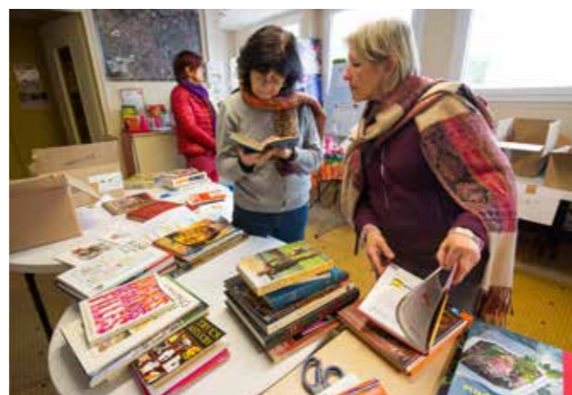
Avis aux mordus de lecture : 12 à 15 tonnes de livres seront en vente.

BaraKàLivres, samedi 18 mars de 15h à 19h et dimanche 19 mars de 10h à 18h, gymnase Château-Nord (18, allée de Provence). Entrée libre, sans obligation d'achat.