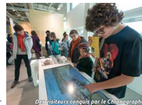
Des visiteurs conquis par le Chronographe.

+ INFOS : 02 52 10 83 20, lechronographe.fr