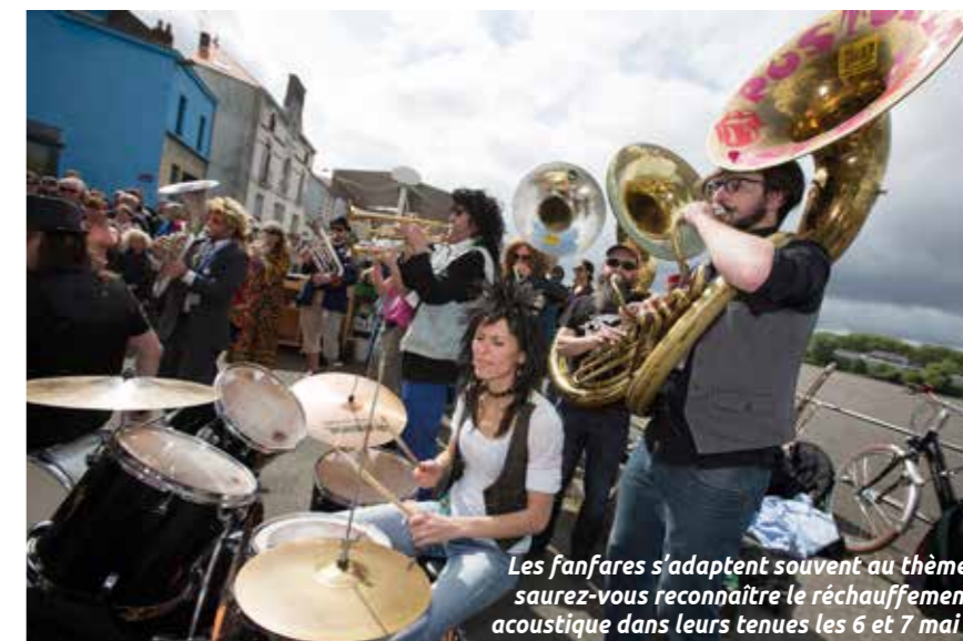
Les fanfares s'adaptent souvent au thème, saurez-vous reconnaître le réchauffement acoustique dans leurs tenues les 6 et 7 mai ?

24 fanfares, 350 musiciens et 12 000 personnes attendues. Attention à la surchauffe les 6 et 7 mai à Trentemoult ! Les Fanfaronnades reviennent pour réchauffer rues et places de sons éclectiques, entre groove, funk, rock, musiques des Balkans et de La Nouvelle-Orléans. Et ce, avec quelques nouveautés dans les étuis : une troisième scène, au pied du Pendule, dédiée aux fanfares de la région et deux soirées, au lieu d'une, avec l'ensemble des fanfares invitées. Il y aura les habitués, la Fanfare du coin ou les Carreleurs américains, et des petits nouveaux comme les Fire Lips ou la Very Bad Fanfare. Le lancement des festivités acoustiques se fera le 6 mai à 15h pour se terminer tard dans la nuit. Entre-temps, Trentemoult vivra au rythme des lâchers de fanfares, des ateliers pour les enfants, des battles... Un rendez-vous convivial savamment orchestré par le Grand Machin Chose et sa centaine de bénévoles survoltés.