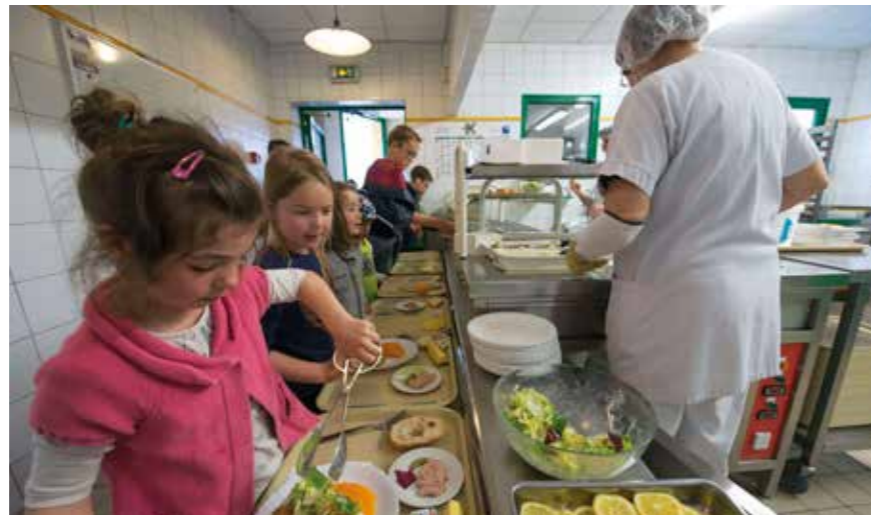
Parmi les principaux investissements : la construction d'un nouveau restaurant scolaire à l'école Salengro.

Côté investissements, l'accent est mis sur les plus jeunes avec plusieurs projets majeurs : la création d'un multi-accueil au Chêne-Gala, l'extension de l'école de La Houssais, ou encore la construction d'un nouveau restaurant scolaire à l'école Salengro. Autres grandes priorités en 2017 : l'accompagnement à la vie culturelle, sportive et associative, la solidarité avec une attention particulière pour les seniors, les habitants du Château et les migrants. « En outre, des actions se poursuivront en faveur de la transition écologique et la tranquillité publique pour offrir aux Rezéens une ville apaisée, intégrée dans la dynamique métropolitaine, souligne le maire.