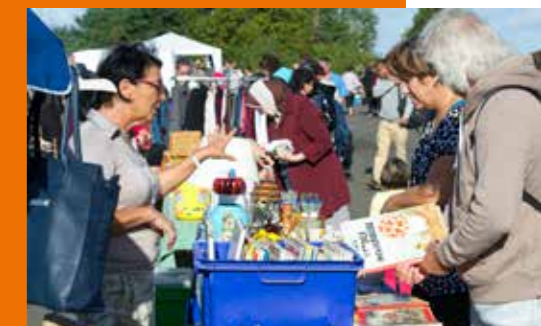
Vide-greniers les 20, 21 et 28 mai.

En mai, allez faire un tour dans l'un des vide-greniers organisés à Rezé. Qui sait, vous dénicheriez peut-être la perle rare ! - Samedi 20 mai de 9h à 17h30. Cour de l'école élémentaire Roger-Salengro. Organisé par l'école Roger-Salengro. - Dimanche 21 mai de 8h à 18h. Parking E.-Leclerc Atout-Sud. Organisé par Rezé Basket 44. - Dimanche 28 mai de 8h à 18h. Parking E.-Leclerc Océane. Organisé par l'ASBR Handball. Espace repas et animations.