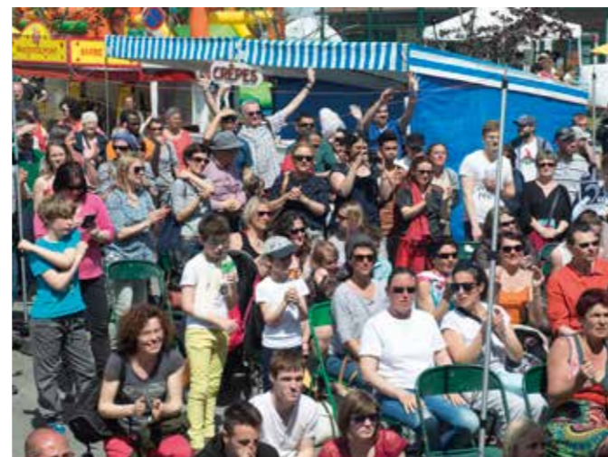
Chaque année, le même succès pour la fête des Caillebottes.

Fête des Caillebottes, jeudi 25 mai, de 11h à 21h30, rue Vivier.