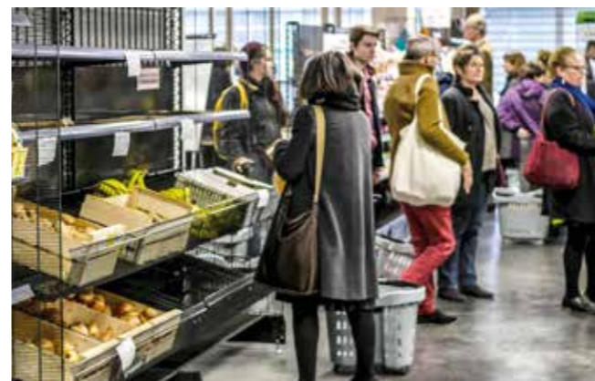
Scopéli devrait ouvrir fin 2017 dans la zone commerciale d'Atout Sud.

Être copropriétaire d'un supermarché et y consacrer trois heures par mois pour faire ses courses bio et locales, tel est le pari de Scopéli, le projet de supermarché coopératif et participatif qui devrait ouvrir fin 2017 à Rezé.