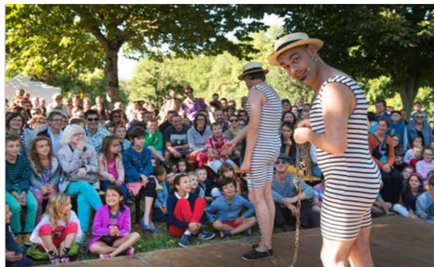
La Fête du quai Léon-Sécher : le grand rendez-vous populaire organisé chaque année par le CSC Jaunais-Blordière avec le concours des habitants.