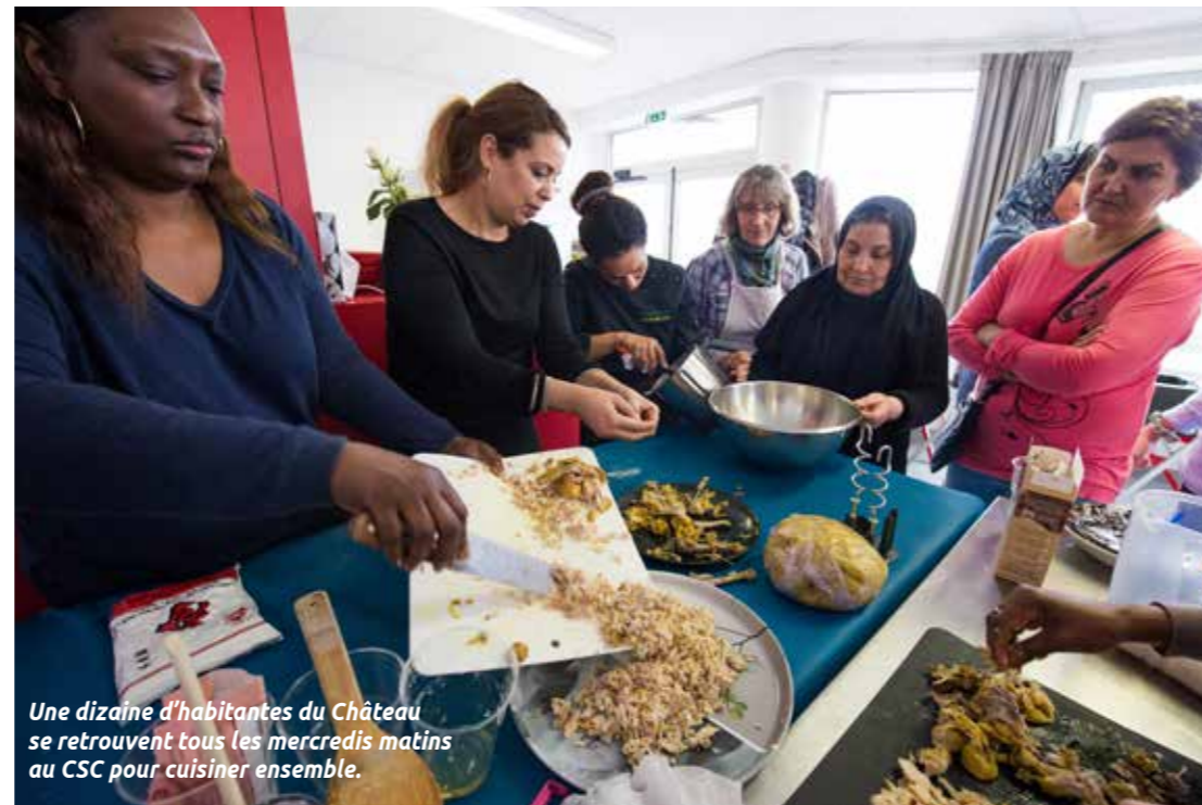
Une dizaine d'habitantes du Château se retrouvent tous les mercredis matins au CSC pour cuisiner ensemble.

À chaque CSC, son projet social. Conçu à partir d'un diagnostic du