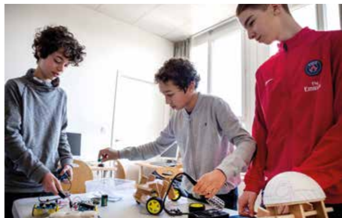
Air2 propose aussi des stages durant les vacances scolaires.