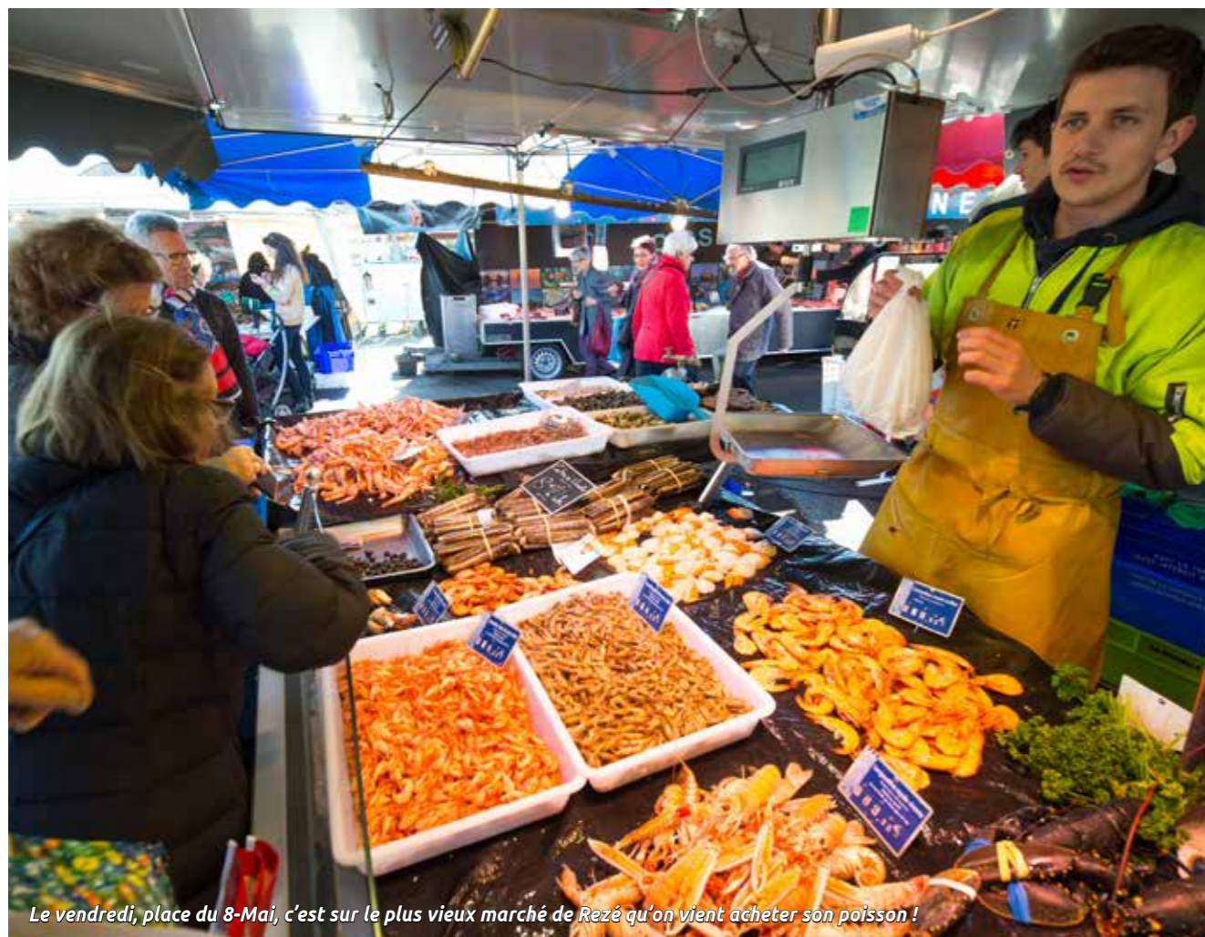
Le vendredi, place du 8-Mai, c'est sur le plus vieux marché de Rezé qu'on vient acheter son poisson !