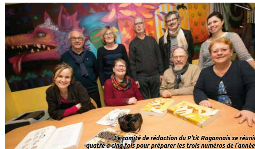
Le comité de rédaction du P'tit Ragonnais se réunit quatre à cinq fois pour préparer les trois numéros de l'année.