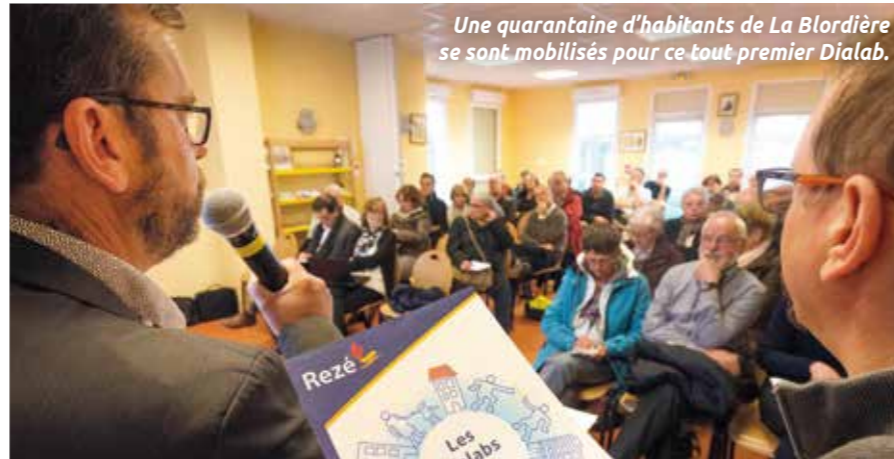
Une quarantaine d'habitants de La Blordière se sont mobilisés pour ce tout premier Dialab.