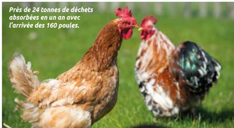
Près de 24 tonnes de déchets absorbées en un an avec l'arrivée des 160 poules.

Distribuer 160 poules pour réduire les déchets des foyers, c'est ce que propose la Ville avec son opération « Poules en ville ». Une grande première dans l'agglomération.