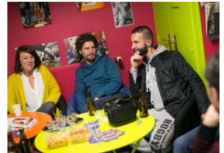
Un samedi par mois, le CSC Loire-et-Seil propose aux papas d'échanger entre eux à la Maison du Port-au-Blé.