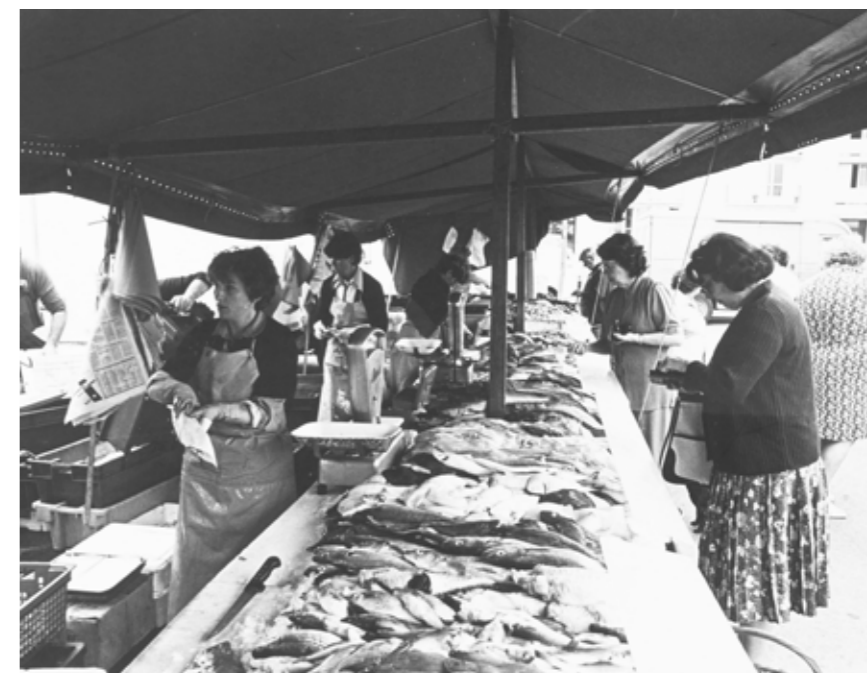
Marché de la place du Pays-de-Retz, dans les années 1950-1960.

étals et les clients l'hiver, la poussière l'été. De 1922 à 1930, un transfert est donc envisagé sur le terrain de la Fraisinière. Mais les marchands forains, opposés à ce déménagement, parviennent à maintenir le statu quo . Jusqu'en 1951, date à laquelle la municipalité impose le transfert. Le marché de Pont-Rousseau rejoint le 8 septembre 1951 son emplacement actuel, sur l'ancien