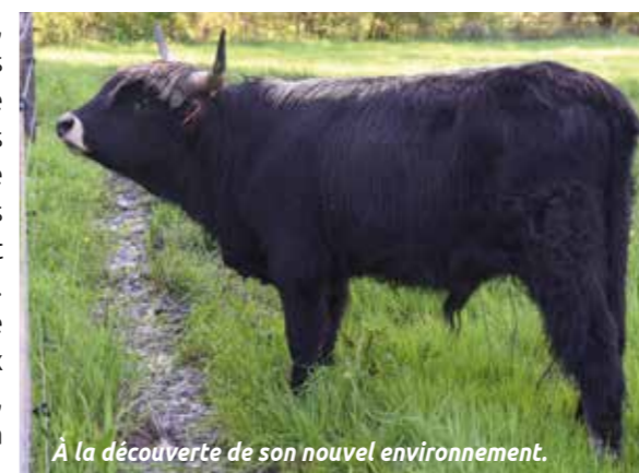
À la découverte de son nouvel environnement.

Depuis début avril, quatre aurochs (ancêtres des races actuelles de bovins) foulent le sol des prairies de Sèvre. Sur ce lieu humide, pas moins de cinq hectares sont consacrés au pâturage. Les trois highland cattle et leurs nouveaux camarades, Knaitia, Knaiti, Kicksia et Hera labourent le terrain, permettant ainsi un meilleur développement de la faune et de la flore typiques de cet espace naturel. Les promeneurs pourront observer de loin ces animaux rares et imposants.