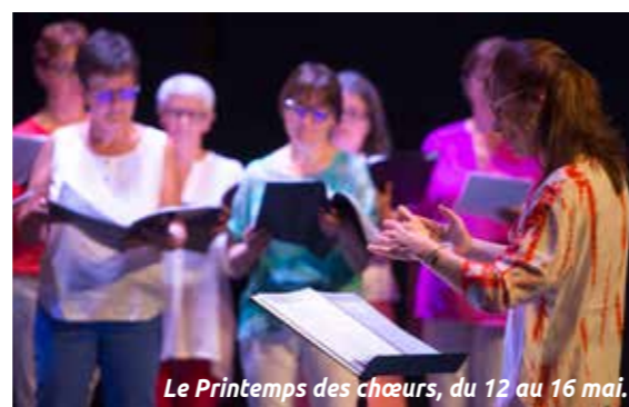
Le Printemps des chœurs, du 12 au 16 mai.