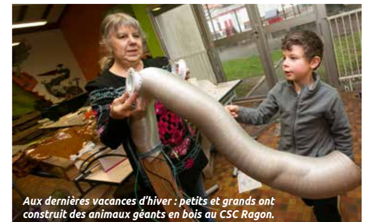
Aux dernières vacances d'hiver : petits et grands ont construit des animaux géants en bois au CSC Ragon.