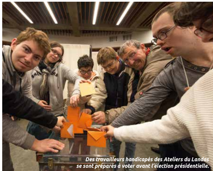
Des travailleurs handicapés des Ateliers du Landas se sont préparés à voter avant l'élection présidentielle.