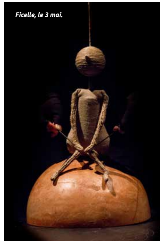
Ficelle, le 3 mai.

Un joli cache-cache poétique orchestré par une marionnettiste et un musicien avec un enjeu : la découverte. Un spectacle de la compagnie Le Mouton carré. Proposé par La Soufflerie. Dès 3 ans. Atelier