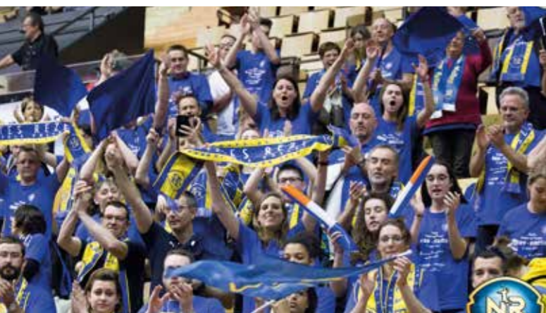
Bien « NRV », ils étaient une cinquantaine de supporters rézéens à s'être déplacés à Clermont-Ferrand.

Félicitations aux joueurs du Nantes Rezé Métropole Volley pour leur magnifique parcours en Coupe de France. Pour la première fois dans l'histoire du jeune club, créé il y a dix ans, l'équipe coachée par Martin Demar a atteint la finale de cette compétition. Mais, face au club d'Ajaccio, tenant du titre, les Nanto-Rezéens ont cédé en trois sets. Bravo aux joueurs et à leurs supporters, venus en nombre à Clermont-Ferrand, samedi 11 mars, les soutenir.