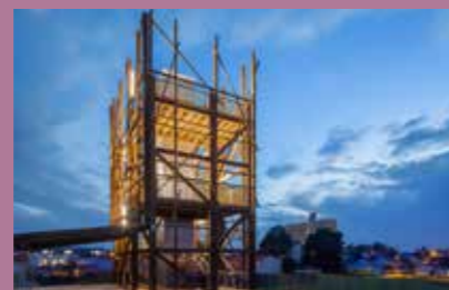
Nuit des musées au Chronographe, le 20 mai.

Visiter le Chronographe à la nuit tombée, ce n'est possible qu'une fois dans l'année ! Profitez de la Nuit européenne des musées pour découvrir le centre d'interprétation archéologique et le site de Saint-Lupien sous un autre angle. Le spectacle sera assuré par Jack in My Head, avec son Phonorama subjectif consacré au Chronographe. Sur scène : des vidéos, des captations sonores et un violoncelle. Samedi 20 mai de 20h à 23h. Concert à 21h30. Le Chronographe, 21, rue Saint-Lupien. Entrée libre. Rens. 02 52 10 83 20.