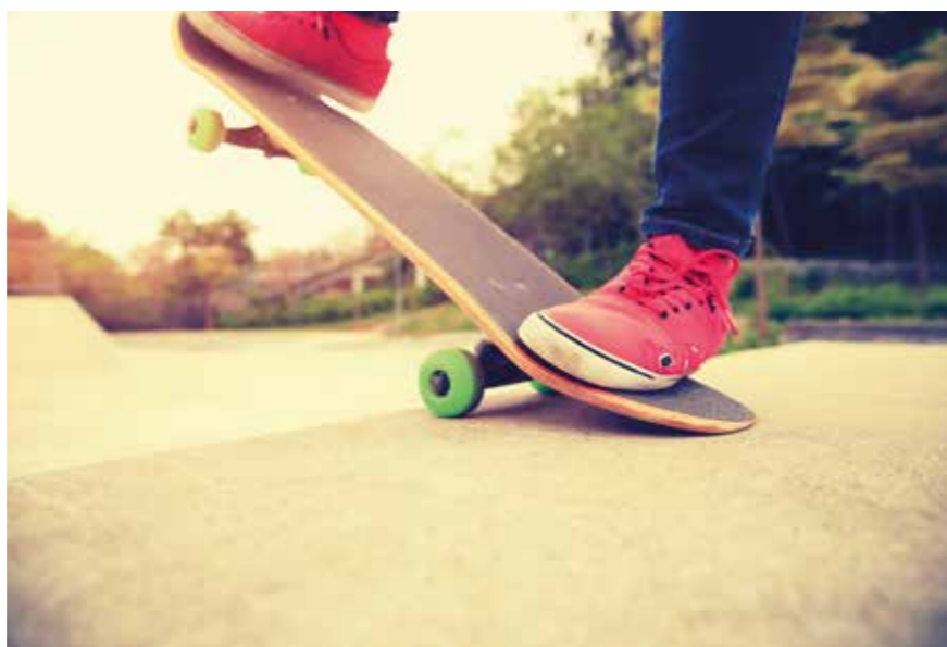
Compétition, démonstration et initiation au programme d'Urbatium Contest.

Amateurs et professionnels réaliseront ainsi, devant le public, des figures techniques et acrobatiques de haut vol ! Pour se remettre de ses émotions, un bar sans alcool sera tenu par l'association Amitié jeunes Rezé-Ronkh (AAJRR). Cette journée sera aussi l'occasion de découvrir les propositions d'un groupe de travail qui planche sur la création d'un skatepark à Rezé.