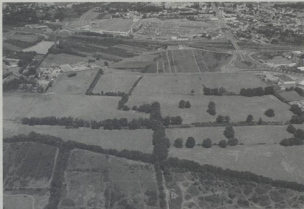
Une partie du site de la Brosse, au sud du périphérique, englobe des parcelles situées sur Rezé et Les Sorinières.

En décembre 2002, le conseil communautaire de Nantes Métropole arrête un périmètre d'étude de 240 hectares sur le site de La Brosse. D'ores et déjà, la vocation économique du site est confirmée - confortation d'un pôle auto-moto - mais des activités sportives et ludiques pourraient aussi y prendre place. En complément, des espaces seront réservés à l'implantation de bureaux et d'entreprises artisanales et industrielles. Au cœur de ce secteur, une « coulée verte » permettra de fédérer les éléments du programme et d'accueillir quelques constructions participant à l'animation du site (restaurants...). Quant à l'ancienne décharge Grandjouan-Onyx, elle fera l'objet d'un arrêté préfectoral de cessation d'activités. Une réhabilitation de son emprise, compatible avec une vocation économique, est envisagée. Ce programme et ce schéma d'aménagement seront mis en œuvre dans le cadre d'une Zone d'Aménagement Concerté (ZAC) à créer. De plus, une évolution des dispositions du Plan Local d'Urbanisme (PLU) devra être engagée sur Rezé pour accompagner les premiers aménagements. Afin de présenter aux habitants de Rezé et des Sorinières les enjeux, les premiers éléments du schéma d'aménagement et les différentes procédures qui encadreront le projet, une concertation publique est engagée.