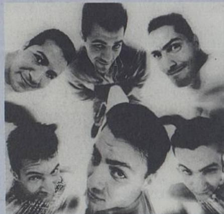
Les frères Seba

▲ Orchestre national de Barbès et DJ Cheb Aziz, maître incontesté du djaying oriental. Mercredi 4 à 20 h 30, la BaraKaSon.