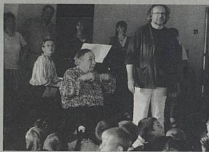
Tournage du film de Pascal Thomas (à droite) au centre musical de la Balinière.

Événement attendu avec impatience dans la région, le film de Pascal Thomas a été projeté en avant-première à Nantes le 24 mars. A Rezé, le cinéma Saint-Paul n'est pas en reste puisque le film y est projeté dès le jour de sa sortie nationale. Séances programmées mercredi 28 mars à 15h, jeudi 29 mars à 20h30, samedi 31 mars à 16h et 20h30, dimanche 1 er lundi 2 et mardi 3 avril à 15h ■