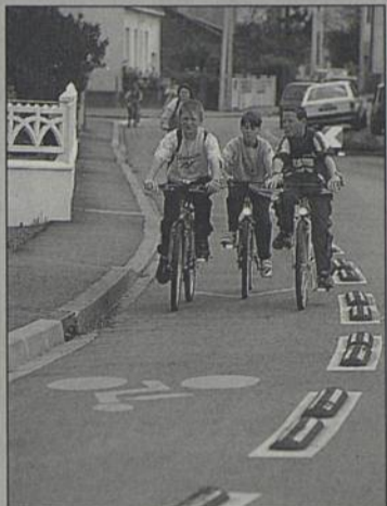
La ville compte aujourd'hui 12 km de bandes et pistes cyclables. D'ici 2001, 6 km supplémentaires seront aménagés.

Des bandes cyclables matérialisées au sol avec de la peinture de couleur verte doivent être réalisées pour le début septembre : d'une part rue De Lattre de Tassigny, d'autre part entre la rue Jean Fraix et la place du 8 Mai, via les rues Aragon et Louise Michel.