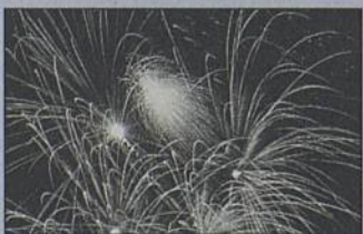
Bal populaire et feu d'artifice à partir de 21h.