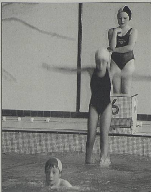
En période estivale, la piscine accueille 500 baigneurs environ par jour.

F ermée depuis le 22 juin pour raisons techniques, la piscine réouvrira ses portes le 1 er juillet à 10h. Durant les vacances d'été, elle sera ouverte les mardi, mercredi, jeudi, vendredi de 10h à 11h50, 12h15 à 16h45, 17h30 à 20h, les samedi et dimanche de 9h à 12h30, 14h à 17h. Fermé le lundi. Une nouveauté : des bains de soleil sont désormais proposés au public sur le solarium.