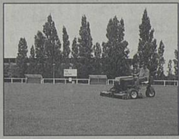
Parmi les travaux d'entretien : la tonte régulière des pelouses.

C'est pourquoi l'utilisation de ces terrains par les sportifs sera interdite du 1 er juillet au 31 août.