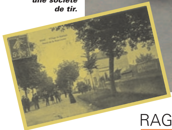
Les traditionnelles courses cyclistes se disputeront le jeudi 25 mai.

Née en 1906, la Ragonnaise était à l'époque une société de tir.