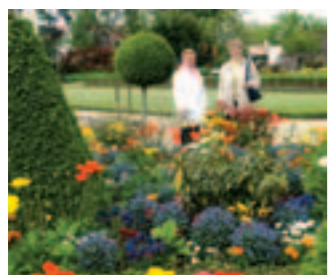
Le tramway, les équipements sportifs et les parcs : trio gagnant du sondage.

R ezé, une ville agréable à vivre ? 93 % des cinq cents Rezéens, interrogés dans le cadre d'une enquête, l'affirment. En décembre dernier, l'agence rennais de sondages TMO, missionnée par la Ville, a réalisé une étude d'image. La qualité de vie rezéenne emporte de nombreux suffrages : 35 % la jugent très agréable, 58 % assez agréable. Par ailleurs, 78 % des Rezéens interrogés constatent une amélioration (34 %) ou un maintien (44 %) de la qualité de vie. Il en résulte un sentiment de satisfaction résidentielle partagé largement par les habitants, lesquels, pour 78 %, manifestent leur intention de rester vivre à Rezé. Par ailleurs, 82 % d'entre eux déclarent leur intérêt pour l'évolution