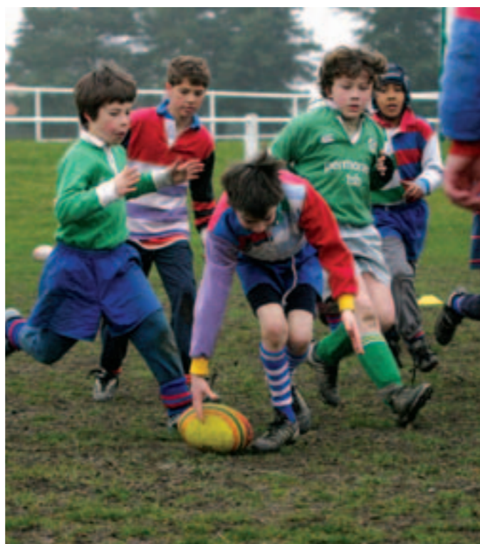
Une belle mêlée de 500 joueurs attendue à la Robinière le 21 mai.

Dimanche 21 mai, stade de la Robinière. Rens. 02 40 75 48 58.