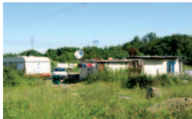
La Ville va réaménager les terrains de la rue Pierre-Legendre où sont installées 15 familles de gens du voyage.

tôt de créer une nouvelle gare TER à la Trocardière pour permettre la connexion avec la ligne 2". Une solution qui, selon Jacques Floch, conseiller municipal et député, présente un inconvénient majeur : " Cela allongerait le temps de trajet pour les voyageurs en provenance de Sainte-Pazanne ou d'autres communes du sud-Loire. C'est comme si on attendait du TGV qu'il