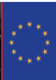
Journée de l'Europe