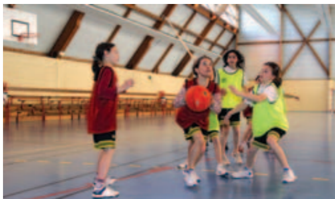
Le sport accessible à tous, telle est la vocation des écoles de sport.