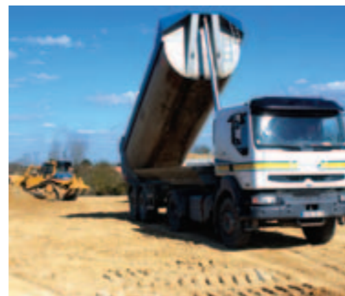
Remblaiement du site de la Malnoue.

Legendre. Pour offrir de meilleures conditions de vie et de logement à ces familles, qui feront l'objet d'un accompagnement social, la municipalité a décidé de lancer une opération de requalification de l'ensemble du secteur. Ce projet de réaménagement sera opéré en lien avec la restauration et la mise en valeur du cours d'eau de l'Ilette qui sera doté d'un cheminement piéton.