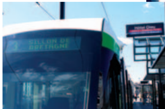
La ligne 3 ira du Sillon de Bretagne jusqu'à Pont-Rousseau.

Le conseil municipal du 17 mars a approuvé le projet de prolongement de la ligne 3 du tramway jusqu'à la gare de Pont-Rousseau.