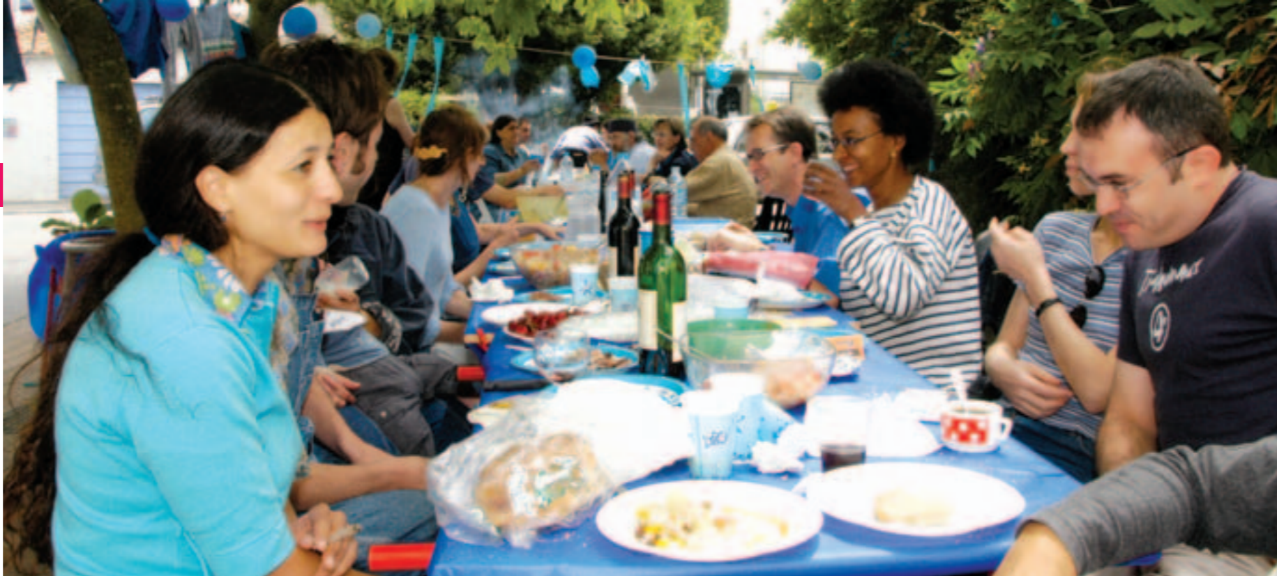
Les animations festives font l'unanimité.

500 Rezéens ont été interrogés sur les liens qui les unissent à leur ville.