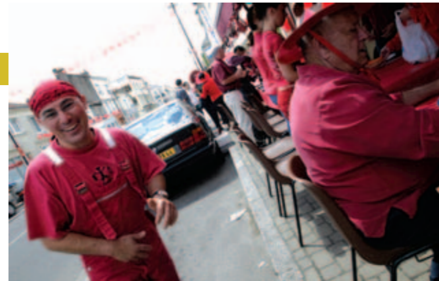
Rouges l'an passé, commerçants et riverains seront bleus cette année.