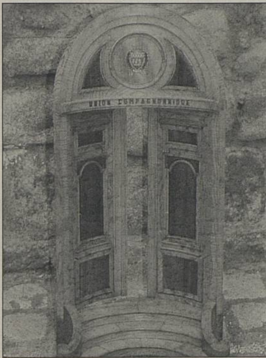
Chef-d'œuvre du pays de Bréjon - menuiserie

Dès l'origine, la société des compagnons