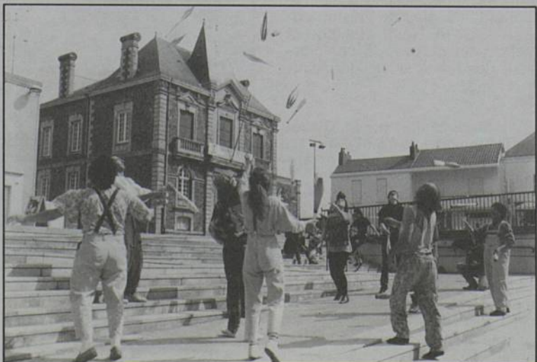
Rencontre européenne de jonglage.

Renseignements et réservations : ARC, 43 rue de la Commune, 40 05 05 00.