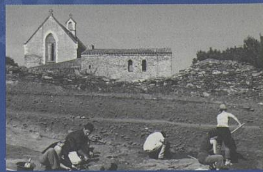
Le site de St-Lupien.

Renseignements : Action culturelle 02 40 84 43 89.