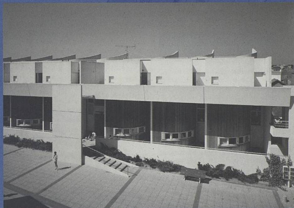
Les cap Horniers.

des pompiers, la Haute-Ile (visite du site).