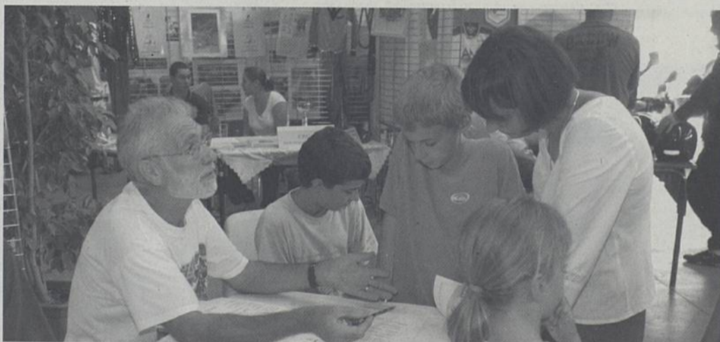
68 associations seront présentes Halle de la Trocardière.

Parmi les rendez-vous incontournables de la rentrée figure le forum des associations. Cette année 68 associations seront présentes, Halle de la Trocardière, le samedi 3 de 14h à 19h. La nouveauté et événement phare, consiste en un café-débat, mené par un philosophe vendredi 2 à 20h, cafétéria de la Halle.