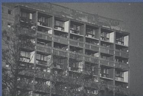
La Maison Radieuse.