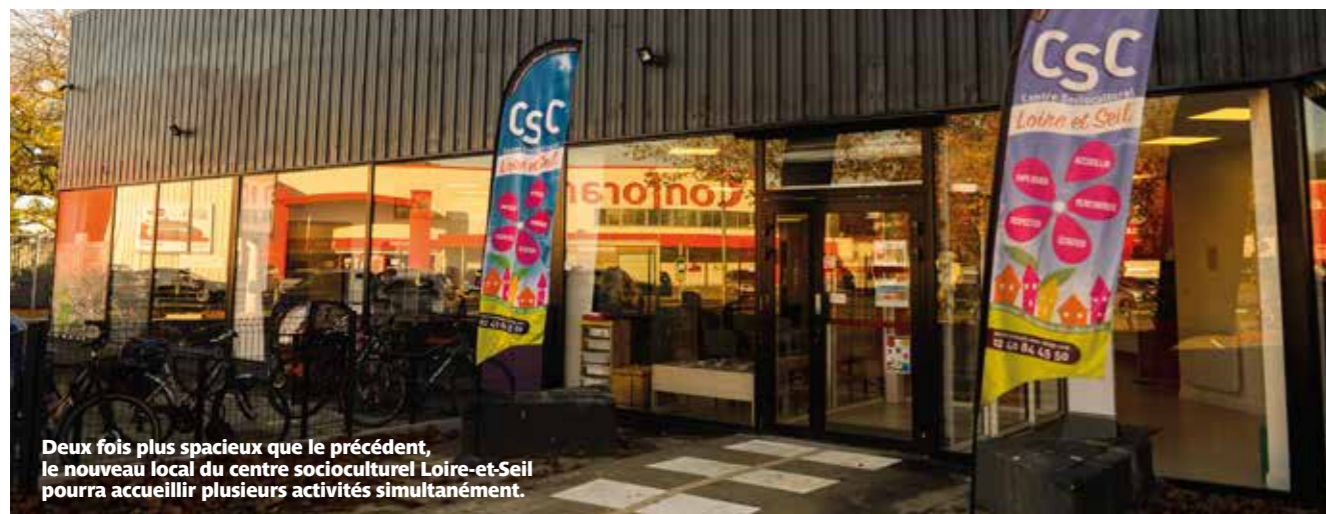
Deux fois plus spacieux que le précédent, le nouveau local du centre socioculturel Loire-et-Seil pourra accueillir plusieurs activités simultanément.

Le centre socioculturel a pris possession d'un local de 500 m 2 dans la zone Atout-Sud. Ce déménagement et le renforcement de l'équipe d'animateurs vont favoriser l'émergence de nouvelles propositions aux habitants.