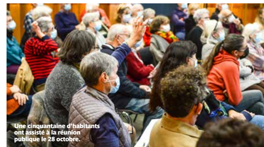
Une cinquantaine d'habitants ont assisté à la réunion publique le 28 octobre.

« La mixité fonctionnelle, avec les commerces, les loisirs et le travail au plus près, pourra être favorisée sur ce secteur. Avec la réimplantation de commerces et les services existants, on souhaite avoir un quartier vivant, dynamique. L'objectif est de redonner au bourg de Rezé une vraie centralité, sa fonction de quartier de vie locale. L'arrivée du tramway va aussi y contribuer. »