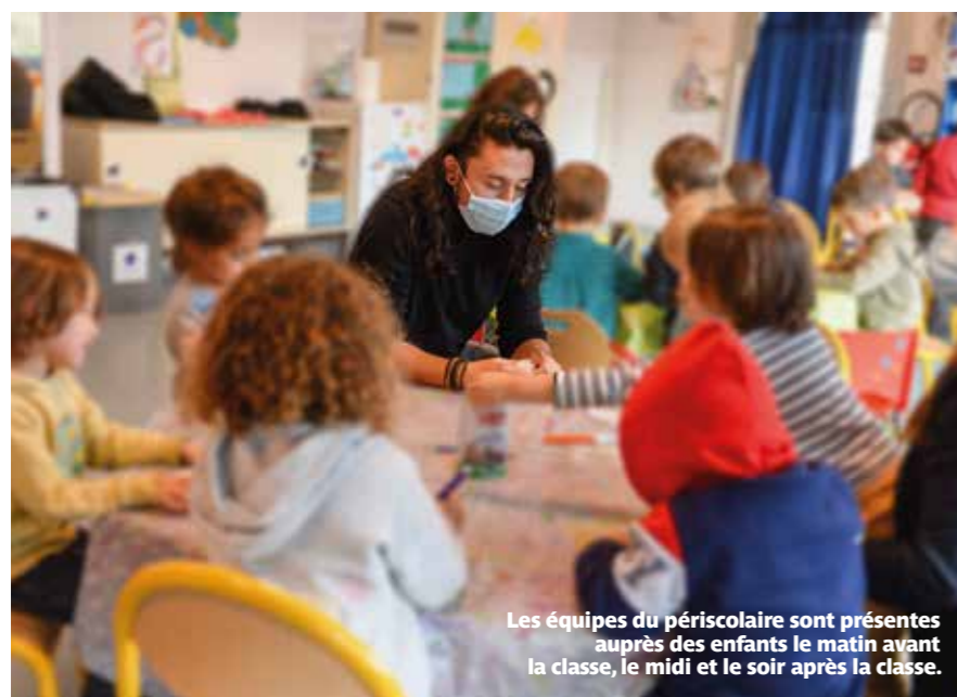
Les équipes du périscolaire sont présentes auprès des enfants le matin avant la classe, le midi et le soir après la classe.

Dans ses écoles, la Ville compte 231 agents périscolaires. Leurs missions auprès des enfants sont essentielles. Faisons le point sur ce métier qui mérite d'être mieux connu.