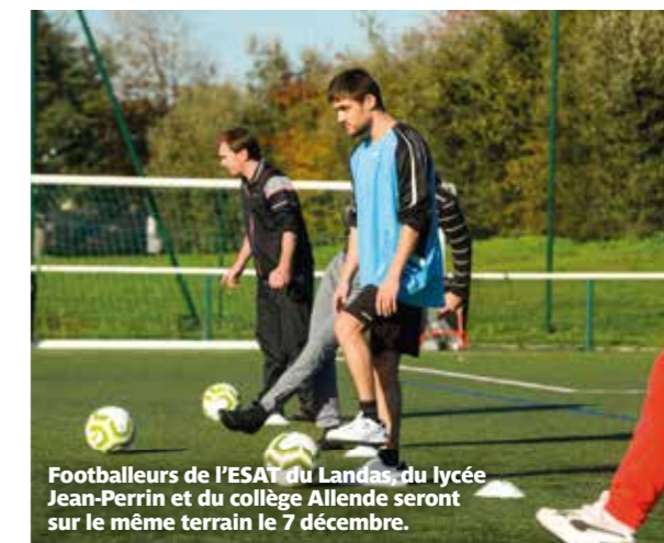
Footballeurs de l'ESAT du Landas, du lycée Jean-Perrin et du collège Allende seront sur le même terrain le 7 décembre.

Mardi 7 décembre de 13h30 à 16h30 au stade Léo-Lagrange. Entrée libre.