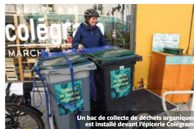
Un bac de collecte de déchets organiques est installé devant l'épicerie Colégram.