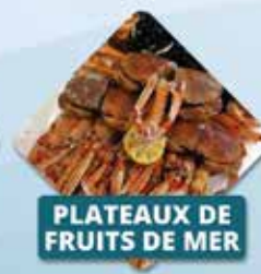
PLATEAUX DE FRUITS DE MER

73, rue Jules Vallès 44340 BOUGUENAIS SORTIE N°50 - PORTE DE RETZ