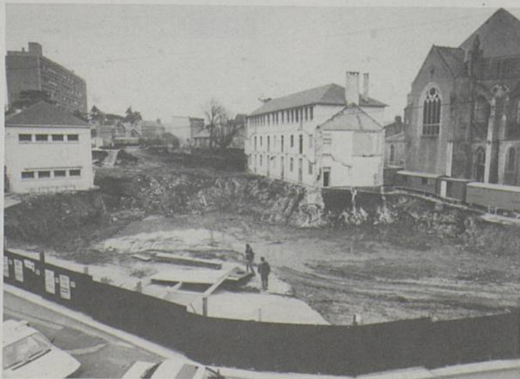
Deuxième photo du chantier mairie. Ça cravache dur et les terrassiers tiennent la corde. Ligne d'arrivée : 1989.