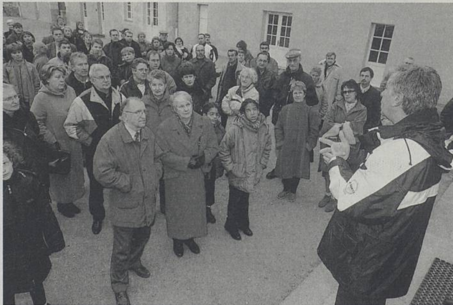
Accueil par le Maire des nouveaux habitants au centre musical de la Balinière (édition 2002).

A Rezé, l'accueil des nouveaux habitants revêt un caractère particulièrement important. En effet, ces derniers sont nombreux. Qu'on en juge : 36 % des Rezéens recensés en 1999 n'habitaient pas la commune en 1990 ! Actuellement, on estime à environ 800 le nombre de logements qui changent de main chaque année. Ainsi, chaque année en novembre, près d'un millier de nouveaux ménages est invité à une journée de réjouissance organisée par la Ville de Rezé en collaboration avec l'association Rezé Loisirs Accueil. 2003 ne déroge pas à la règle : avant le 10 novembre, 936 foyers auront reçu un courrier d'invitation et une fiche d'inscription. Si après cette date vous n'avez rien reçu et que vous êtes arrivé à Rezé depuis le 1 er septembre 2002, n'hésitez pas à vous faire connaître : sportvieassociative@mairie-reze.fr ou 02 40 84 45 30. Des fiches d'inscription - pour tout ou partie du programme - sont disponibles à l'accueil de l'Hôtel de Ville.