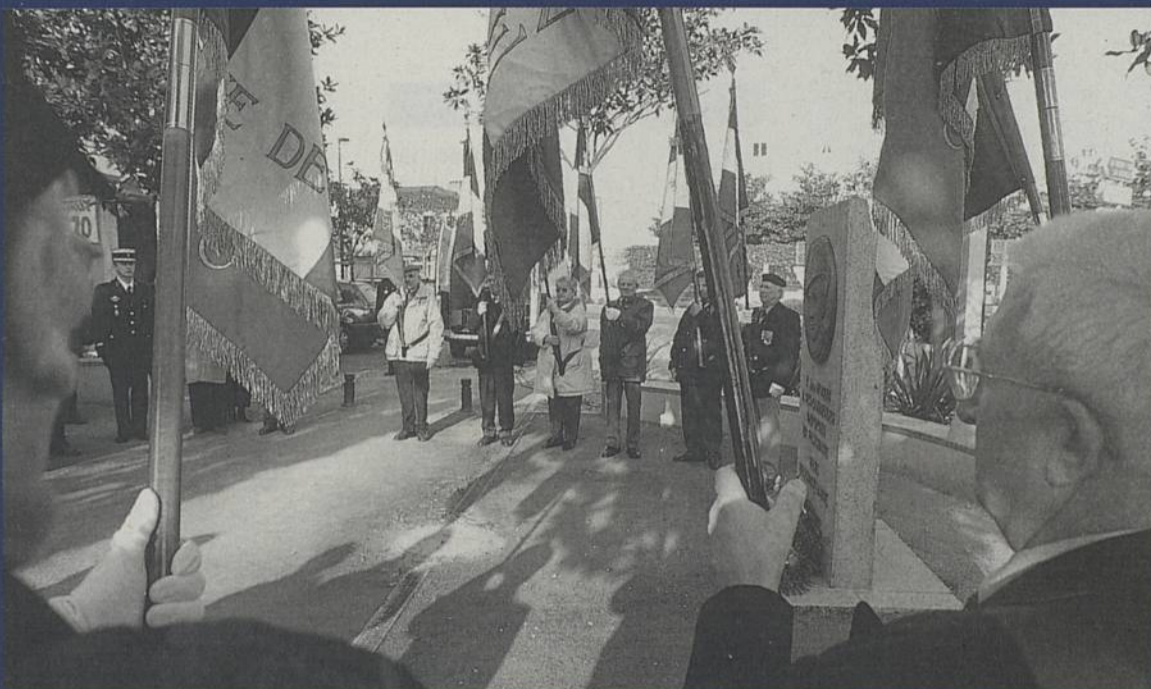
L'inauguration d'une exposition sur le « procès des 42 » se fera à l'occasion de la cérémonie commémorative du 11 novembre 1918.

Le 1 er novembre à 11h, place Levoayer, a lieu la cérémonie en l'honneur des marins disparus. Le 11 novembre, la commémoration de l'armistice de la guerre 14-18 débutera par l'inauguration d'une exposition (voir ci-dessous) à 10h à l'Hôtel de Ville. Suivront un rassemblement au cimetière Saint-Pierre à 10h30, au Square Jean-Moulin à 10h45, au monument aux morts place Salengro à 11h05, au cimetière St-Paul à 11h30.