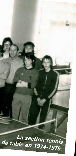
La section tennis de table en 1974-1975.