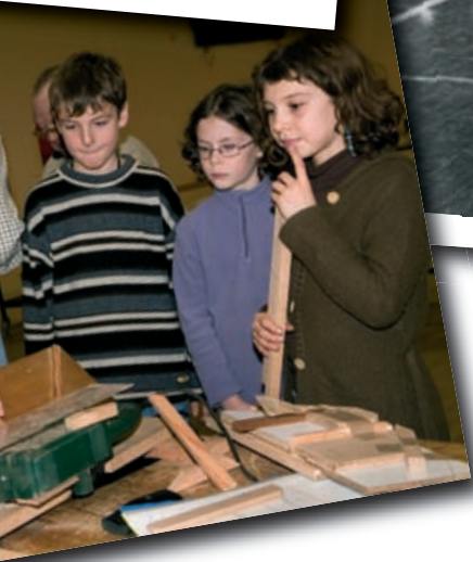
L'amicale cultive l'intergénérationnel. Sur la photo, l'atelier travaux manuels à l'école Salengo.