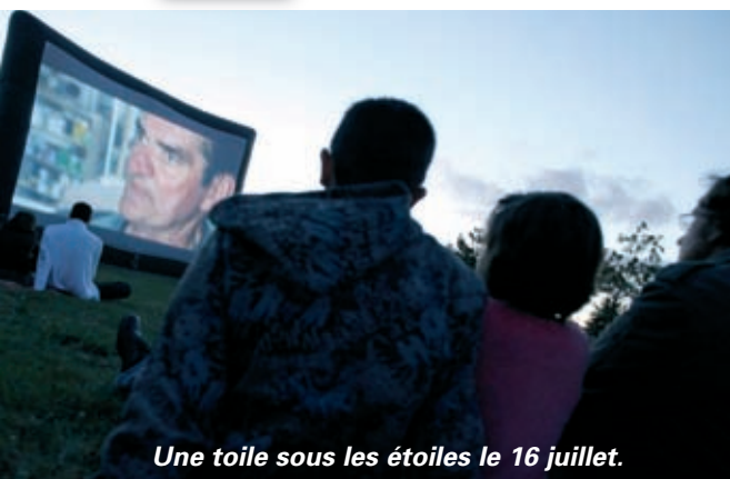
Une toile sous les étoiles le 16 juillet.