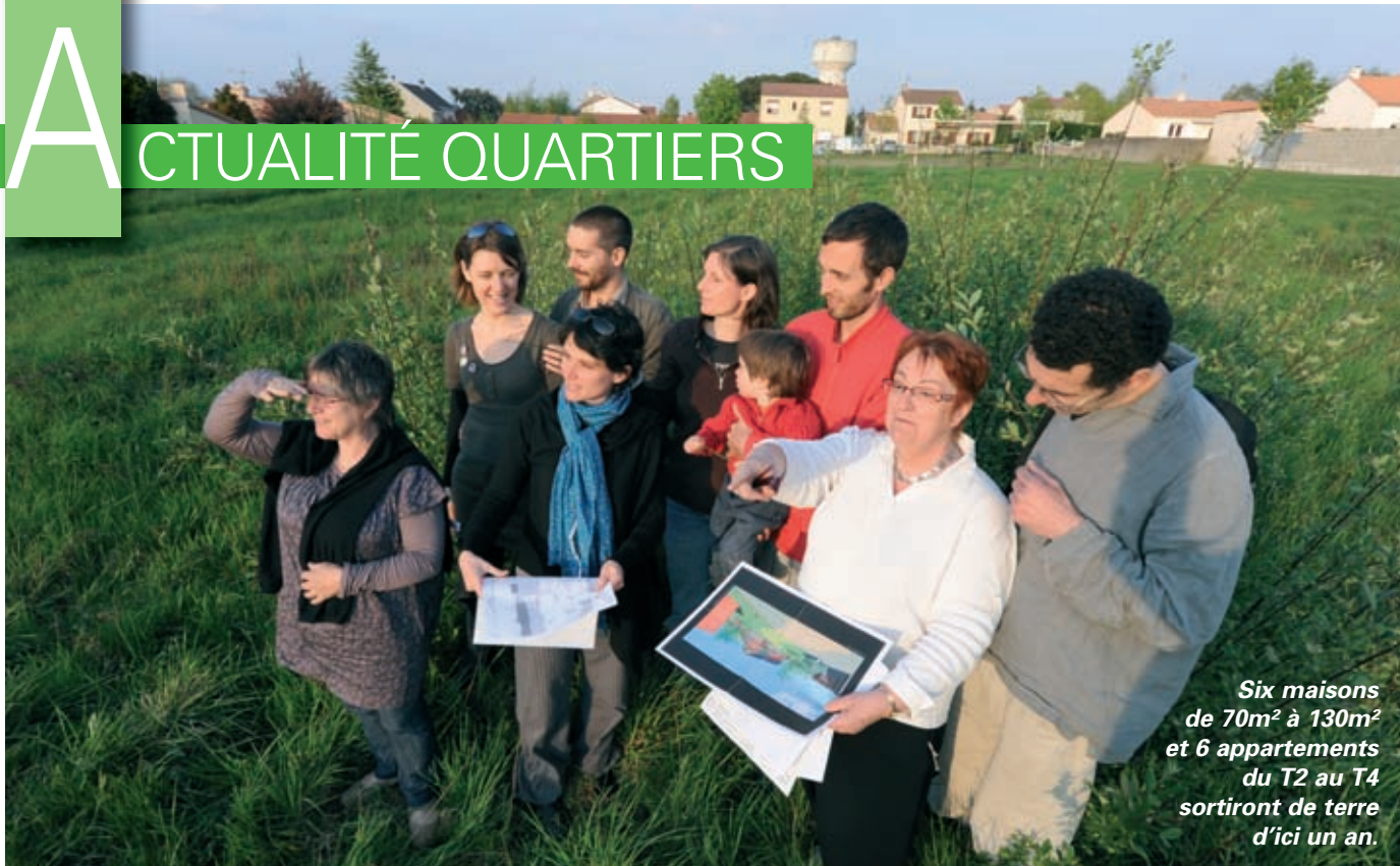
Six maisons de 70m 2 à 130m 2 et 6 appartements du T2 au T4 sortiront de terre d'ici un an.