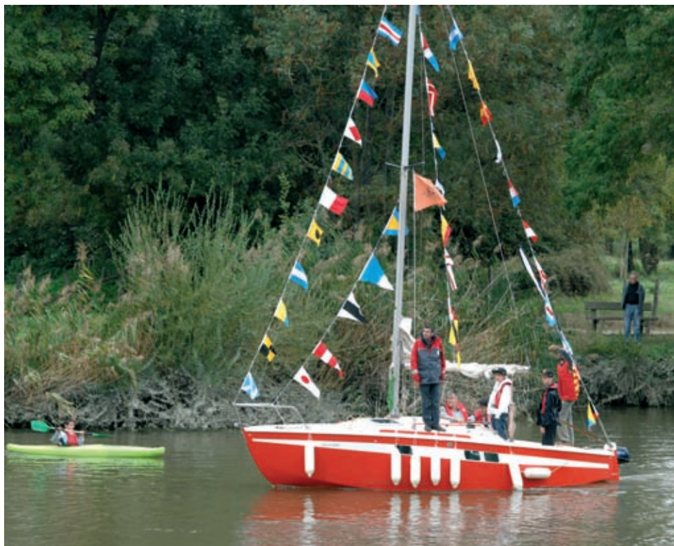
Balade sur la Sèvre en pagayant ou en tirant des bords sur un Muscader.

Par l'ASBR Volley-ball. Samedi 12 juin de 13h30 à 17h30, stade Léo-Lagrangé. Possibilité de constituer son équipe sur place. Gratuit. Rens. 06 62 52 64 15.