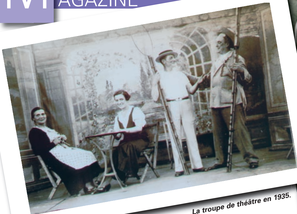
La troupe de théâtre en 1935.