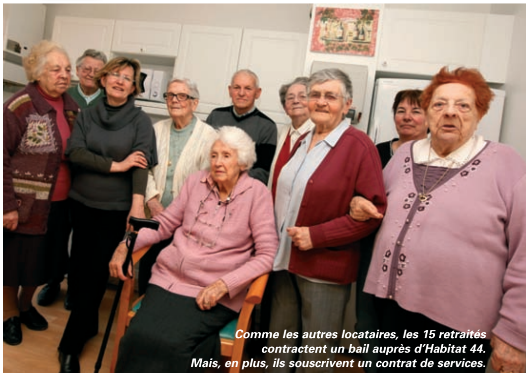
Comme les autres locataires, les 15 retraités contractent un bail auprès d'Habitat 44. Mais, en plus, ils souscrivent un contrat de services.

Démonstration de capôiera. Samedi 19 juin, 10h-19h, Pré des Roquios (près de la salle Marchais). Gratuit. Rens. 02 40 05 45 27.