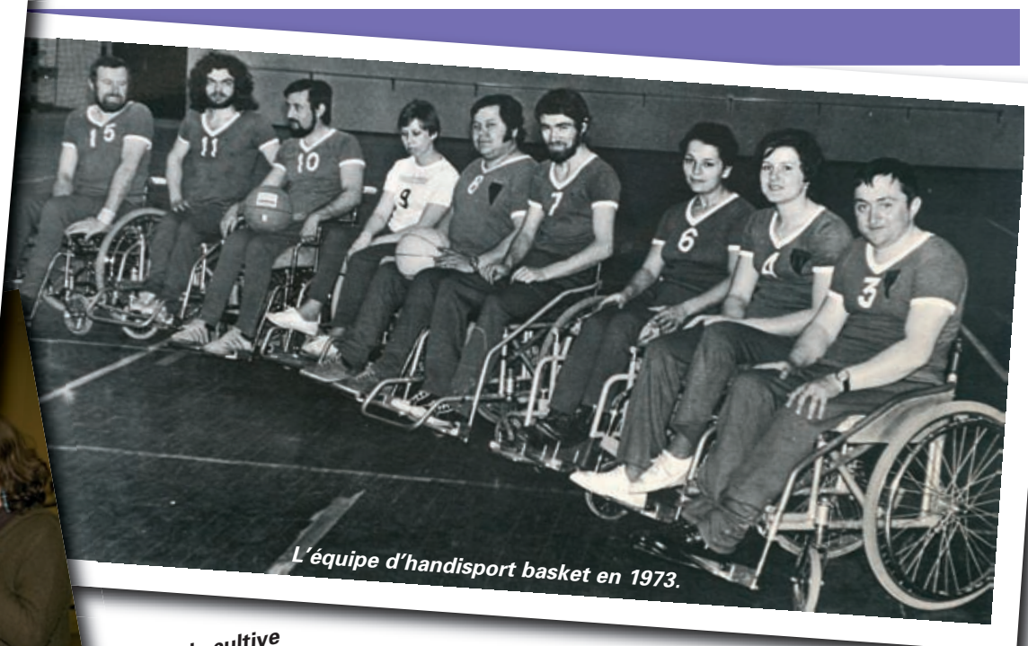
L'équipe d'handisport basket en 1973.