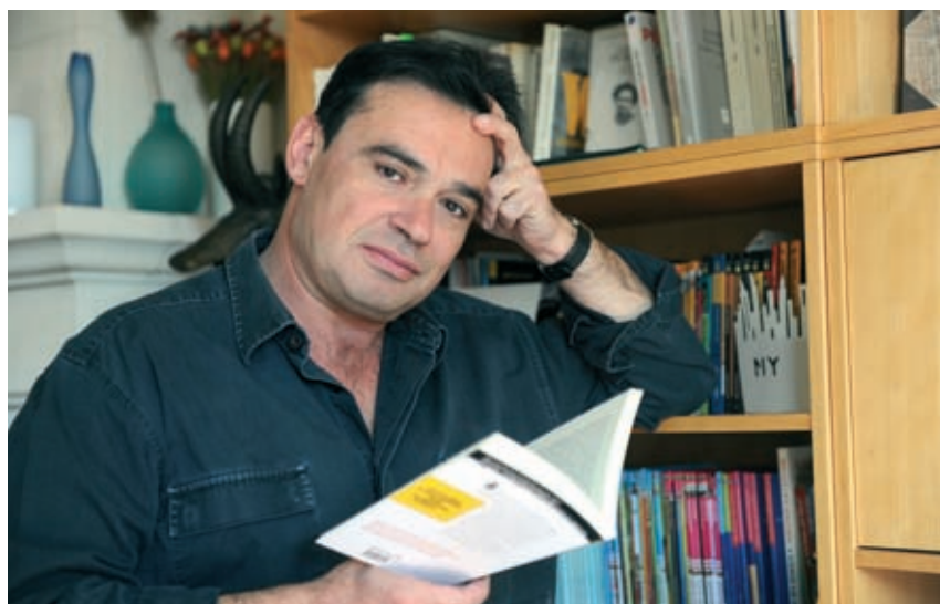
Hubert Ben Kemoun, un auteur proluxe de littérature jeunesse.

vient de paraître (Editions du Seuil). Son secret ? "J'écris tous les jours, comme un musicien fait ses gammes." Il collabore avec huit éditeurs, est traduit en une quinzaine de langues. "Qu'ils soient de Mayotte, Beyrouth ou Moscou, les gamins tremblent et rigolent aux mêmes passages d'un livre." Ce qu'il aime par-dessus tout, c'est inventer des histoires : "On me paye à raconter des mensonges !" . En ce moment, il planche sur les œuvres qui sortiraient en fin 2011 et 2012. Mais d'ici là, six autres albums et romans auront été publiés. Ecrire pour les grands ? Il n'y pense