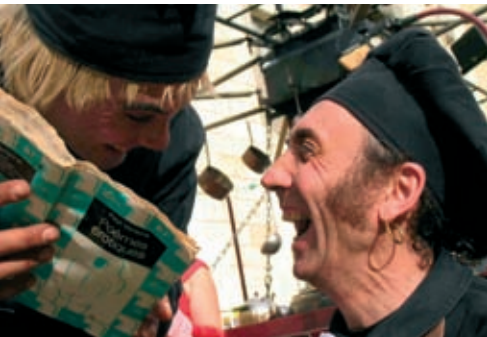
La belle abondance, dimanche 13 juin