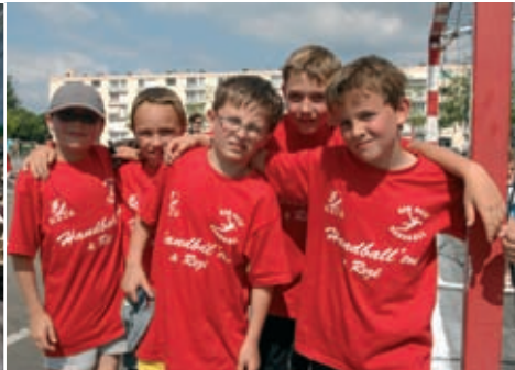
Handball'toi, dimanche 13 juin