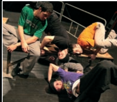
Block party, samedi 12 juin