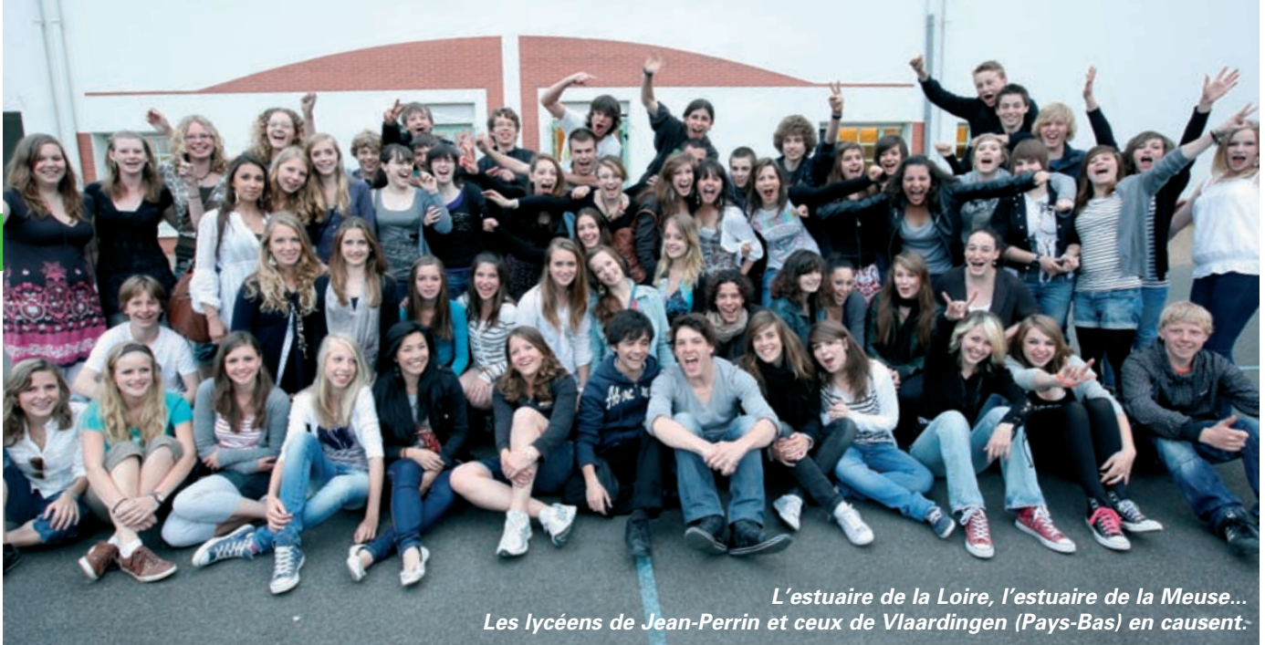
L'estuaire de la Loire, l'estuaire de la Meuse... Les lycéens de Jean-Perrin et ceux de Vlaardingen (Pays-Bas) en causent.