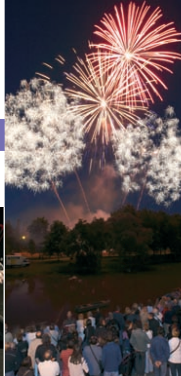
Fête nationale, 13 juillet