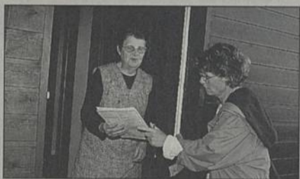
L'agent recenseur aidera ceux qui le souhaitent à remplir les imprimés.

Cette action conjointe de l'INSEE (Institut National de la Statistique et des Études Économiques) et des mairies est l'occasion unique de disposer d'une photographie précise et actualisée de la population. Le dernier recensement date en effet de 1990. La ville de Rezé comptait alors 33 303 habitants. Combien sommes-nous aujourd'hui ? Comment ont évolué les conditions de logement et les modes de transport ? Quelle est la composition des ménages, la pyramide des âges ? Le recensement répondra à toutes ces questions. Leur dépouillement et leur analyse permettra ensuite d'adapter les besoins, tant au niveau local que national, en terme d'emploi, d'équipement, de protection sociale et sanitaire.