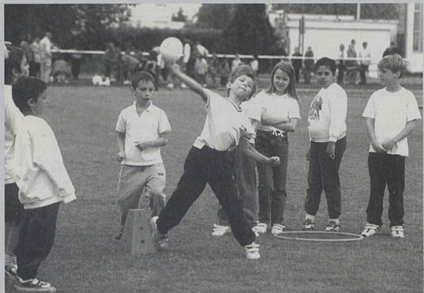
Fête de l'USEP : le 24 mai

Tournoi des écoles de basket du Cercle Saint-Paul.