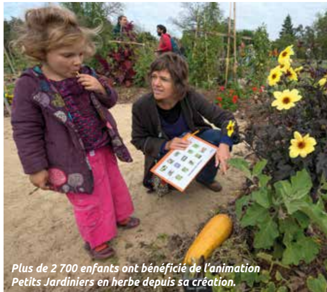
Plus de 2 700 enfants ont bénéficié de l'animation Petits Jardiniers en herbe depuis sa création.

verts. « Ce jardin pédagogique est un vrai plus pour l'animation », estime Laurène Stordeur, responsable du service développement de la Ville. C'est également au Jardiversité, samedi 24 juin, que les parents et tous les Rezéens pourront admirer les réalisations colorées des petits jardiniers.