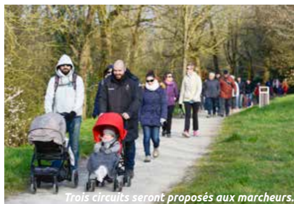
Trois circuits seront proposés aux marcheurs.

Dimanche 2 avril, se déroulera le Tour de Rezé. Cette année, ce n'est pas une mais trois boucles qui seront proposées aux marcheurs. Histoire que chacun, quel que soit son niveau, puisse trouver son bonheur. Les plus aguerris s'attaqueront, sans hésitation, aux 18,5 km. Bords de Sèvre, quai de Trentemoult, balade le long de l'Îlette et de la Jaguère, la promenade se fera au fil des cours d'eau qui bordent la commune. Pour les marcheurs occasionnels, une variante de 10,4 km est possible. Elle propose de couper à travers la ville à partir de Ragon pour rejoindre le quartier Pont-Rousseau. Quant aux familles, un circuit sous les bois de 6,2 km les accueillera. Cette randonnée sera l'occasion de (re)découvrir quelques trésors du patrimoine rezéen : les maisons à tuiles rouges du village de l'Aufrère, la traversée de l'Îlette sur pilotis ou encore la tour de la Guzoire. Le plus dur sera de faire un choix !