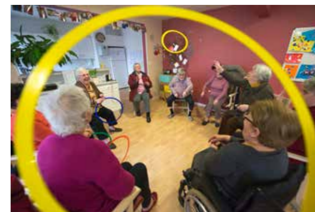
Maison de retraite, résidence ou domicile services... Trouvez le lieu de vie le plus adapté à vos besoins ou à ceux de vos proches.

Mardi 25 avril, de 15h30 à 17h30 à la salle du Seil, allée de Provence. Entrée libre.