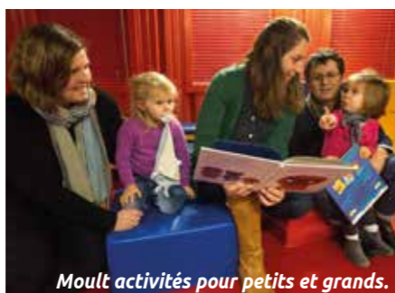
Moult activités pour petits et grands.

Le CSC Jaunais-Blordière invite les habitants du quartier à découvrir