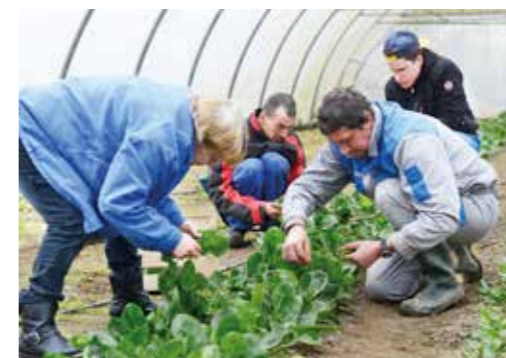
Du 18 au 28 avril : pré-recrutements et ateliers de préparation.

Deux semaines pour trouver un emploi saisonnier. À l'approche de l'été, la Maison de l'emploi de la métropole nantaise organise des pré-recrutements sur ses huit sites, dont celui de Rezé. Du 24 au 28 avril, des offres d'emploi seront à pourvoir dans différents secteurs : l'animation, la restauration collective, les services à la personne, le commerce, l'industrie/logistique, l'hôtellerie de plein air/nettoyage, l'agroalimentaire/maraîchage ou encore la relation clients à distance. Rendez-vous dès le 7 avril sur www.maisondeemploi.org pour les découvrir. Afin de mettre toutes les chances de votre côté, des ateliers de préparation seront organisés en amont, du 18 au 25 avril. Au programme : simulations d'entretien, personnalisation de votre CV et conseils pour avoir un look adapté le jour J.