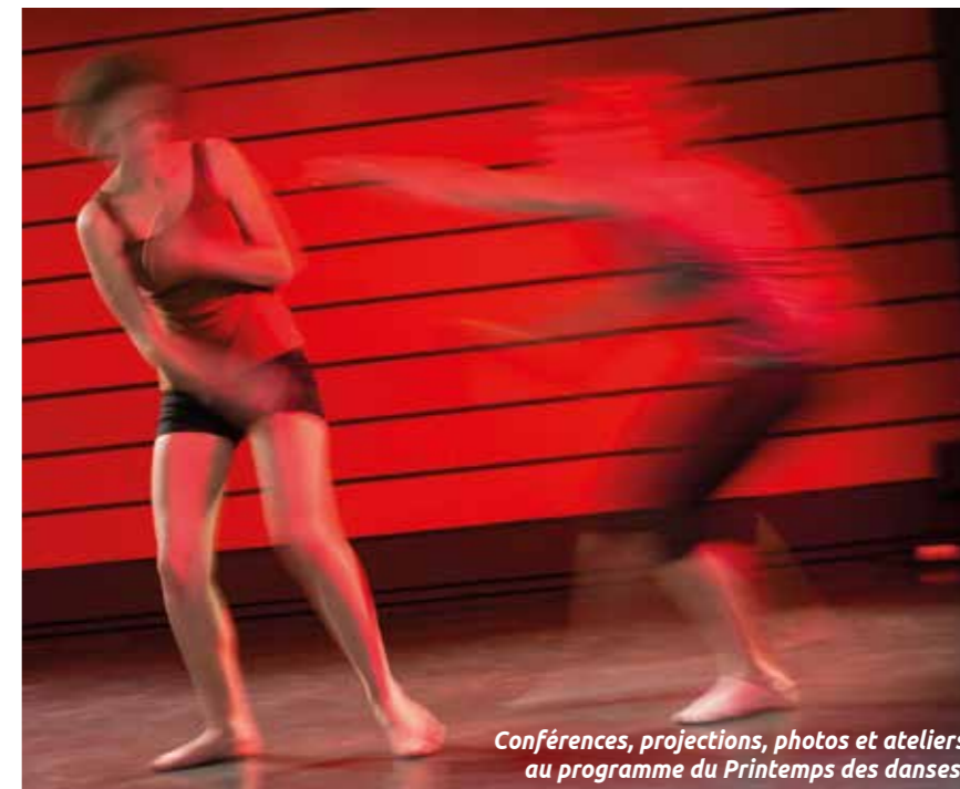
Conférences, projections, photos et ateliers au programme du Printemps des danses.

Une semaine entière au rythme de la danse ! En 2017, le Printemps des danses revient dans un format enrichi avec conférences, projections, photos et ateliers. L'occasion de découvrir l'univers de la discipline sous tous les angles. Dès le premier jour, les élèves de l'école municipale de musique et de danse présenteront un spectacle au théâtre municipal. Ensuite, deux documentaires seront projetés : l'un sur la danseuse Pina Bausch au cinéma Saint-Paul et l'autre sur l'histoire de la danse à travers la vie de Vaslav Nijinski au centre musical de la Balinière. La semaine se poursuivra au cinéma Saint-Paul par la diffusion du court-métrage réalisé par Maud Marqué autour de Folie , création du chorégraphe Claude Brumachon, et par la projection de la comédie musicale West Side Story . Un autre chorégraphe, David Rolland, animera une « conférence dansée », où il illustrera ses propos par des démonstrations de danse. Une exposition photo sera présentée à la Balinière et au