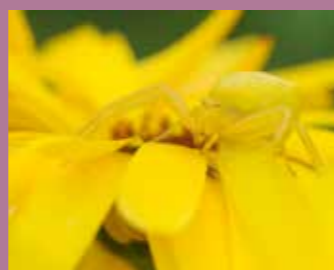
« Jardins de sauvages, la biodiversité étonnante des potagers », jusqu'au 31 mai.

Jusqu'au 31 mai. Vernissage mercredi 5 avril à 18h. Maison du développement durable. Entrée libre.