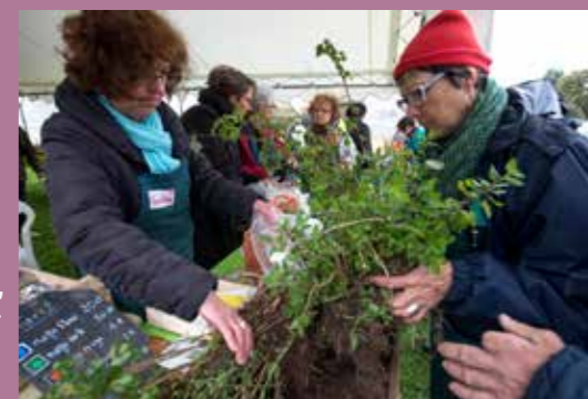
Troc-plantes de La Maison, le 1 er avril.

Au programme : jeux, animations et repas partagé en plein air. La recette du Troc-plantes permettra d'organiser une sortie à la mer pour les personnes fréquentant La Maison. Samedi 1 er avril, de 10h à 16h. Square du Moulin-de-Pront, rue Joseph-Turbel. Entrée libre. Rens. 02 51 70 14 87.