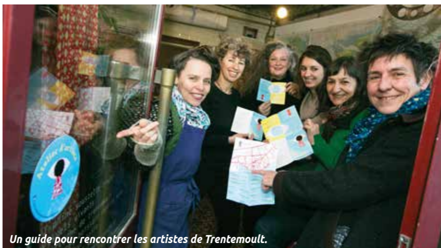
Un guide pour rencontrer les artistes de Trememoult.

Les artistes visuels de Trememoult sont réunis dans un petit guide. Une invitation à venir les rencontrer, sur rendez-vous.