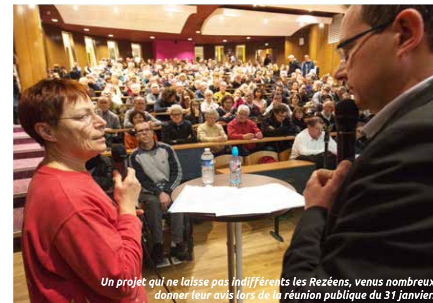
Un projet qui ne laisse pas indifférents les Rezéens, venus nombreux donner leur avis lors de la réunion publique du 31 janvier.

Le tramway ira jusqu'à ce nouveau quartier. Les travaux vont commencer dans deux ans.