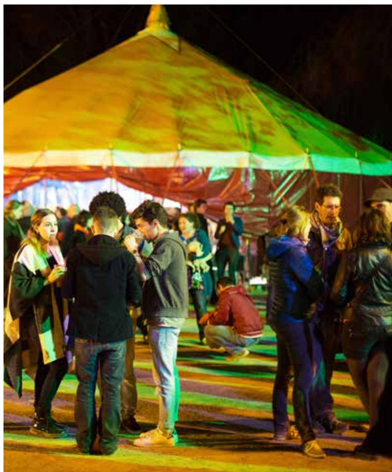
Musiques indépendantes et arts graphiques à découvrir sous chapiteau.