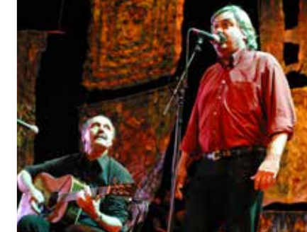
Répertoire cuisinier, le 7 avril.