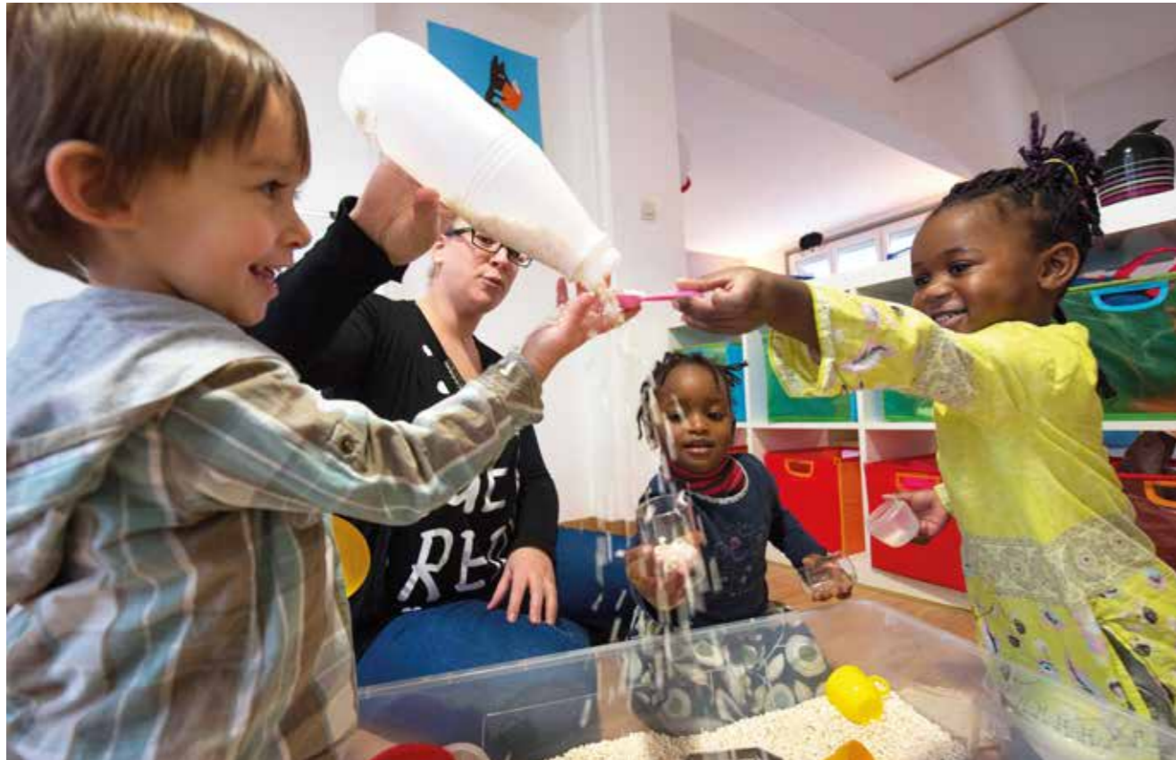
À la microcrèche des Castors, une structure pas comme les autres : on accueille les enfants et on accompagne leurs parents en insertion professionnelle.

L'arrivée d'un enfant rime souvent avec course pour trouver la crèche ou la nounou parfaite ! À Rezé, les parents sont plutôt bien lotis avec plus de 1 100 places réparties entre les structures municipales, associatives et privées ainsi que les assistants maternels. Une offre qui va encore s'améliorer avec l'ouverture de nouveaux établissements.