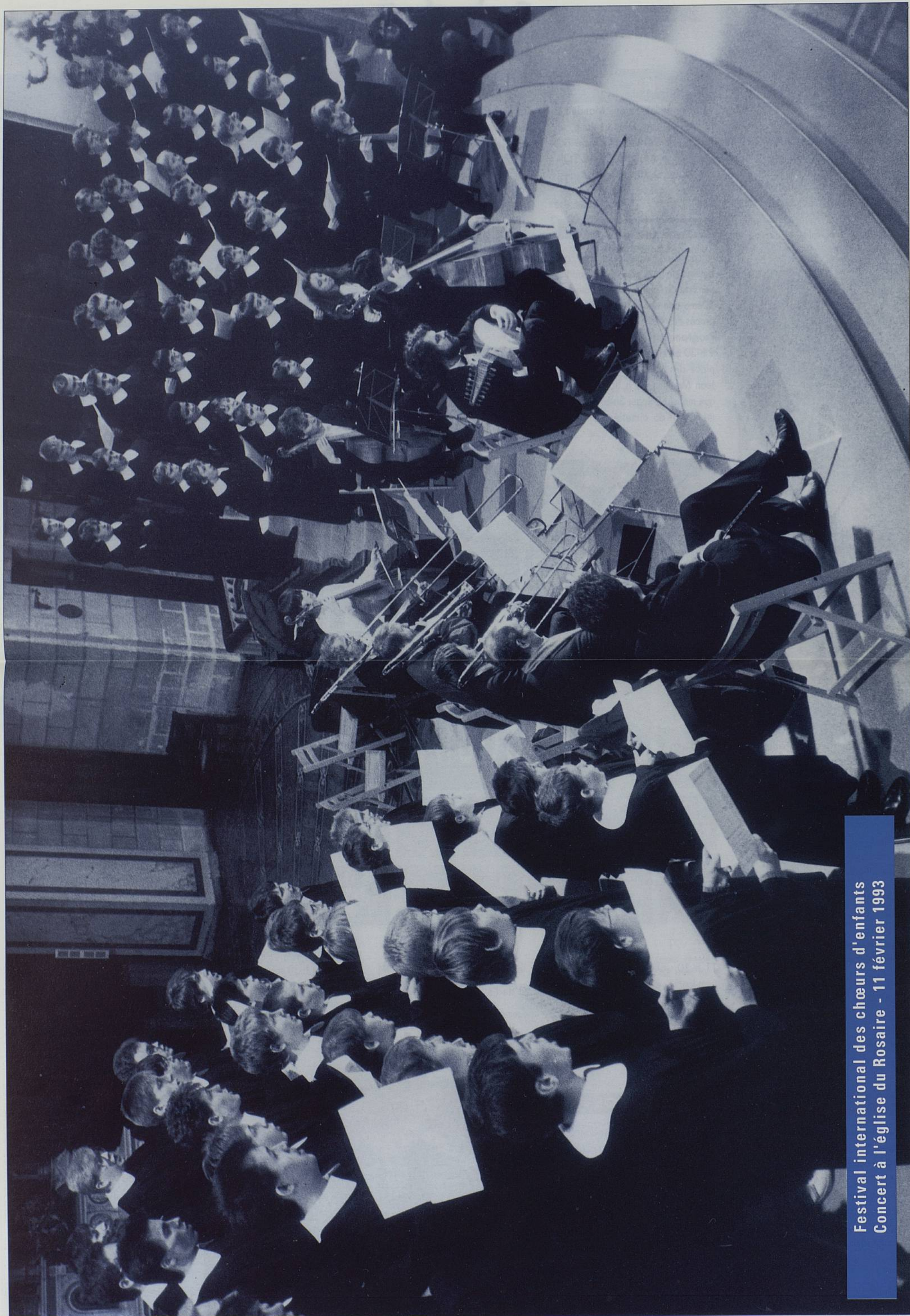
Festival international des chœurs d'enfants Concert à l'église du Rosaire - 11 février 1993