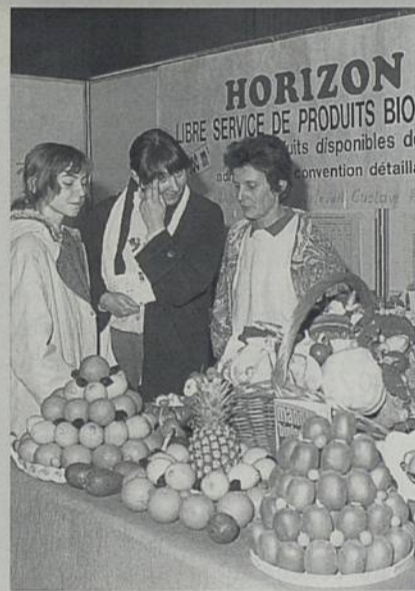
Le salon du bien-être et des produits naturels. Février 1992.

Le second salon s'appelle "Habitat 93". Il regroupe 80 exposants environ dans la construction, décoration, cuisine, véranda, piscine, meuble,