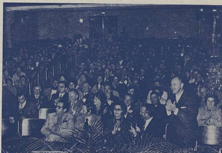
A 16 h 30 le Théâtre Municipal est comble, l'assistance Franco-Allemande applaudit chaleureusement...