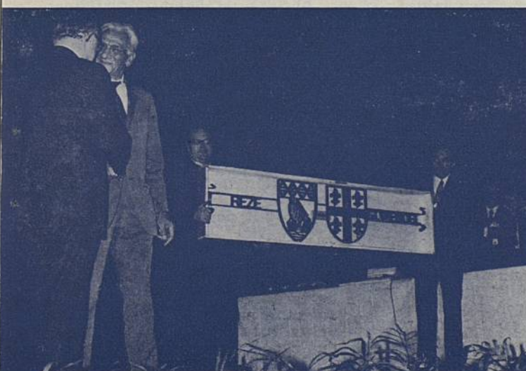
... à ces symboles nos amis de Saint-Wendel répondent par cet ouvrage consacrant l'amitié indéfectible des deux villes.