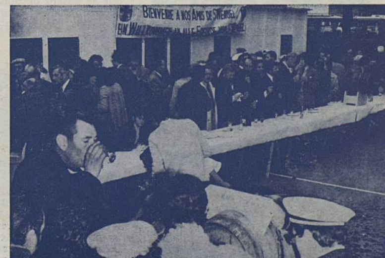
... et c'est le verre de l'amitié sur la place des Filets, Muscadet et Gros-Lot sont déterminants pour souder le Jumelage !