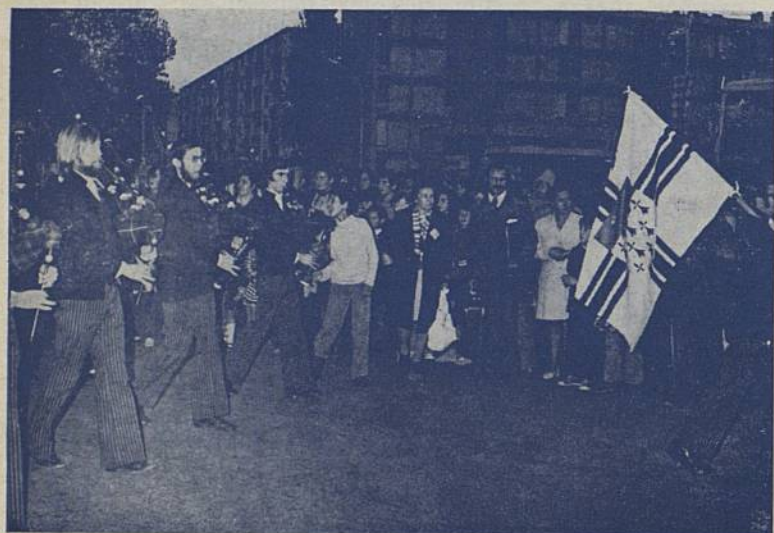
Les valises à la main, Rézéens et Sarrois vont suivre la Kévrenn jusqu'à la Maison des Jeunes où...