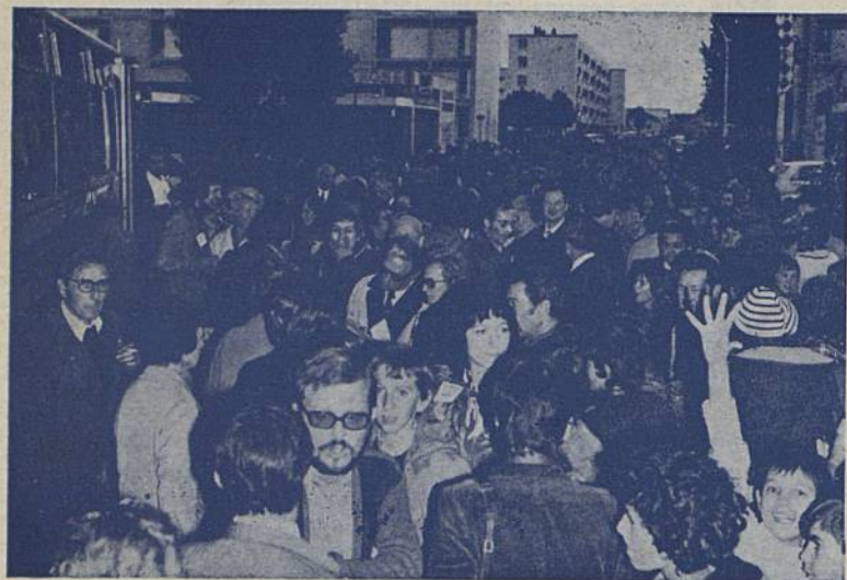
Le 4 octobre à 18 h. : Arrivée des cars Sarrois. Chaque Rézéen à la recherche de son invité. Les habitants du Château sont venus nombreux à cette première prise de contact.

4 - 5 - 6 Octobre 1974 Les journées de l'amitié