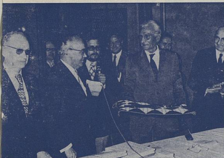
... la clé symbolique de la Ville de Rezé