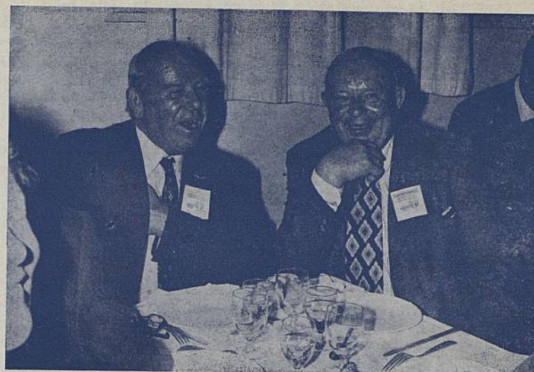
Le 5 octobre à 13 h. : Déjeuner officiel au restaurant scolaire de Château-Sud. — C'est donc ton frère ? —