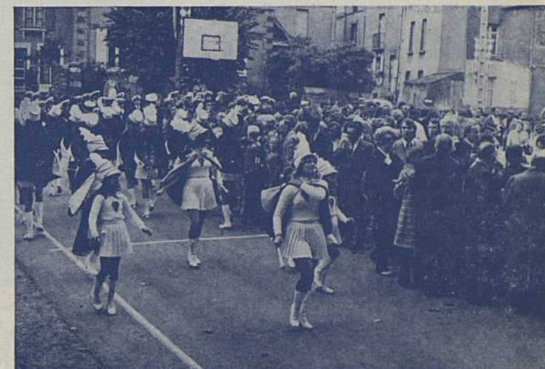
A 11 h 30 : Les majorettes annoncent aux « Trentemousins » l'arrivée de la délégation de Saint-Wendel