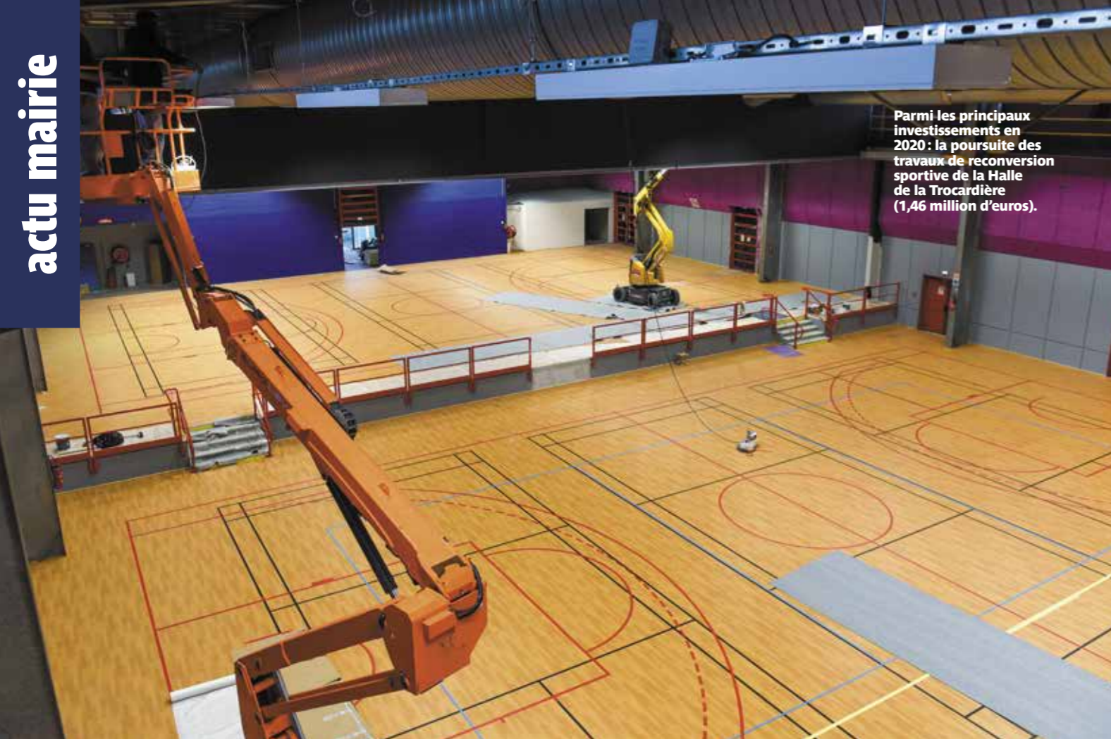
Parmi les principaux investissements en 2020 : la poursuite des travaux de reconversion sportive de la Halle de la Trocardière (1,46 million d'euros).