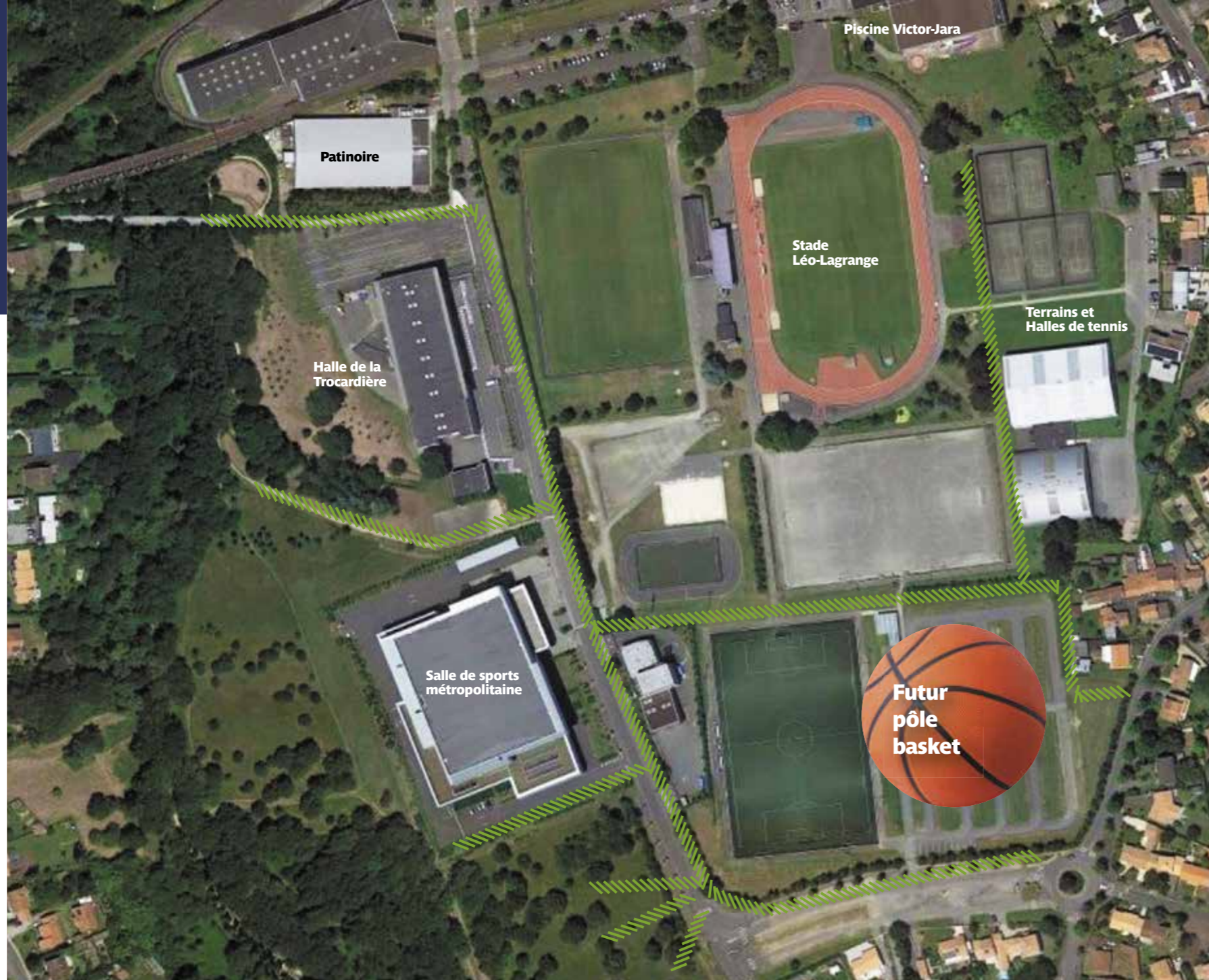
Renforcement du milieu naturel "corridor vert"