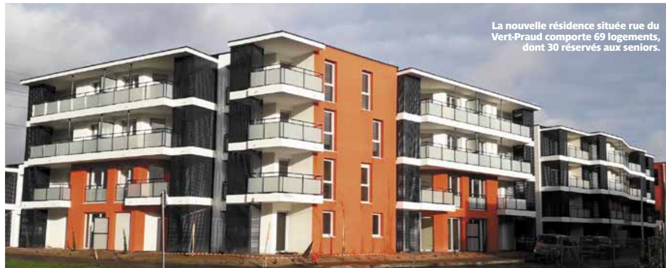
La nouvelle résidence située rue du Vert-Praud comporte 69 logements, dont 30 réservés aux seniors.

La résidence Acanthis, située au Vert-Praud, a accueilli ses premiers occupants fin janvier. Sa particularité : une trentaine de logements sont dédiés aux seniors.