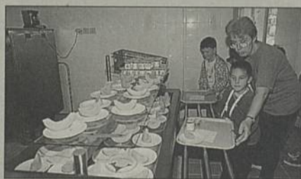
Le nouveau restaurant scolaire de Château-Nord accueille 130 enfants.

Chaque année, la Ville assure l'entretien et la rénovation des écoles communales (3,3 MF investis en 1997). Parmi les travaux programmés dans les mois qui viennent : le réaménagement de la salle à manger de l'école primaire Jean-Jaurès, la réfection des sanitaires de l'école primaire Château-Nord, ainsi que la création d'une nouvelle porte d'entrée à la maternelle Château-Sud. Pour 1998 est également prévue la construction d'une 4 e classe (avec extension du dortoir, sanitaires supplémentaires, travaux de mise en conformité incendie imposés par la hausse des effectifs) à l'école maternelle du Chêne Creux. Coût : 1,2 MF TTC.