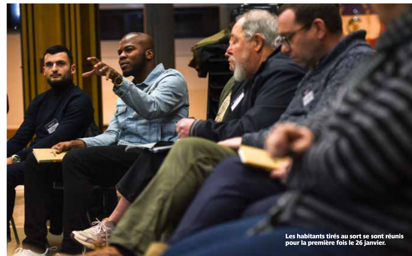
Les habitants tirés au sort se sont réunis pour la première fois le 26 janvier.