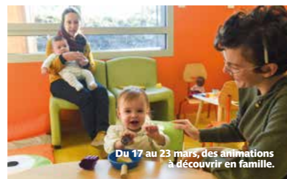
Du 17 au 23 mars, des animations à découvrir en famille.

tenant compte d'allergies et d'intolérances alimentaires, ou de convictions personnelles. On découvrira le yoga adapté, on participera à des jeux, on assistera à des conférences, on se bandera les yeux ou on testera le déplacement en fauteuil pour se mettre un peu mieux à la place de personnes porteuses de handicap... Le programme a été coconstruit par l'équipe de bénévoles, les partenaires (Arpej, Espace départemental des solidarités, cinéma Saint-Paul, CAF, différents services de la Ville) et bien sûr avec les parents et les habitants du quartier « pour coller au plus près aux besoins et envies repérés dans le quartier ».