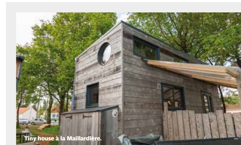
Tiny house à la Maillardière.