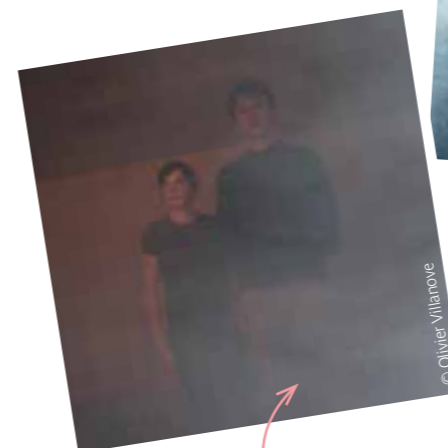
La Cour des contes