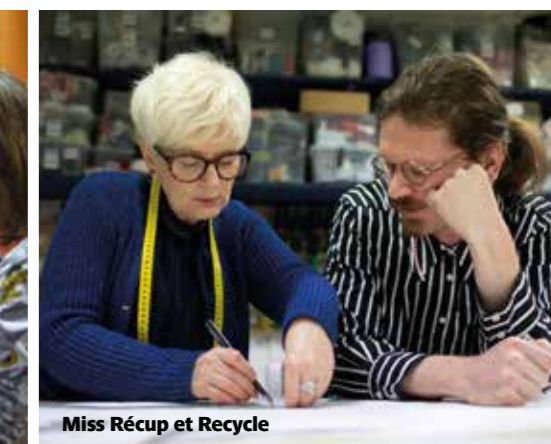
Miss Récup et Recycle