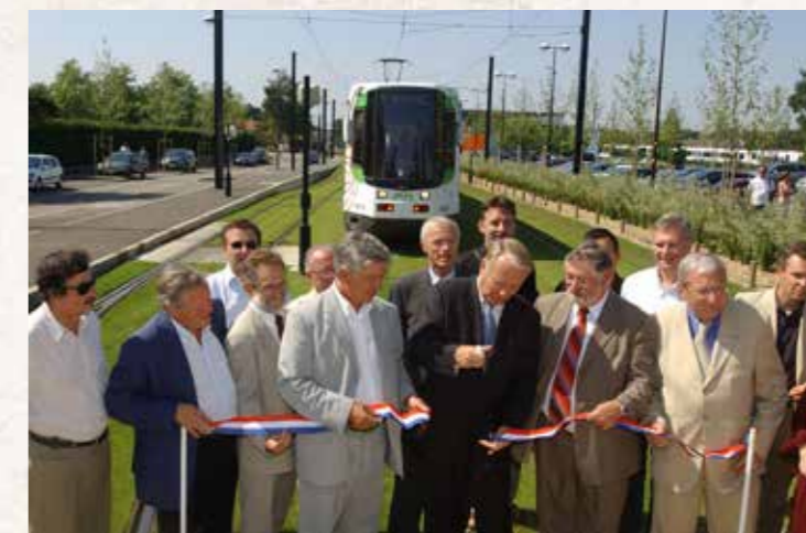
En 2006, la ligne 2 est étendue de Trocardière à Neustrie (Bouguenais). Un an plus tard, c'est la ligne 3 qui reprend le terminus de Neustrie, laissant à la ligne 2 le soin de desservir Rezé jusqu'à sa station Pont-Rousseau.