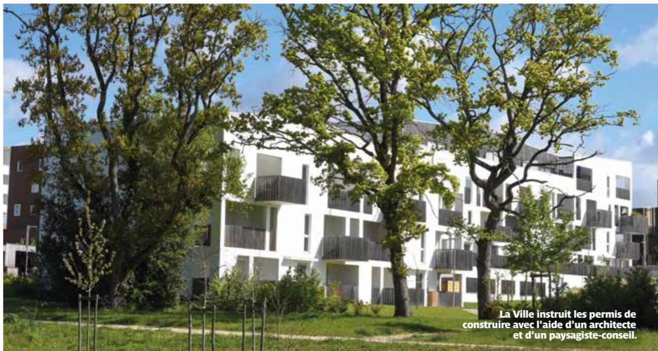
La Ville instruit les permis de construire avec l'aide d'un architecte et d'un paysagiste-conseil.