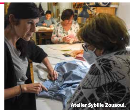
Atelier Sybille Zouaoui.

INFOS – Secrétariat des élus, 02 40 84 43 47