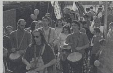
Le quartier de Ragon a donné le ton de la fête en organisant récemment un défilé carnavalesque.

Première édition d'une fête de ville, au cours de laquelle chaque quartier est invité à se colorer et chaque habitant à se retrouver sur l'espace public pour faire la fête. Se reporter à la dernière page de ce numéro de Rezé-Infos. Un n° spécial de Rezé-Infos consacré à la manifestation sera distribué en boîte aux lettres courant juin. Les 22 et 23.