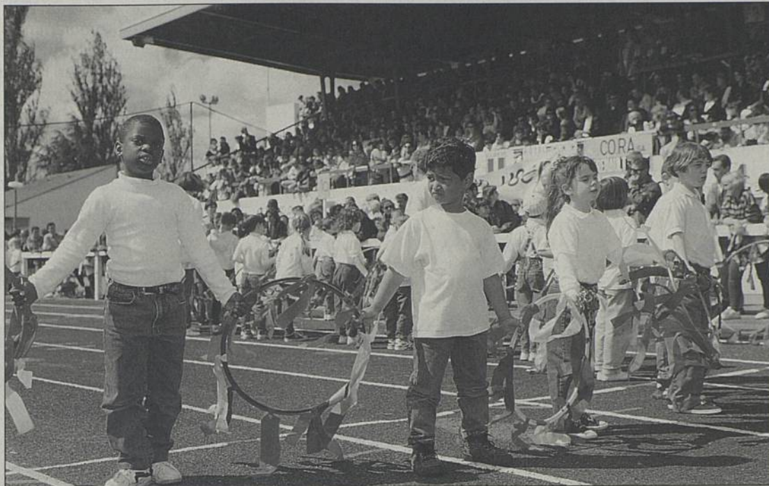
950 enfants réunis autour des installations sportives de la Trocardière.

La fête de l'Union sportive de l'enseignement du 1er degré (USEP), qui réunira 950 enfants de 9 écoles publiques (1), aura lieu le 5 juin. Plusieurs ateliers sont programmés, de 9 h à 10 h 30, à la piscine, au gymnase des Cités Unies, sur tous les terrains et la piste du stade Léo Lagrange de la Trocardière. Au cours de cette grande fête, tous les enfants auront à cœur de montrer à leurs parents et amis ce qu'ils pratiquent en cours d'année en matière d'éducation physique et sportive. Les activités présentées, organisées sous forme de rencontres entre deux ou plusieurs classes, sont très variées : gymnastique, sports collectifs, athlétisme, patinage à roulette, natation, ultimate, balle ovale, hockey, etc.