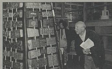
Hyéroglyphes, alphabets anciens, fragments de poèmes constituent la Tour écrite.

Médiathèque Diderot. Entrée libre. Renseignements : 02 40 04 05 37.