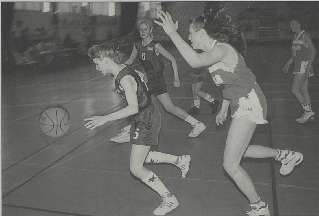
Le tournoi cadettes est organisé par les trois clubs de basket de Rezé (Rezé basket 44, section basket du Cercle Saint-Paul, Amicale laïque de l'Ouche-Dinier) avec le concours de l'Office municipal du sport de Rezé et de la Ville.

La 10 e édition du Rezé Basket International (RBI) aura lieu au gymnase des Citées Unies (Trocardière) le week-end de la Pentecôte. Depuis sa création, le tournoi cadettes a évolué, devenant un événement sportif majeur dans la région.