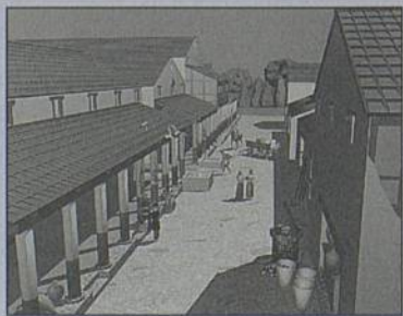
La Cité antique de Ratiatum... reconstituée par images de synthèse. (© Imagence, Boutique Multimédia).

En effet, l'agglomération antique de Ratiatum, née il y a 2 000 ans, occupe une partie du sous-sol de la ville moderne. Depuis quelques années, de nombreuses recherches ont ailleurs été effectuées. Ainsi en 1991, la fouille d'un terrain de près d'un hectare près du centre-bourg historique (boulevard Le Corbusier) a permis de mettre à jour un quartier