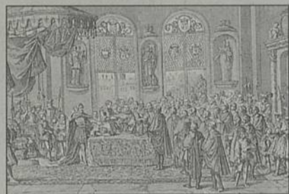
L'enregistrement de l'Édit de Nantes par le Parlement de Paris, le 25 février 1599.

Du 18 au 28 mai, salle Moyano, Hôtel de Ville. Entrée gratuite.