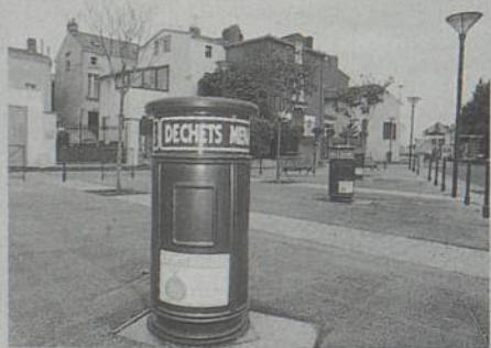
Sur la place Levoyer, n'est visible en surface qu'une borne d'introduction des déchets, dont l'aspect général rappelle une corbeille de rue standard.

S'il présente des avantages, ce système constituera en revanche une contrainte pour les habitants du quartier, notamment les restaurateurs, qui devront ensacher leurs déchets dans des sacs de taille réduite et, pour certains, les emporter plus loin de leur habitation qu'auparavant. Le coût de l'opération s'élève à 28 203 € / 185 000 F.