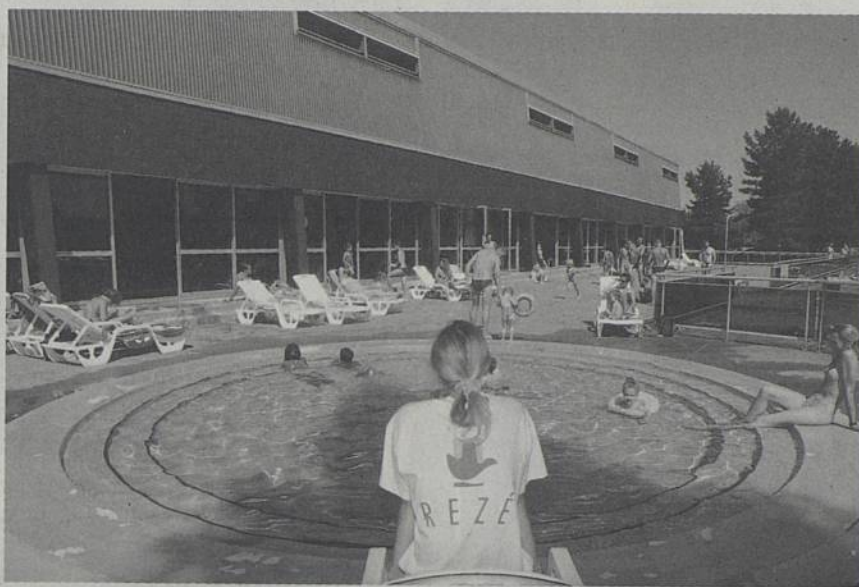
Vue des extérieurs de la piscine (pataugeoire, solarium...).

A compter du 2 juillet et jusqu'au 26 août, la piscine municipale, avenue Léon Blum, sera ouverte le lundi de 14h30 à 17h30 et de 18h à 20h15, du mardi au vendredi de 10h à 13h30, de 14h30 à 17h30 et de 18h à 20h15, le samedi de 10h à 12h30 et de 14h à 17h, le dimanche de 9h à 12h30 et de 14h à 17h. L'établissement sera fermé le 14 juillet et le 15 août. L'accès à la piscine est gratuit pour les Rezéens de moins de 18 ans tous les après-midis de 14h30 à 17h15. Cartes de gratuité à retirer auprès de l'accueil sur présentation de pièces (facture EDF ou loyer et d'une pièce d'identité) justifiant la domiciliation à Rezé.