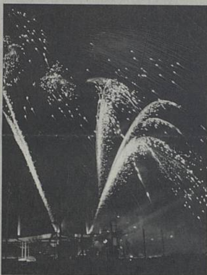
Le feu d'artifice débutera à la tombée de la nuit, vers 23 heures.

C'est ainsi que la fête nationale du 14 juillet sera placée, cette année à Rezé, sous le signe des relations internationales. Ce rendez-vous est programmé le vendredi 13 juillet, dans le parc de la Butte de Praud. Une exposition des travaux réalisés par les jeunes du camp international organisé à Rezé depuis le 2 juillet (se reporter au supplément de Rezé-Infos du mois de juin) débutera la soirée. Puis à partir de 21 h, les jeunes – des Roumains, des Irlandais et des Italiens – proposeront de courts spectacles de théâtre et de musique. A 22 h 50, la délégation de chaque pays prononcera une déclaration qui sera traduite en français. Ensuite, place au spectacle pyrotechnique sur le thème des pays représentés ■