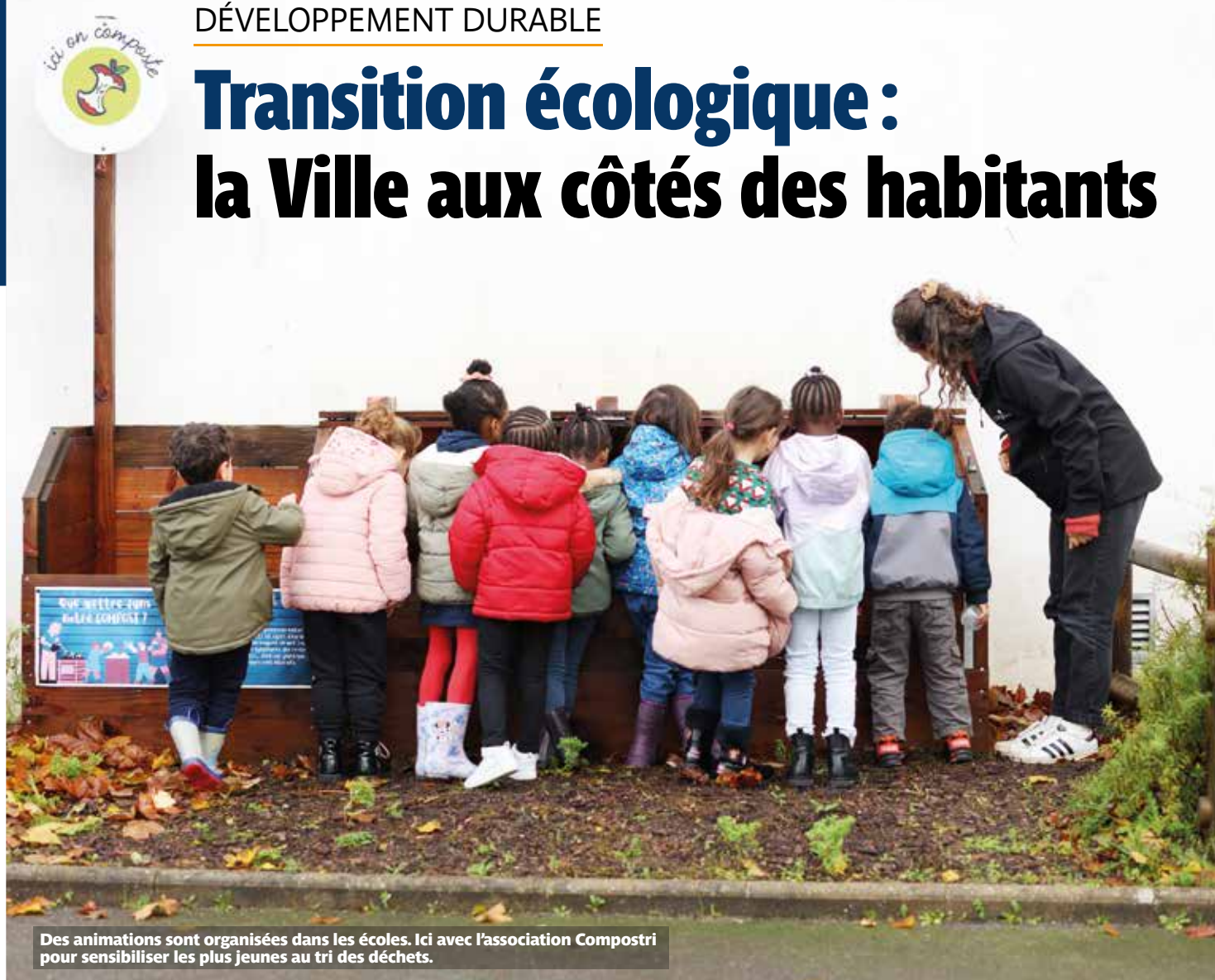
Des animations sont organisées dans les écoles. Ici avec l'association Compostri pour sensibiliser les plus jeunes au tri des déchets.