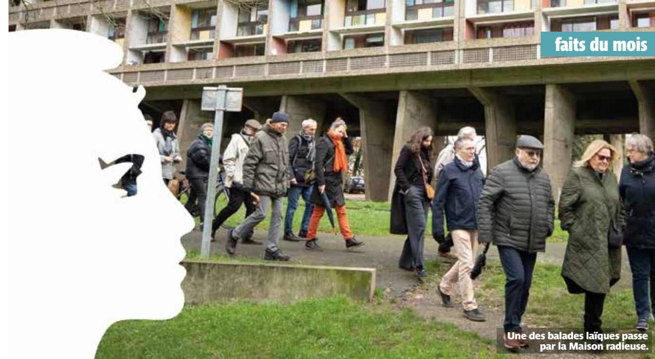
Une des balades laïques passe par la Maison radieuse.

Comme l'an dernier, la Ville concentre les illuminations dans quelques secteurs pour réduire ses consommations d'énergie. Une partie des quartiers Ragon, Château et Pont-Rousseau scintilleront de lumière du 8 décembre au 8 janvier, de 7h à 8h30 et de 17h30 à 22h. Nouveauté cette année : des décorations en bois créées par les services municipaux seront visibles sur le parvis de l'hôtel de ville, à La Houssais et Ragon.