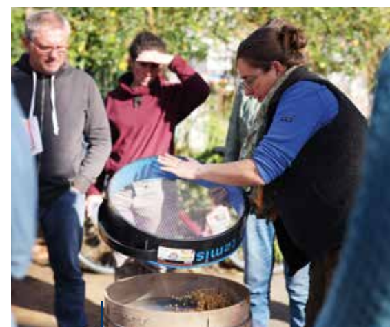
Dans les jardins collectifs, les jardiniers amateurs peuvent désormais suivre des formations.

Besoin d'être accompagnés sur un projet en lien avec la transition écologique ? Prenez rendez-vous par téléphone (02 40 13 44 10) ou par courriel (animationdestransitions@mairie-reze.fr).