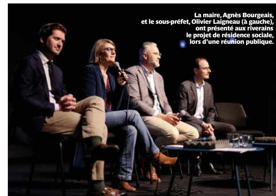
La maire, Agnès Bourgeais, et le sous-préfet, Olivier Laigneau (à gauche), ont présenté aux riverains le projet de résidence sociale, lors d'une réunion publique.

Une résidence pour des personnes étrangères venant s'installer en France et pour des travailleurs pauvres vivant à Rezé va ouvrir à Rezé à l'été 2025. Les habitations provisoires seront installées à côté de la gare de Pont-Rousseau.