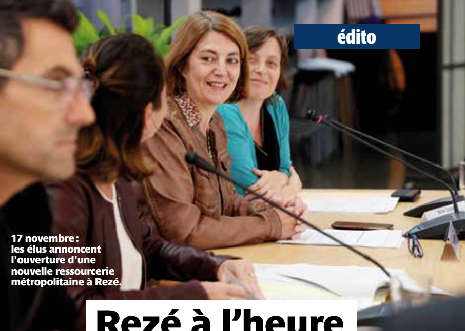
17 novembre : les élus annoncent l'ouverture d'une nouvelle ressourcerie métropolitaine à Rezé.