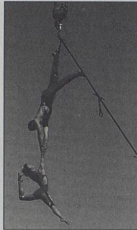
L'Épate en l'air

La campagne d'abonnement débutera le 1 er septembre. Coup d'envoi des spectacles le 19 septembre avec les Régates de Trentemoult, qui accueillent l'Épate en l'air, un duo de trapézistes époustoufflant. En route pour une année de plaisirs !