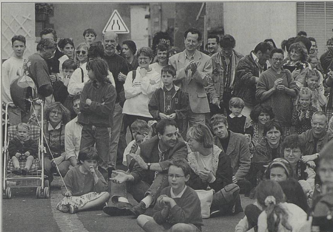
Pour une analyse plus fine des chiffres du recensement, il faudra attendre l'automne et la publication des résultats par quartiers.

Les résultats provisoires du recensement national indiquent une hausse de 5,82 % de la population rezéenne. Après une forte baisse entre 1975 et 1982 (- 6,82 %), puis une baisse plus modérée entre 1982 et 1990, le nombre d'habitants augmente donc à nouveau, passant de 33 262 (recensement de 90) à 35 200 cette année. Une explication : l'ouverture de terrains à l'urbanisation a favorisé la reprise de la construction neuve