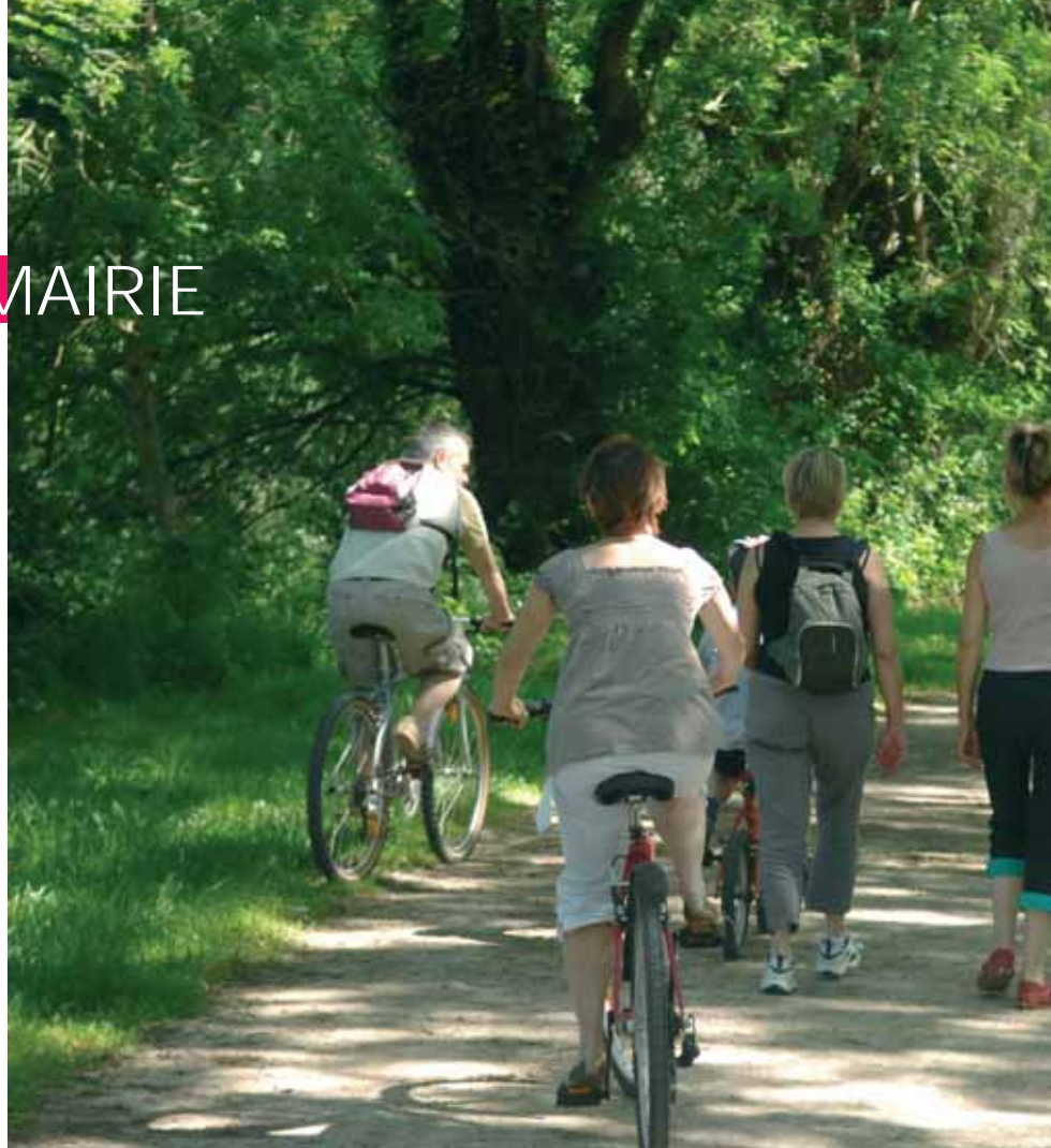
La Sèvre déroule quelques heures de promenade, de Pont-Rousseau jusqu'au quai

En mettant des vaches dans les prés, en fauchant deux fois par an et en replantant des saules et des frênes, les prairies de Sèvre ont retrouvé leur caractère d'origine.