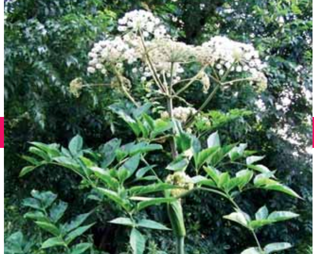
Angélique des estuaires. Plante protégée en Europe. Se reconnaît à ses fleurs en ombelles blanches. Uniquement présente dans les estuaires atlantiques français. A observer sur les bords de Sèvre, le long des étiers traversant les prairies et sur les rives de Loire.