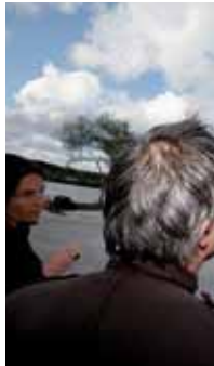
Estuaire 2009 : l