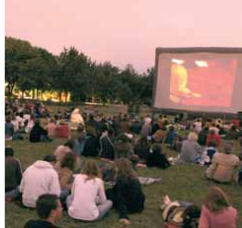
Cinéma en plein air