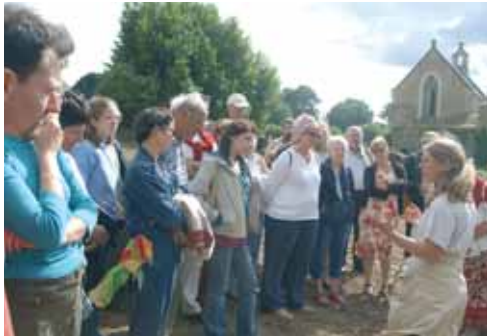
Visite du site Saint-Lupien

Rendez-vous sur le site archéologique de Saint-Lupien. Gratuit (chapelle non accessible). Rens. 02 40 84 43 96.