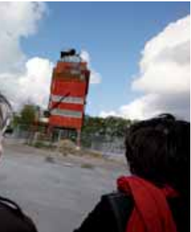
Pendule de Roman Signer