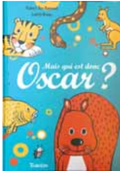
De la lecture pour l'été