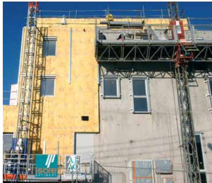
Une isolation extérieure renforcée.