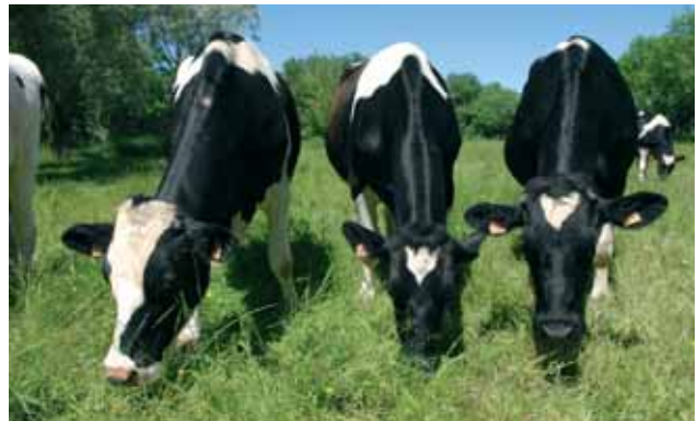
Les tondeuses des prairies.