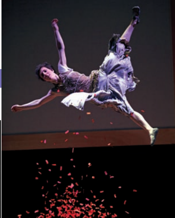
Le cirque Plume, jusqu'au 14