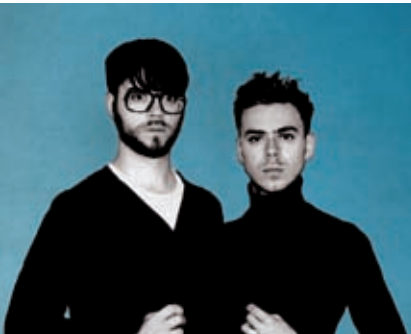
Curry &amp; Coco, le 12