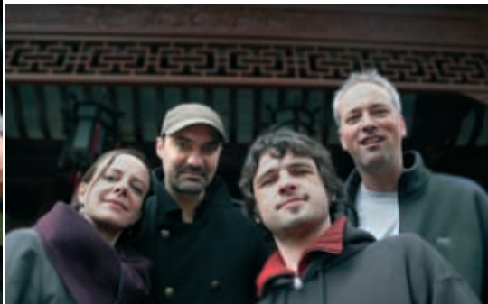
Rue d'la Gouaille, le 18