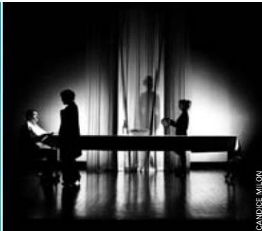
La chute de la maison Usher, le 25