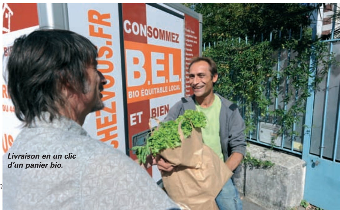
Livraison en un clic d'un panier bio.