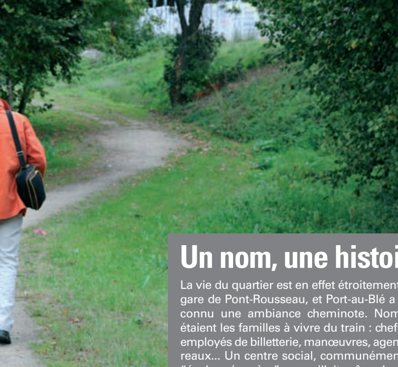
Au Port-au-Blé, un sentier pédestre vient d'être aménagé.