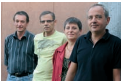
Quatre des responsables de section, aujourd'hui présidents d'association.