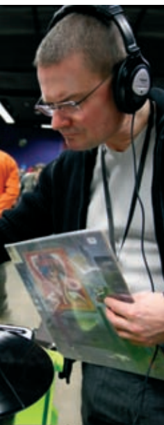
disque, les 27 et 28