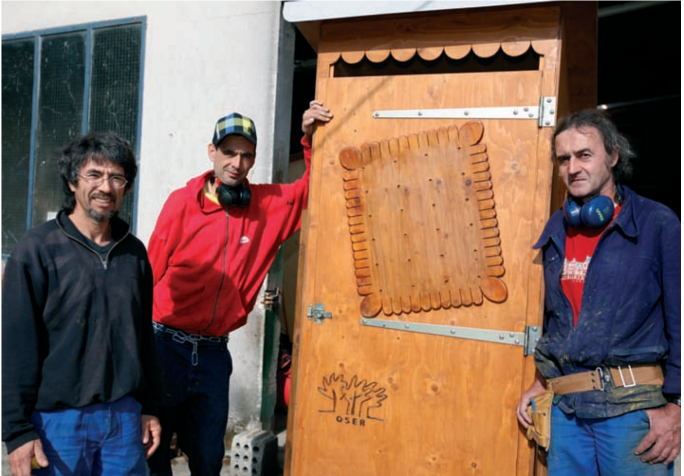
Le modèle "Petit Lu", une création Oser Forêt Vivante.